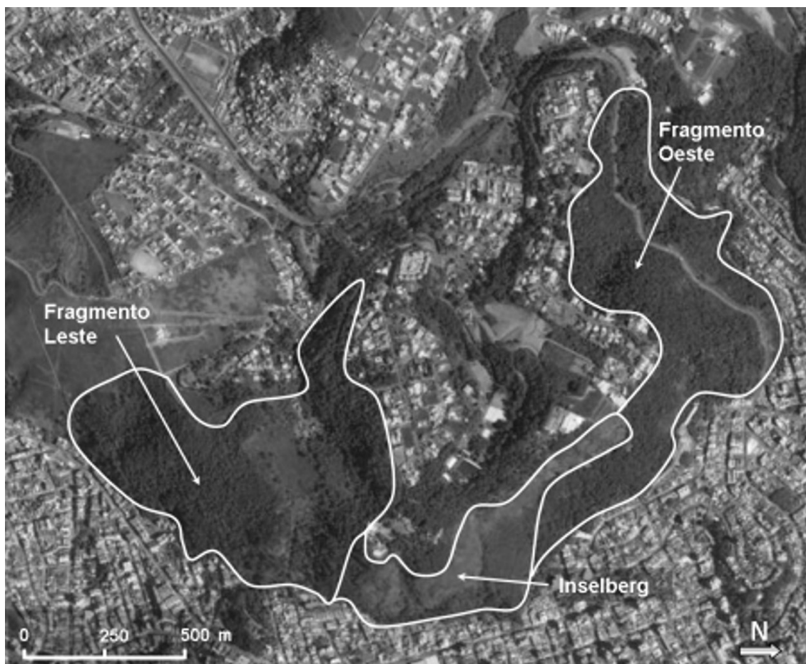
Figura 1 – Imagem da mata Morro do Imperador, Juiz de Fora, Minas Gerais com o posicionamento do Inselberg separando os fragmentos leste e oeste.

mirante do Cristo. De acordo com Fonseca & Viera (1995), a área foi tombada pelos Decretos Municipais 4312/90 e 4355/90 e apresenta cerca de 78 ha, pertencente a proprietários diversos, sendo que 84,2% está ocupada pela escarpa íngreme do inselberg e por dois fragmentos de mata separados entre si: um a oeste (cerca de 53 ha) e outro a leste (cerca de 25 ha) do marco zero do Município, sendo o do oeste maior e cortado por uma importante via de acesso do centro à zona oeste da cidade. O restante da área é composto por vegetação rasteira e pastagens (Fig. 1). A mata em questão é classificada como Floresta Estacional Semidecidual Submontana, no sistema do IBGE (Veloso et al. 1991), e integra o domínio da Mata Atlântica (Oliveira-Filho & Fontes 2000), em conformidade com Decreto Federal 750/93.