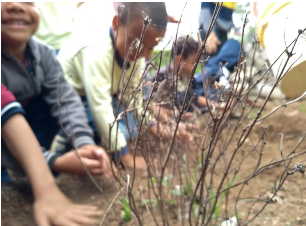
Figura 1 – Trabalho das crianças na horta da E. M. Santana de Itatiaia

Na hora da organização para produzir os materiais tive um pouco de dificuldade. Escolhi uma data na qual o local onde iria filmar não estava disponível. Logo após tive a ideia de utilizar a própria Universidade Federal de Juiz de Fora. As imagens ficaram incríveis. Na Universidade também tive dificuldade para escolher o local certo, pois, cada paisagem da mesma da vontade de fazer uma filmagem e um trabalho diferente. Fiz pelo menos uma imagem para que ficasse como registro da reportagem escrita, que produzi como um dos produtos, conforme figura 1.