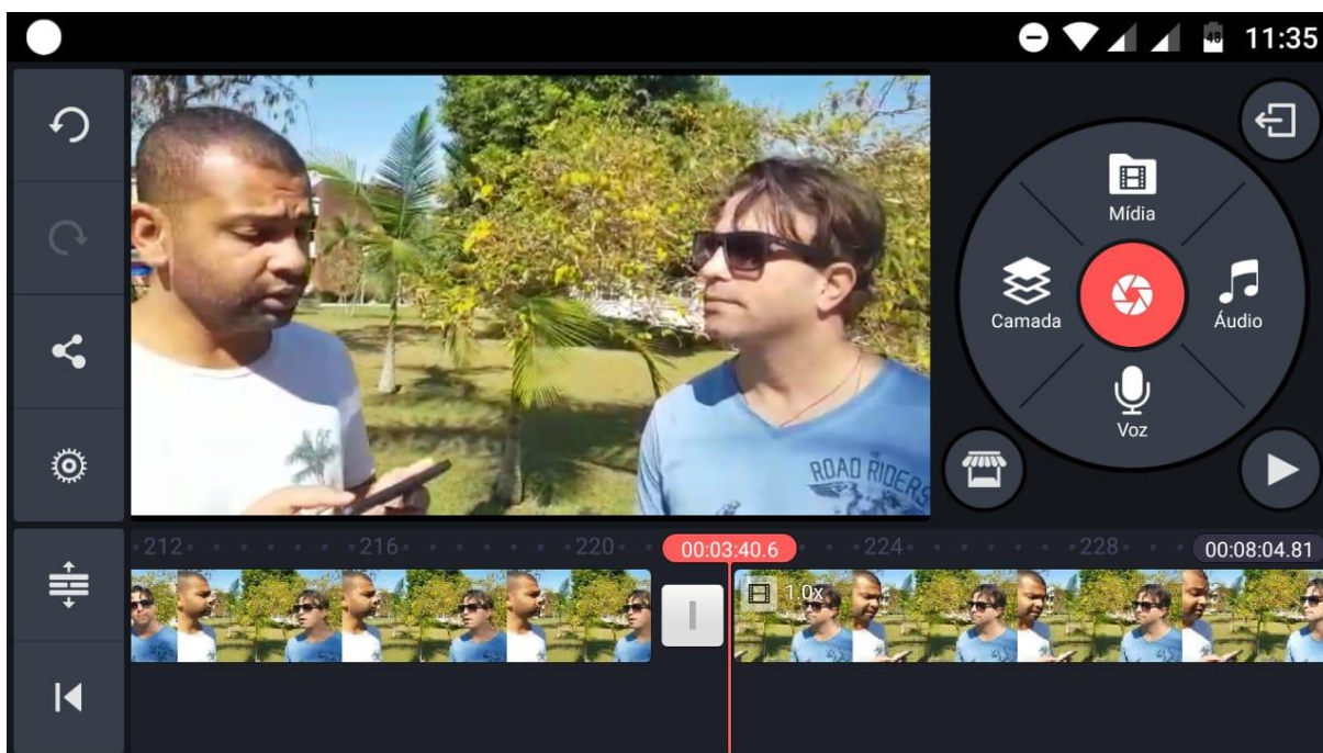
Figura 3 – Edição do vídeo em andamento