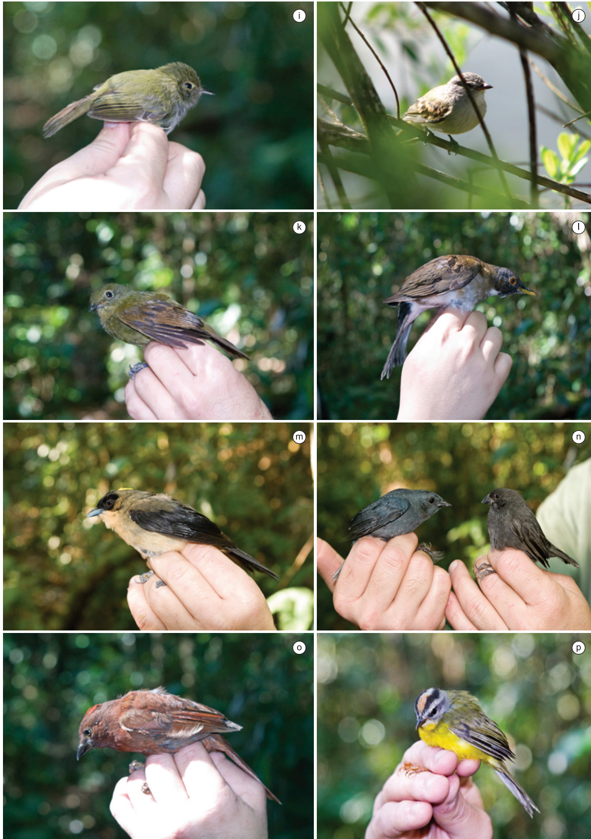
Figura 1. Continuação. i) Hemitriccus diops ; j) Camptostoma obsoletum ; k) Schiffornis virescens ; l) Turdus albicollis ; m) Trichothraupis melanops ; n) Haplospiza unicolor (esquerda) e Tiaris fuliginosus (direita); o) Habia rubica ; p) Basileuterus culicivorus .