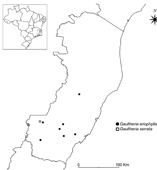
Figura 3 – Mapa de distribuição geográfica das espécies de Gaultheria no Espírito Santo, Brasil.

Subarbusto a arbusto 0,2–2 m alt.; tricomas tectores nos ramos, folhas e flores, alvos, tricomas glandulares presentes ou não, nos ramos, folhas e raque da inflorescência, ferrugíneos, raramente glândulas clavadas diminutas nos ramos e folhas;