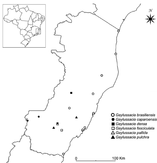
Figura 4 – Mapa de distribuição geográfica das espécies de Gaylussacia no Espírito Santo, Brasil.

a planície costeira até as cadeias montanhosas da Região Centro-Oeste, além de ser a espécie mais variável morfológicamente dentro do gênero (Kinoshita & Romão 2011; Romão 2011). No aspecto geral da planta, essa espécie assemelha-se a outras quatro espécies do gênero, das quais apenas G. pulchra Pohl ocorre no Espírito Santo, sendo as demais: G. amoena Cham., G. martii Meisn. e G. retusa Mart. ex Meisn. Em geral, G. brasiliensis