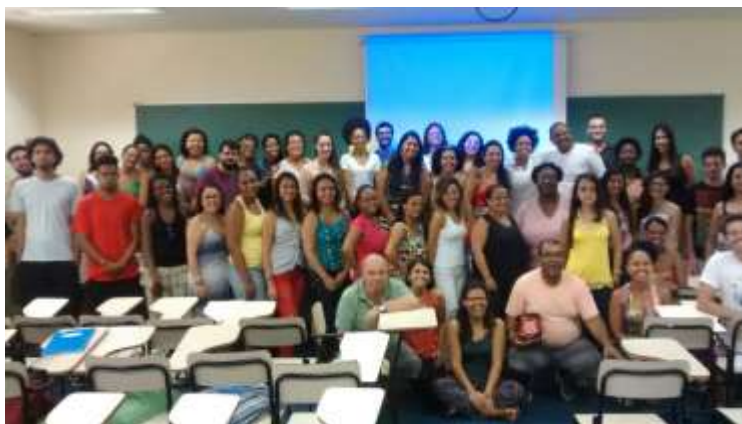
(Foto 7. Turma do curso de Especialização História da África, 2015)

nação brasileira surgida, também, em decorrência da herança africana trazida por diversos grupos étnicos vindos durante a diáspora negra.