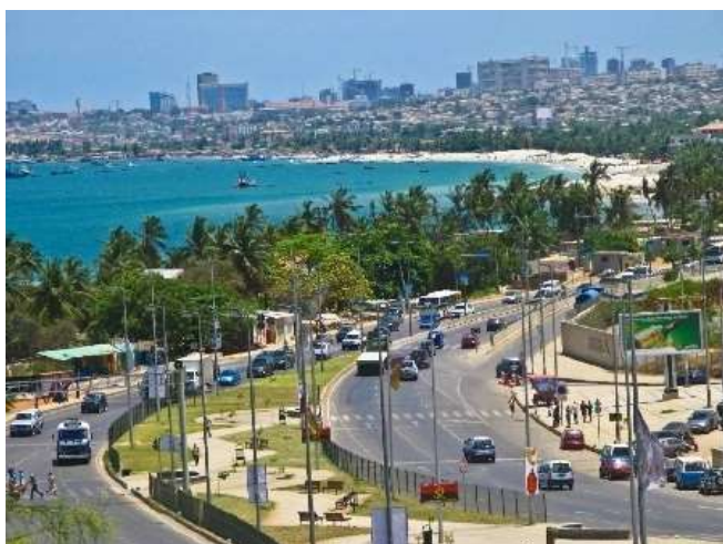
(Vista panorâmica de Luanda)

A capital do país é Luanda. Uma cidade que lançou nomes da literatura angolana como o de Ondjaki.