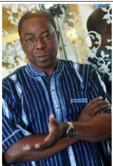
Foto 6. Luís Bernardo Honwana

Luís Bernardo Honwana é um dos poetas pertencentes à década de 60 em Moçambique. Nasceu na cidade de Lourenço Marques, atualmente conhecida como Maputo no ano de 1942. Ainda viveu no interior do país com seus pais já que em Goamba, seu pai trabalhava como intérprete.