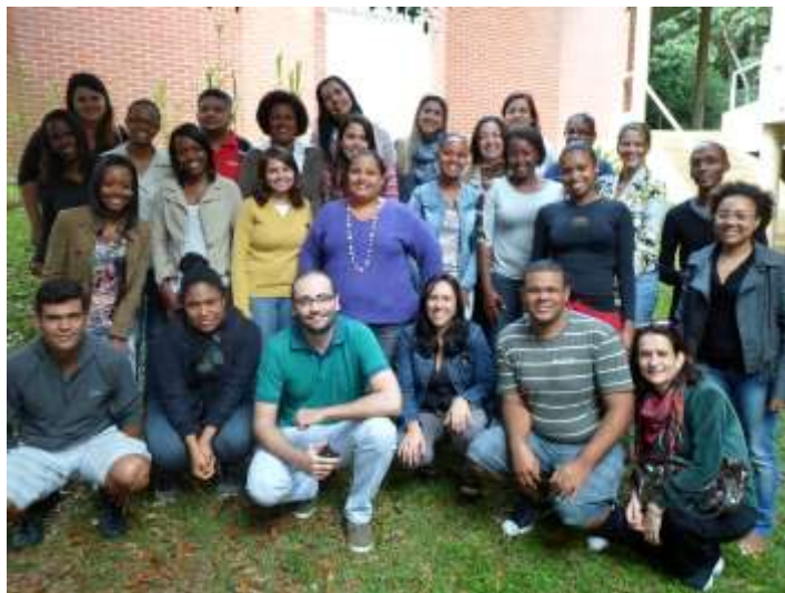
(Foto 6. Turma do curso de Especialização Literatura e Cultura Afrobrasileira, 2013)

Embora o conhecimento apreendido no curso de certo modo fosse voltado para a realidade brasileira, estabeleci laços com tais teorias a fim de aplicar na área de Língua Inglesa, que atualmente tenho trabalhado nas escolas, buscando abordar a questão da presença dos povos africanos na América, especificamente em países como o Brasil, Cuba e os Estados Unidos.