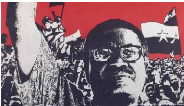
Cartaz do MPLA representando Agostinho Neto e o povo angolano

É somente em novembro de 1975, que é declarada a independência de Angola pelo almirante Leonel Cardoso, retirando a soberania de Portugal. Os três movimentos de libertação proclamaram a independência de Angola a partir dos representantes: Holden Roberto, representante da FNLA, Jonas Savimbi, representante da UNITA e Agostinho Neto, presidente do MPLA, portanto assim passando este Estado a se chamar República Popular de Angola.