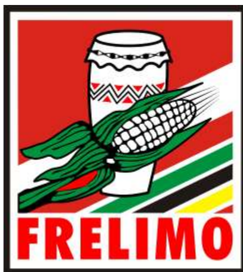
Foto. FRELIMO. Disponível em < http://www.escopil.com/stae/RENFORM/v2%20Logos_Political%20parties/FRELIMO/FRELIMO-PARTIDO%20FRELIMO.jpg >. Acesso em 14 jan. 2017.

Faça uma leitura do texto acima. Observe detalhadamente os elementos que compõem a imagem.