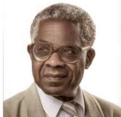
Foto 1. Aimé Césaire