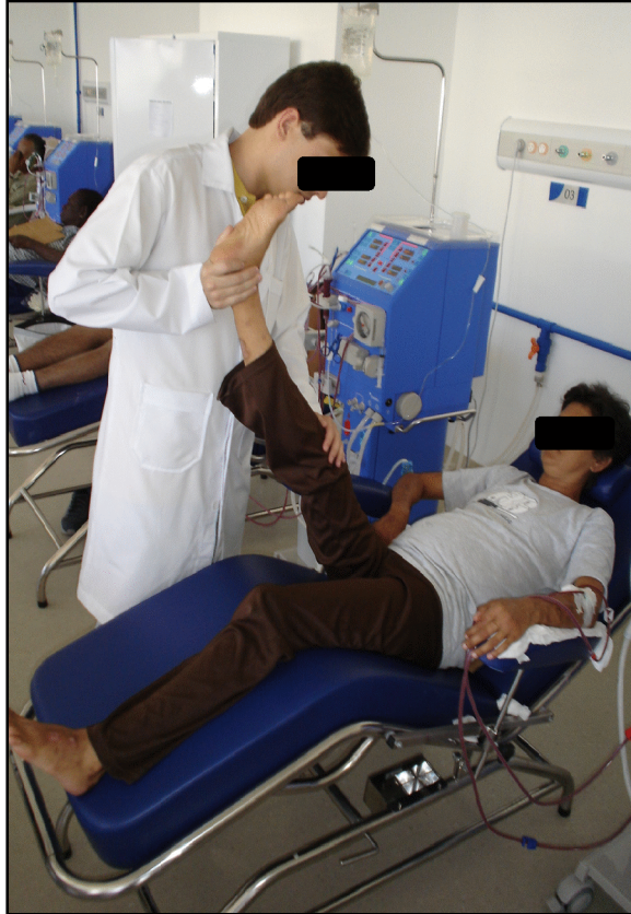
Figura 1 – Alongamentos de membros inferiores durante a HD.

A etapa de condicionamento envolveu a realização de exercício aeróbico por 30 minutos (Figura 2). Nesta etapa, a intensidade do treinamento foi individualizada e determinada com base na escala de Borg, aplicada a cada cinco minutos. Considerávamos o trabalho como satisfatório quando o paciente atribuía ao esforço valores entre 11 e 13 pontos nesta escala (exercício leve a um pouco intenso). A FC foi monitorada por meio de um cardiofrequencímetro da marca polar modelo F1. Inicialmente, o tempo de exercício aeróbico aplicado dependeu da tolerância de cada paciente, mantendo a intensidade do exercício sempre constante, em 50RPM.