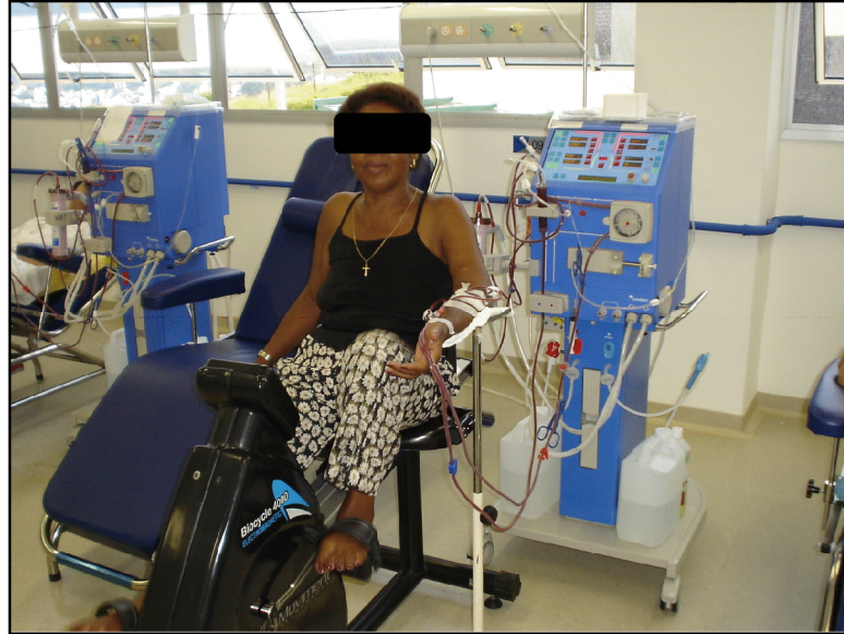
Figura 2 – Exercício aeróbio durante a HD.

O resfriamento consistiu de dois a três minutos de exercício aeróbio com a carga de 0,5 kpm e rotação de 35 rpm e, novamente, alongamento passivo de membros inferiores. A PA era aferida no repouso, a cada 5 minutos da fase de condicionamento e após o resfriamento.