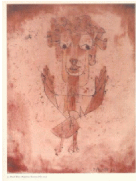
Figura 3: Paul Klee: Angelus Novus , 1920