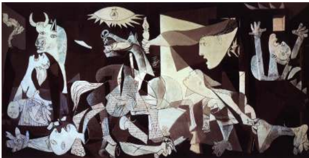
Figura 1: Picasso: Guernica , 1937

Guernica , célebre pintura cubista de Picasso, evidencia essa faculdade da imagem de falar ao homem de forma intensa: