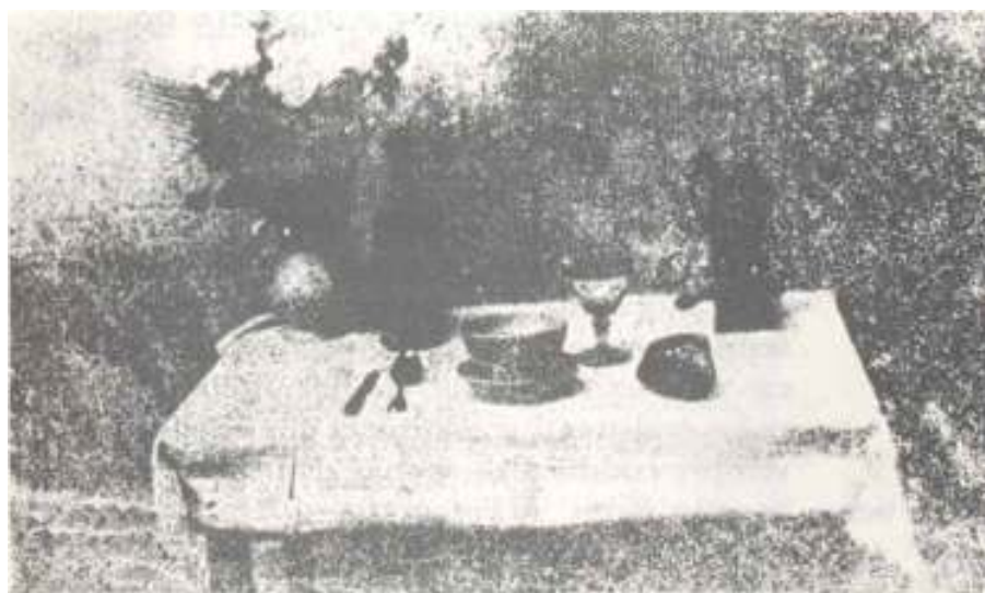
Figura 5: Niepce: Mesa posta , cerca de 1822. 9

Mas foi em meados do século XIX que, depois de seguidas investigações, Daguerre e Niepce conseguem, simultaneamente, fixar a imagem mecanicamente, através de processos químico-óticos. Niepce, ao aprimorar a técnica, faz, em 1822, uma das primeiras fotos contempladas pelo homem, Mesa Posta :