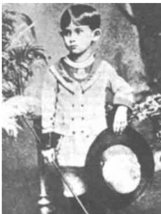
Figura 4: Kafka

Dessa forma, Benjamin demonstra que a imagem convoca o pensamento assistindo de forma relevante no seu processo de elaboração. Um outro exemplo de como a imagem pode compor a análise e construir o pensamento sobre determinada pessoa ou objeto, está em uma foto de Kafka. Benjamin, através da observação e descrição da imagem fotográfica, tenta decifrar e relacionar a personalidade do escritor, como também sua literatura: