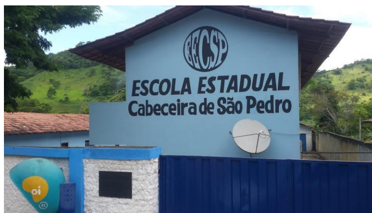
Figura 4 - Fachada da Escola Estadual da Cabeceira de São Pedro

A Escola Estadual da Cabeceira de São Pedro está localizada na zona rural de Teófilo Otoni, às margens de uma rodovia estadual. Pertence à Superintendência de Regional de Ensino (SRE) de Teófilo Otoni, sendo essa a 37ª Regional da SEE. A Figura 4 abaixo mostra a fachada da Escola Estadual da Cabeceira de São Pedro.