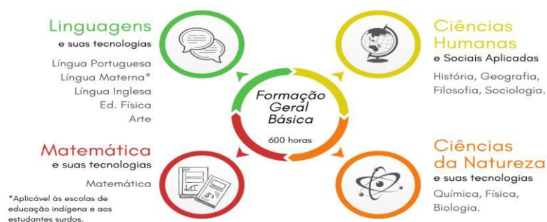
Figura 1 - Detalhamento da Formação Geral Básica (FGB)