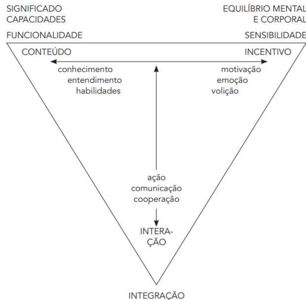
Figura 5 - As três dimensões da aprendizagem e do desenvolvimento de competências