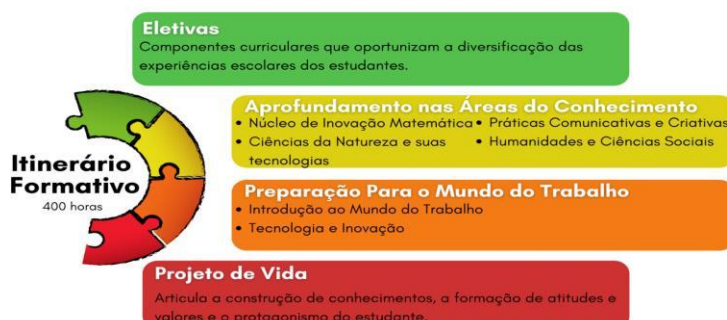
Figura 2 - Detalhamento dos Itinerários Formativos