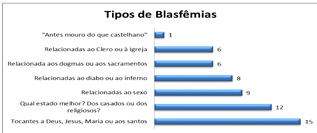
GRÁFICO 1 – TIPOS DE BLASFÊMIAS PRONUNCIADAS NO BRASIL COLONIAL (XVI-XVIII)