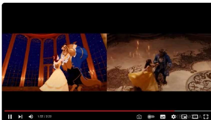
Beauty and the Beast Trailer 2 - 1991 vs 2017 Comparison/Side by Side