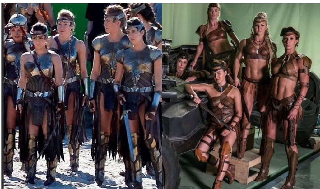
Figura 4 – Amazonas em Mulher Maravilha (2017) e em Liga da Justiça (2017).

armaduras com saias que lembram um estilo greco-romano e botas e sandálias gladiadoras. O traje da Mulher Maravilha é uma releitura do traje clássico das HQs, adaptado para uma realidade de cenário de guerra e referências antigas de guerreiros épicos. Hemming tenta dar autenticidade ao figurino, com inspirações encontradas em artes antigas, evitando dar qualquer teor sexualizado para as roupas (PENROSE, 2019, p. 216). Todas são pensadas a partir de uma lógica de praticidade das condições climáticas da ilha e da cultura local. Por isso, há uma diferença notável em relação às amazonas em Liga da Justiça (2017). Lançado poucos meses após Mulher Maravilha , o filme traz de volta a personagem junto com as amazonas, mas o tratamento visual das guerreiras, no entanto, muda sob o olhar masculino da direção de Zack Snyder e do figurinista Ken Crouch