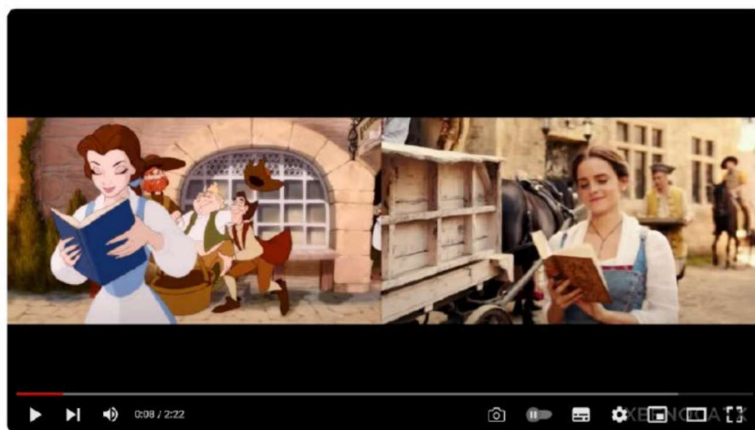
Beauty and the Beast Trailer 2 - 1991 vs 2017 Comparison/Side by Side

action . Reproduzindo cena por cena em planos, enquadramentos e falas iguais ou semelhantes ao do filme animado.