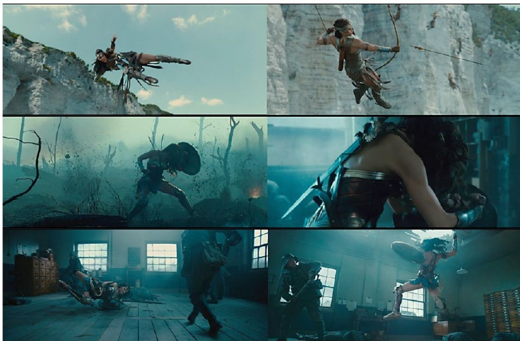
Figura 3 – Corpos das Amazonas e de Diana em combate.

Contudo, o filme recai em estereótipos e normas sociais recorrentes, assim como qualquer outro blockbuster hollywoodiano. Exemplos não faltam: corpo e rosto padrão da protagonista, ou o apagamento homoafetivo das amazonas, fazendo Diana desconhecer o conceito de casamento e o ato de andar de mãos dadas ao chegar no mundo dos homens. Em contrapartida, a câmera de Jenkins jamais explora o corpo de Diana ou das amazonas a partir de um olhar de desejo e sensualidade; sua câmera, na verdade, registra a força e astúcia de Diana. O foco no corpo da guerreira ocorre apenas quando é necessário mostrar seus movimentos de luta, objetos e gestos que contribuem para a trama.