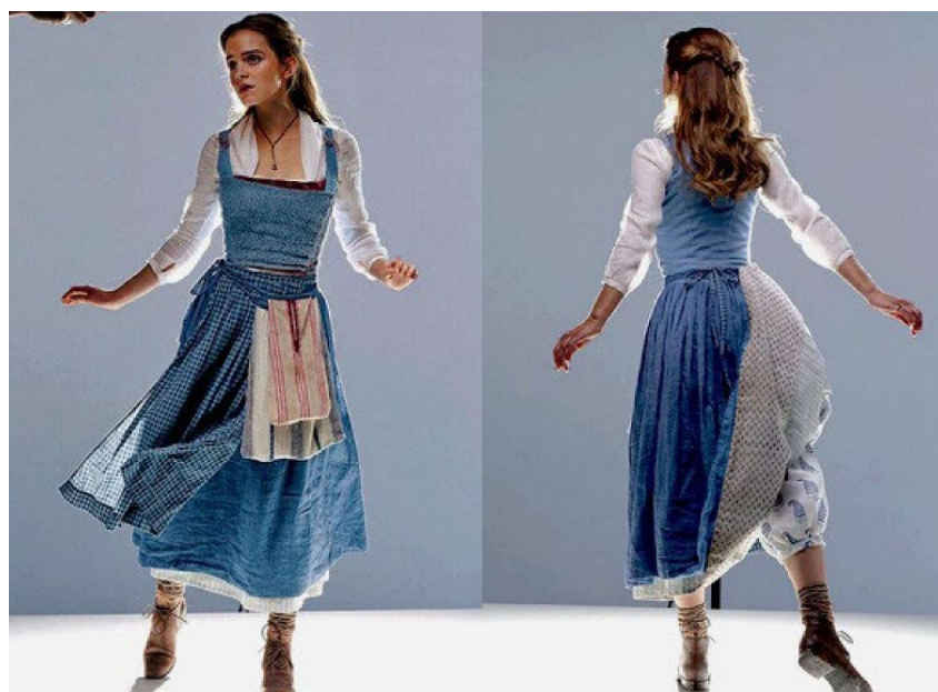
Figura 7. Emma Watson em teste figurino para Bela

Além das canções, o figurino do filme delinea como Bela é. Sua roupa de camponesa, por exemplo, busca mais por praticidade e leveza, do que por formas e cores fortes. Ela usa ceroulas com a saia pendurada por trás, para ajudar no movimento, e botas de coturno sem salto alto. O estilo da personagem reafirma a personalidade da jovem. É prática e delicada, ao mesmo tempo. O vestido possui comprimento certo para que ela possa carregar seus livros consigo para qualquer lugar. Na figura 5 é possível notá-los presos à sua cintura. O azul e branco são cores relevantes quando pensamos sobre a caracterização de hiperfeminina que ela não parece interessada em cumprir à risca.