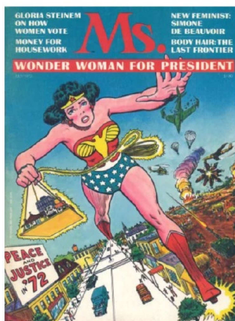
Figura 2: MS Magazine #01

época. Ela é “um exemplo significativo do modo ambíguo e contraditório que a cultura pop vem lidando com o feminismo ao longo das décadas.” 29