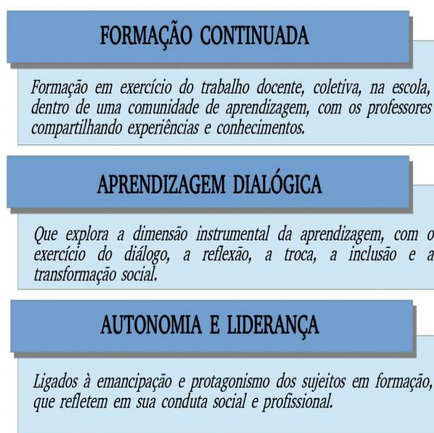
Figura 3 - Os 3 pilares do Plano de Ação Educacional

O plano proposto tem sustentação em três pilares fundamentais, ancorados na pedagogia freiriana, conforme a figura 3, abaixo.