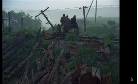
Imagem 9: Os três homens chegando à Zona.

Segundo, a articulação narrativa desvincula-se lentamente do tempo natural. A jornada, que em termos materiais é ínfima, amplia suas dimensões à inserção de percurso psíquico à realidade diegética. A aventura em prosa dissipa-se ao surgimento do lirismo poético, do encontro dos personagens ao desmonte de suas convicções racionais em apresentação fluida do inconsciente. Apesar de juntos corporeamente, os três homens embarcam jornadas em si próprios, sozinhos, enfrentando demônios inimagináveis nem sempre representados em tela, mas constatados aos estados de espírito apresentados entre as sequências. Ao fim do filme, modificados pela opressão mortífera da atmosfera da Zona – que em verdade é a opressão de olharem dentro de si mesmos –, conseguem compreender sua pequenez ao mundo titânico. Atestam, ao se deslocarem de um mundo apolíneo de regências formais, ao espaço titânico que retira todas suas certezas, fora a da iminência de morte, que a superação do sofrimento, da dor originária na Vontade, é impossível. Mesmo se saciassem o mais profundo desejo, a Vontade é inesgotável, logo, o sofrimento também. O Stalker, como mencionado, sequer esboça sua entrada à sala; o Professor, retira a bomba da mochila para destruir o lugar, mas desiste de destruí-lo e também não esboça desejo de adentrar o cômodo; por fim, o Escritor, único de convicções quanto ao objetivo, não precisa passar do portal ao cômodo para o deslumbramento. Sobre a jornada, Tarkovski comenta: