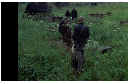
Imagem 5: O ambiente natural da Zona.

Incorrendo à abordagem trágica, a Zona poderia se tratar de uma força titânica exposta ao mundo de regência apolínea, logo, a presença desta traz perigos inimagináveis que devem ser abatidos pela resistência do apolinismo. Tal resistência é visualizada logo ao princípio do filme, quando se percebe que o local é cercado e vigiado ininterruptamente pelo exército soviético. Estando em meio ao caos do mundo industrial, científico e racionalista, a Zona se coloca como vislumbre de um período sombrio à humanidade, em que o princípio de individuação ocorria no plano da existência mesma – do sangue pelo sangue –, palco das manifestações inconscientes da Vontade. É o retorno das pulsões da Vontade recalçados sob a luz do apolinismo.