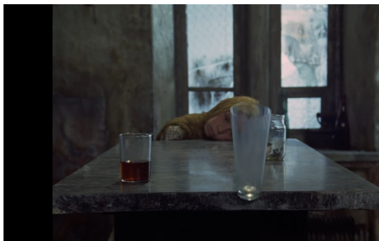
Imagem 10: Os poderes telecinéticos da filha do Stalker.

qualidades telecinéticas, a figura da menina suscita um estado superior das capacidades humanas comuns, só possível pela fé incorruptível do Stalker e seu envolvimento íntimo à Zona.