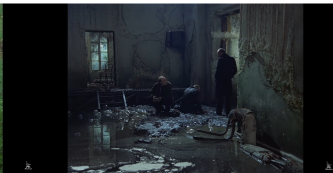
Imagem 6: Os três personagens à porta da sala.

O mundo industrial, de ferro fundido, com locomotivas, prédios de concreto, armas de fogo e usinas, apresentado no princípio do filme, é contrastado à experiência da Zona, um espaço natural, silencioso, de ruínas das construções da sociedade apolínea, entranhadas à natureza que se emaranha em seus escombros e os toma. O apelo estético do local, criado por