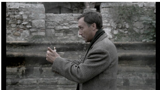
Imagem 1: Gorchakov atravessa a terma vazia.

apenas um louco, mas Gorchakov concorda com sua ideia — nascida de um profundo sofrimento — de que as pessoas devem ser resgatadas, não separada e individualmente, mas em conjunto , da insanidade impiedosa da civilização moderna... (TARKOVSKI, 2010, p. 246-247)