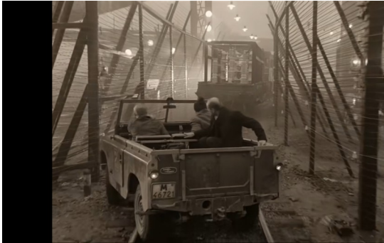
Imagem 8: A transposição do cerco militar.