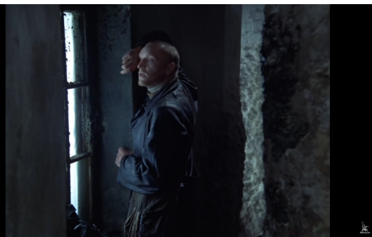
Imagem 11: O Stalker declamando versos de Arseni Tarkovski.

Também, há de se mencionar, acerca da mutação da lírica em música dionisiaca, o momento em que o Stalker, face da espiritualidade, da reconciliação e do fundamentalmente humano, profere reflexão acerca da natureza da música como arte, defendendo sua aproximação do espírito humano pela não necessidade de linguagem intermediária. A música, ao seu ver, existe em dimensão profundamente abstrata, sendo seus signos não interpretáveis pela racionalidade. Porém, ao explicitar a distância da dimensão musical à racionalidade humana, ele atesta que nenhuma outra forma de arte consegue tocar o âmago da humanidade quanto esta.