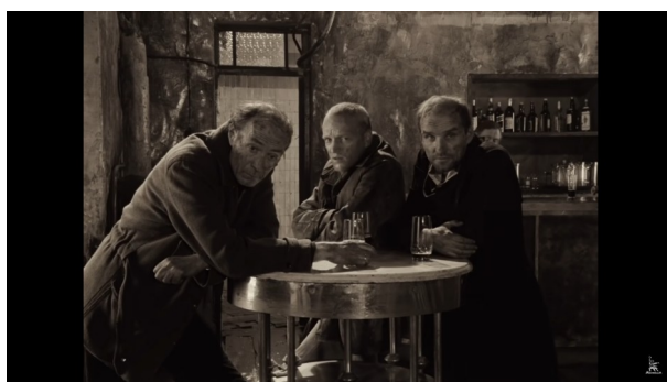
Imagem 7: O Professor, o Stalker e o Escritor, respectivamente.

Opostamente ao Escritor, há o Professor. Enquanto o primeiro é expansivo e falante, o Professor se encontra praticamente mudo. O personagem retrata o pensamento científico, de recolhimento dos dados naturais apresentados a si para a elaboração exata de uma perspectiva. É a pulsação tenaz do homo theoreticus , especulativo e de impulso sistemático. Quanto a isso, é importante frisar o caráter silencioso do personagem e a etimologia da palavra “teoria”, vinda do grego antigo, significando “contemplação” ou “introspecção”. Também, pode-se atribuir seu significado da palavra grega “theoros”, como “espectador” ou “aquele que vê”.