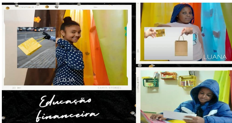
Imagem 4 – Vídeo 4: Cuidado com o cartão de crédito