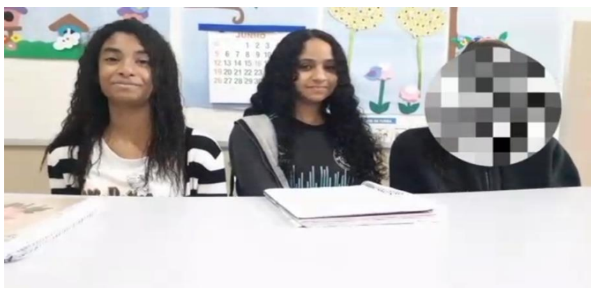
Imagem1 – Vídeo 1: Desejos ou necessidades?

O vídeo 1 foi produzido por um grupo de cinco estudantes do 7º ano A do ensino fundamental e pode ser acessado a partir do QRcode ou no link abaixo disponibilizados.