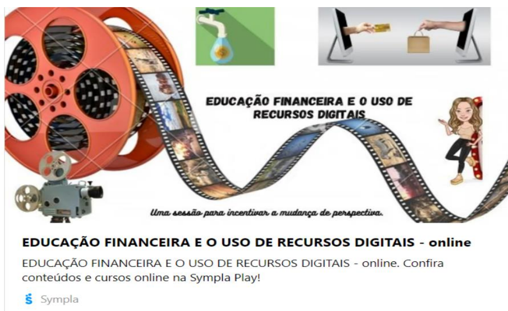
Imagem 5 – Curso Educação Financeira e o uso de recursos digitais