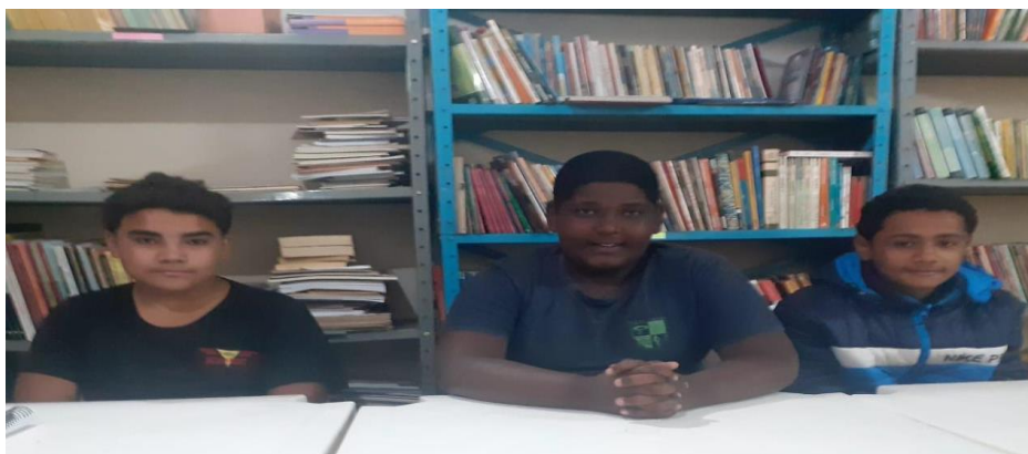
Imagem 2 – Vídeo 2: Consumismo x Lixo

O Vídeo 2: Consumismo X Lixo foi produzido por um grupo de quatro estudantes do 7º ano A do ensino fundamental e pode ser acessado no QRcode ou no link abaixo disponibilizados.