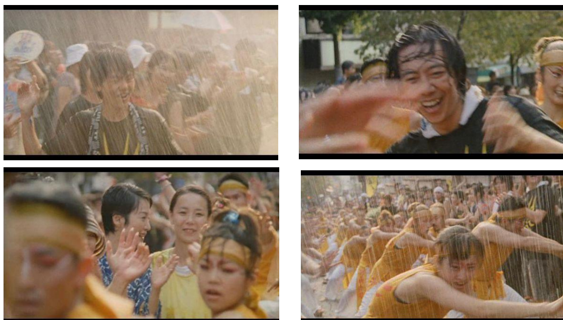
Figura 15 – Fotogramas mostrando a chuva no final da narrativa, no festival de Basara