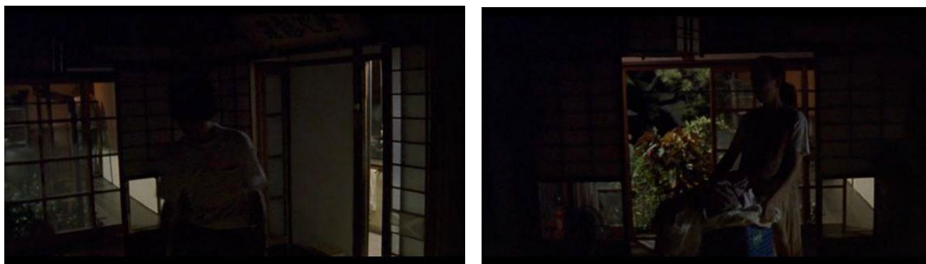
Figura 14 – Fotogramas mostrando a chuva no início da narrativa, que precede a informação da morte de Kei

trazer essa informação para a família, a função desse oficial de polícia é submeter as personagens da família a um processo de superação do ressentimento que havia ficado com a perda de Kei. Já o princípio da similaridade e repetição pode se relacionar aos dois momentos de chuva presentes na narrativa. Porém, apesar de serem dois momentos em que chove muito na narrativa, a impressão que fica é que essas chuvas “preparam o espectador” para duas situações diferentes: se na primeira vez que chove, o tempo escurece e parece dizer sobre as questões que a família Aso começará a enfrentar na manhã seguinte, como a visita do oficial de polícia, na segunda vez que chove, as personagens já passaram pelo processo de renegar a morte de Kei, já digeriram essa informação, e mesmo sendo um fato que não foi esquecido pelas personagens, elas já se sentem menos ressentidas, mais tranquilas, relaxadas e alegres. As feições de Shun, Reiko e Taku no momento da chuva no festival de Basara, dizem muito sobre seus estados de espírito no fim da trama.