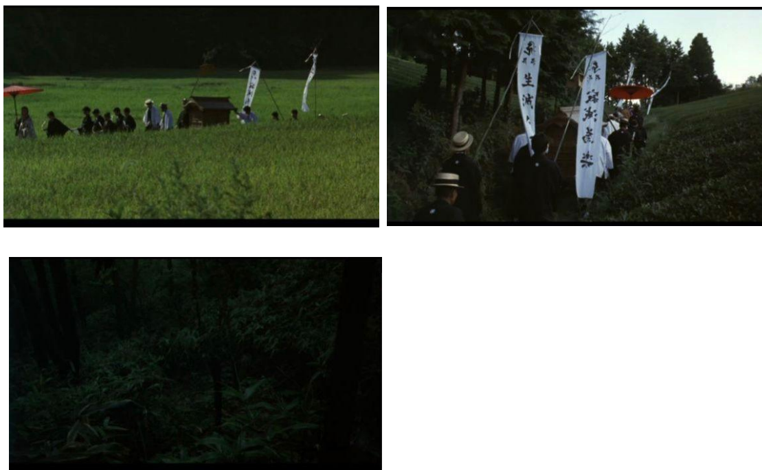
Figura 10 – Fotogramas do funeral de Mako

Fonte: Floresta dos Lamentos ( Mogari No Mori , 2007)