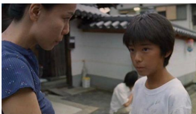
Figura 25 – Momento no qual Reiko pergunta a Shun onde Kei está

Sobre o terceiro dos elementos de mise-en-scène , frequentemente, quando as atuações das personagens de Naomi Kawase são citadas em textos de análise, fala-se muito sobre as atuações realistas, ou seja, que se espelham em uma certa espontaneidade e naturalidade com que as pessoas no mundo real reagem no dia a dia. Porém essa questão de ser realista é muito relativa tanto à época em que foi criada como ao contexto cultural. Atuações que no século passado que eram vistas como muito realistas, hoje em dia são julgadas por espectadores como forçadas e muito “teatrais”. Assim, o que se pode dizer sobre as encenações das personagens de Kawase é que o foco está em trabalhar muito mais as microexpressões faciais e os gestos de forma sutil das personagens para expressar seus problemas internos ou então suas vontades do que trabalhar uma atuação muito expressiva e que use da fala como forma de expor esses problemas e vontades. Na verdade, as personagens de Naomi Kawase exploram muito mais uma linguagem não verbal do que a verbal. Um exemplo disso é no prólogo do filme, o momento no qual Reiko pergunta a Shun onde está seu irmão. Shun não fala onde ele sumiu nem o que aconteceu. Na maior parte do tempo ele apenas olha para a direção onde Kei estava correndo antes de virar em uma viela e sumir, enquanto suas expressões faciais de forma sutil exibem tristeza e sofrimento.