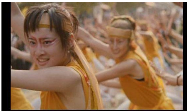
Figura 23 – Momento de descontração e dança no festival de Basara