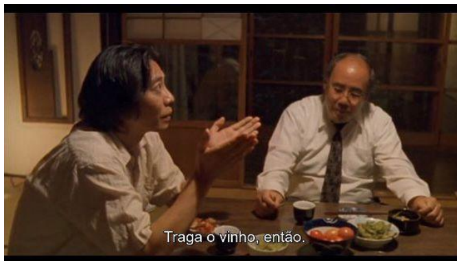
Figura 20 – Exemplo de situação que reforça a caracterização da personagem

Em relação a Taku, por exemplo, o fato de ele ser a pessoa que recebe as visitas na sala e senta com elas à mesa de jantar para fazer refeições, diz sobre sua autoridade na casa, reforçando também a sua caracterização.