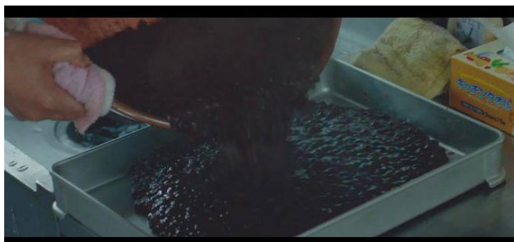
Figura 36 – Momento em que a pasta de feijão pronta cai no tabuleiro

O som direto também tem participação nessa experiência. Por exemplo os sons do borbulhado da água fervente junto com o feijão que é cozido, o som do feijão caindo na panela, o som da tampa de madeira fechando e abrindo a panela que coze os grãos, o som da água suja caindo da vasilha cheia de feijão cozido e o som da pasta pronta caindo no tabuleiro estimulam tanto quanto o enquadramento e contraste os sentidos dos espectadores.