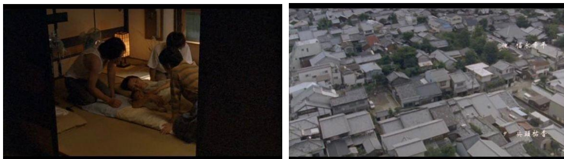
Figura 27 – Fotogramas mostrando o momento inicial e momento final da cena

Sobre a questão da distância focal, no filme foram usadas com mais frequência as lentes de média distância, retratando a rotina da família Aso e o uso das teleobjetivas, que trazem mais dramaticidade e enfatizam a intensidade dos sentimentos das personagens. Porém, uma cena que chama atenção é a cena final, do parto de Reiko, em que, a princípio, a câmera capta o parto usando uma lente de média distância. Assim que o bebê nasce e é colocado nos braços da mãe, em plano-sequência, a câmera sai da casa dos Aso, passa pelo pátio onde Kei e Shun brincavam antes do sumiço e sai por uma porta que fica nos fundos da propriedade. Nesse momento o plano acaba e um novo começa. Usando a lente grande angular, a câmera capta em sobrevoo as casas e as ruas do bairro tradicional de Nara onde vivem as personagens do filme. Pelo tempo de duração do plano e pela opção por essas duas lentes, o conjunto traz uma reflexão sobre esse recorte espaço-temporal bem demarcado frequentemente presente no cinema de fluxo e que se revela com frequência no cinema de Naomi Kawase: a câmera sai de um momento extremamente íntimo da família e vai se afastando ao ponto de sobrevoar o bairro, sugerindo as várias outras micro realidades que ali existem, mas que a cineasta escolhe apenas uma delas para abordar.