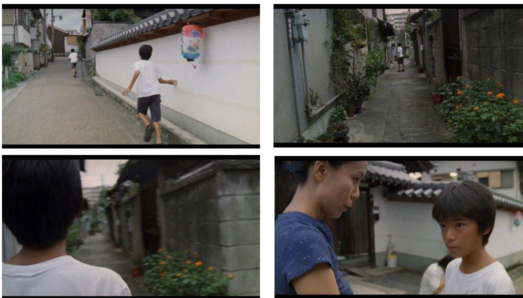
Figura 4 – Fotogramas do momento em que Shun e Kei correm pelas ruas do bairro até Kei sumir.

Shun, Reiko e Taku são os três componentes da família Aso e protagonistas do filme Shara . Logo no prólogo são apresentados Shun e Kei (os gêmeos filhos de Reiko e Taku) brincando em um pátio. Momentos depois, Kei decide correr para fora do pátio e seguir em meio as ruas estreitas do bairro tradicional de Nara. Shun acompanha-o na corrida. Em um determinado momento, em que Kei está um pouco mais afastado, Shun avista Kei entrar em uma viela e em seguida perde-o de vista. Quando Shun chega na rua estreita não encontra mais seu irmão. Ainda no mesmo plano (a corrida toda em plano-sequência) Reiko pergunta a Shun onde seu irmão está. Shun apenas responde “Ele se foi.” 4 . Nesse momento o plano acaba e um corte se segue, levando a história a se passar alguns anos depois do acontecimento.