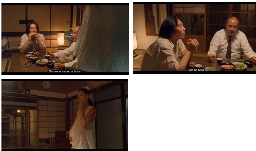
Figura 5 – Fotogramas do momento de fechamento do primeiro ato em Shara

A família segue vivendo com seus ressentimentos causados pelo sumiço do gêmeo Kei. Essa postura se mantém passiva até que um oficial de polícia aparece na casa da família Aso em uma manhã e dá a notícia que eles acharam o corpo do garoto. Ao anoitecer Reiko entra na sala da casa, onde Taku está fazendo uma refeição com um homem (fica sugerido que esse homem é um oficial de polícia), e afirma “Vamos encarar os fatos. Está na hora” (tradução nossa). Essa é a cena de fechamento do primeiro ato da narrativa.