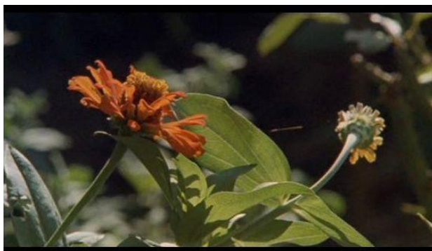
Figura 28 – Plano detalhe de planta com um fio de teia de aranha preso a ela

Sobre o terceiro elemento estilístico proposto por Bordwell e Thompson (2013), o som, em Shara , percebe-se que os sons de ambiência têm várias funções importantes. Uma delas é ajudar o espectador a entender melhor onde exatamente a personagem está, dentro do bairro (ajuda a se localizar espacialmente no bairro). Por exemplo, um som que aparece sucessivas vezes no filme e que indica que as personagens estão chegando perto da casa da família Aso é o som do sino que toca dentro do centro budista. Ele está presente logo no início do filme, por exemplo, quando Shun chega em casa (depois da escola) e deixa sua bicicleta na entrada da residência. Outra dessas funções dos sons de ambiência pode ser de ajudar em uma maior imersão do espectador no mundo do personagem, fazendo-o ter uma experiência sensorial de forma parecida com a que a personagem está tendo em cena (já que obviamente o espectador não é literalmente transportado para aquele ambiente que a personagem vive e sim seus sentidos são estimulados através de imagens e sons para assim surgir a experiência sensória). Um exemplo dessa outra função é o momento no qual Reiko está no jardim cuidando das plantas. Além dos planos que mostram a personagem fazendo jardinagem, também há planos detalhe mostrando flores, folhas, frutos e até pequenas teias de aranha que se formam entre as folhas. Junto com essas imagens, os sons do ambiente, como de pássaros e cigarras cantando e de galhos quebrando estão em evidência.