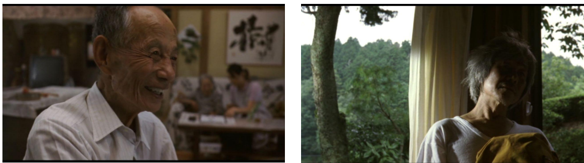
Figura 31 – Fotogramas mostrando planos fechados das expressões de idosos da casa de repouso