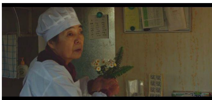
Figura 34 – Fotogramas mostrando o olhar atento e semblante triste de Tokue, enquanto espera os clientes aparecerem na loja

E para finalizar a mise-en-scène , a questão da encenação, a questão do uso das microexpressões faciais e da gesticulação sutil mais uma vez foi verificada na narrativa. Assim como a escolha por cenários japoneses para gravar seus filmes, esse tipo de encenação das personagens de Naomi Kawase também pode ser uma marca que se repete ao longo de sua filmografia. Em Sabor da Vida , uma das cenas que mostra precisamente essa ideia é a do dia que os clientes passam a não ir mais no estabelecimento por que o boato se espalhou. Nessa manhã, Tokue e Sentaro acabam percebendo o motivo da ausência de clientes sem que isso seja dito em diálogo. O espectador entende que eles já sabem do boato justamente por causa das expressões faciais que vão passando cada vez mais decepção, através do olhar atento para a janela esperando os clientes chegarem e o semblante triste. Após um tempo nessa espera, Sentaro decide dar o resto do dia de folga para a idosa, confirmando assim que os clientes não irão aparecer.