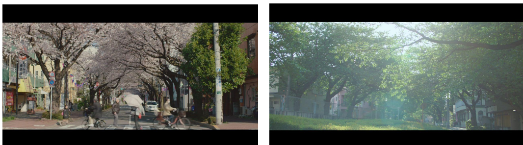
Figura 18 – Fotogramas mostrando a passagem de tempo na narrativa

Sobre o terceiro filme, Sabor da Vida, o princípio da função foi observado pelo uso das árvores da cidade mostrando passagens de tempo mais significativas. O filme tem alguns planos de cerejeiras cheias de flores, indicando que no mundo ficcional as personagens estão na estação da primavera. A medida que o tempo passa, Tokue é contratada e a pequena loja de dorayaki começa a fazer sucesso com a nova pasta de feijão. Quando o rumor que Tokue tem hanseníase se espalha eles já estão no verão. Quando o rumor passa a afetar muito a quantidade de fregueses que frequenta o estabelecimento, a idosa decide deixar o trabalho. Nesse momento inicia-se o outono e o outono acaba quando a dona da loja de dorayakis começa a implementar mudanças no estabelecimento que modificam a sua dinâmica, como o cardápio de comidas preparadas, os funcionários da loja e também design de interior. Além disso, nessa mesma estação Tokue morre. O inverno não é mostrado e isso acontece para mostrar que houve uma passagem de tempo maior, passagem essa que traz mudanças maiores de vida para Wakana e Sentaro. Quando mostra-se a próxima estação, já é a primavera outra vez, momento em que o chefe abre uma banca de dorayaki na praça e Wakana volta a estudar. Em resumo, os planos das árvores mostrando as estações do ano se localizam entre essas cenas de ação em que a trama se desenvolve, trazendo a ideia de passagem de tempo.