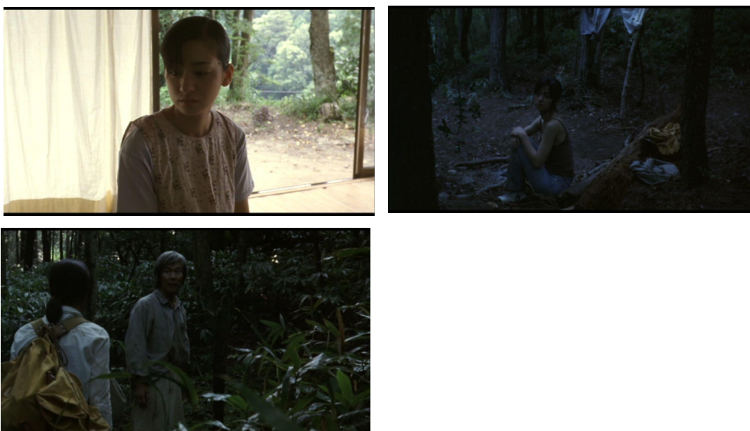
Figura 30 – Fotogramas mostrando diferentes momentos ao longo do filme que usam essa iluminação fraca e sem contraste nas personagens