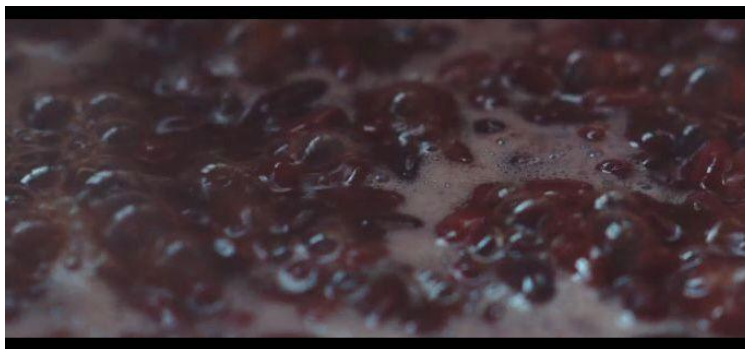
Figura 35 – Enquadramento fechado usado para deixar a comida mais atrativa