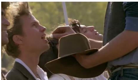
Cena 2- Santa Ceia em Hair

Um homem caminha entre a multidão, e, ao retirar da cartola o LSD, uma fileira de jovens ajoelhados recebe deste a “comunhão”, uma “hóstia” de LSD, que leva Claude a uma viagem alucinante em uma igreja do interior de Oklahoma. Em Jesus Cristo Superstar não temos cenas com alucinógenos pois, os personagens estão diante da consciência expandida personificada, representada na figura de Jesus, o que pode significar que alcançaram a maior expansão de consciência possível, a iluminação. Isto soa um tanto quanto religioso, mas é provável que seja a intenção do diretor, não negar, mas ressignificar a experiência religiosa na qual a comunidade hippie se identifique com a figura de Jesus, sem a doutrinação das instituições religiosas na forma de adorá-lo. O uso de alucinógenos foi um dos instrumentos para explorar outras formas de consciência, para atingir a iluminação espiritual, o lado místico da contracultura. Timothy Leary foi quem propôs o caráter terapêutico e espiritual ao uso da dietilamina do ácido lisérgico.