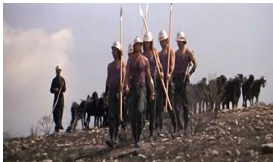
Cena 2 – A guarda do templo.

Ainda no templo em Jerusalém, podemos observar como as imagens, que reconstróem o mercado no pátio interior, são atualizadas. A cena começa com uma câmera em travelling vertical que sobe por detrás dos muros delineando o templo da cidade. Temos assim, um exemplo para a metáfora ontológica da “porta” ao apontar para as artificialidades do filme, construída a partir da vista panorâmica que obtemos do lugar. Ela nos leva de um ponto da história a outro, por meio do plano posterior, quando nos é apresentado o personagem de Pilatos – personagem que também funde roupas de época com a moda contemporânea, como uma capa de cor escarlate, aveludada, e com óculos de sol como acessório.