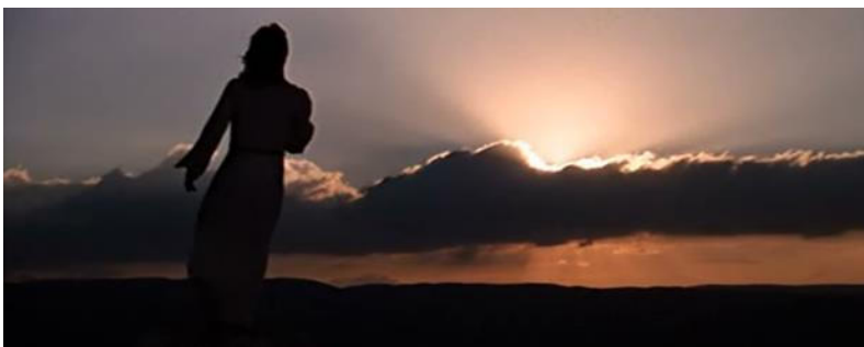
Cena de Jesus Cristo Superstar - Jesus em Getsêmani, no Monte das Oliveiras.

Jesus reconhece que não pode ir contra a vontade de Deus, e concorda em morrer. Ele levanta a pergunta do “ser” e do significado de sua existência, supera seus conflitos, é tocado de maneira última a respeito do mundo, de estar nele, e da alienação em que este se encontra. Judas chega com a guarda do templo, e para mostrar quem é Jesus, beija-o na face.