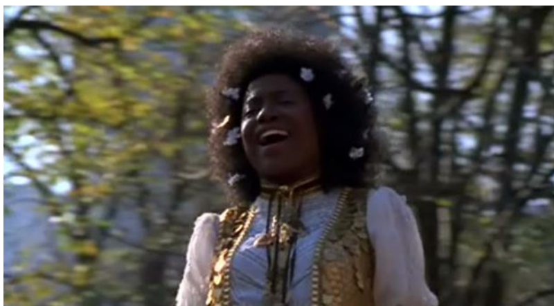
Cena de Hair – A música como elemento diegético no filme.

Entre os três filmes aqui em análise, dois deles são musicais. Neles, a música aparece como um elemento diegético, pois temos a presença dos cantores e cantoras nas cenas. As vozes não são descorporificadas e os sentimentos e ações nas películas são anunciados por um diálogo musical entre os personagens e o público. Assim, o vínculo ontológico entre público e personagens dos filmes não podem ser separados devido às profundas emoções que o corpo sente com a música. Temos um mundo manifesto pelo som de vozes em canções que irão compor as narrativas, e a presença constante da música torna o espectador mais vulnerável às emoções transmitidas pelas vozes e sons. Acredita-se que o som “desempenhe um papel muito mais abrangente de ancorar e estabilizar, real e metaforicamente, o corpo do espectador no espaço” (ELSAESSER, HAGNER, 2018, p. 155). A música como participante da construção cinematográfica se torna um elemento importante ao estabilizar o espectador no espaço à medida que se apresenta como um elemento da experiência cinemática. Ela conduza a quem assiste aos filmes para uma maior percepção daquilo que está vivenciando nas telas, de modo que o espectador deixa de ser um receptor passivo, mas efetivado corporalmente na textura do filme.