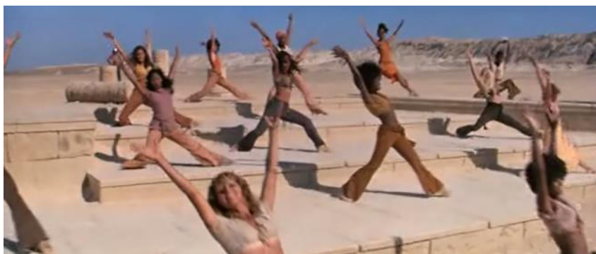
Cena de dança em Jesus Cristo superstar .

forma, o corpo se torna um lugar singular de habitação do sagrado, transformando-se em um símbolo de vida. No cinema, ela vai depender das imagens que são representadas para adicionar sentidos a elas. Na cena abaixo temos a tentativa de Simon, o zelote, de seduzir a Jesus à sua causa.