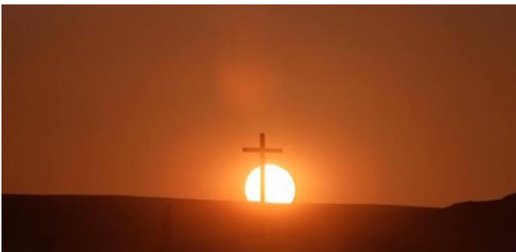
Última cena de Jesus Cristo Superstar .