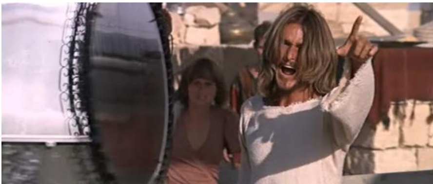
Cena 5 - Jesus expulsa os comerciantes do templo e acusa os sacerdotes de o violarem.

tendo Jesus entrado no pátio do templo, expulsou todos os que ali estavam comprando e vendendo; também tombou as mesas dos cambistas e as cadeiras dos comerciantes de pombas. 13E repreendeu-os: “Está escrito: ‘A minha casa será chamada casa de oração’; vós, ao contrário, estais fazendo dela um covil de salteadores (MATEUS 21: 12,13).