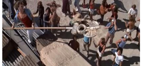
Cena 2 - Os preparativos para a filmagem.