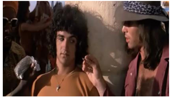
Cenas 1 e 2 Consumidores no mercado do templo em Jerusalém, e a presença de traficantes de drogas.