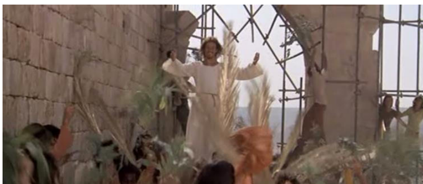
Cena do filme Jesus Cristo Superstar – o povo hebreu recebendo Jesus em Jerusalém.

Em Jerusalém, “Jesus Cristo é o Outro, como Outro, foi a “alteridade absoluta”. Jesus Cristo é um Outro-absoluto, que vem e vai, que se hospeda, sem convite e sem dizer que chega” (MENESES, 2015, p. 31). Jesus veio como hospitalidade absoluta para o povo hebreu.