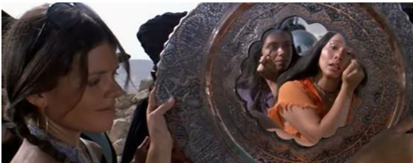
Cena 3 - Os atores se maquiam diante das câmeras.

Hair tem como tema principal “o drama da juventude diante da guerra do Vietnã” (PEREIRA, 1983, p. 76). Há a discussão entre os dois universos em conflito, o do hippie e o do rapaz tradicional do interior, de nome Claude, que se alistou para ser soldado e está prestes a ir para a guerra. Os personagens principais são Berger, Woof, Jeanie, Hud - todos hippies , Claude, um rapaz do interior conhecendo Nova Iorque, e Sheila, a burguesa.