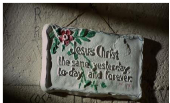
Imagens da cela de uma cadeia em Easy Rider .