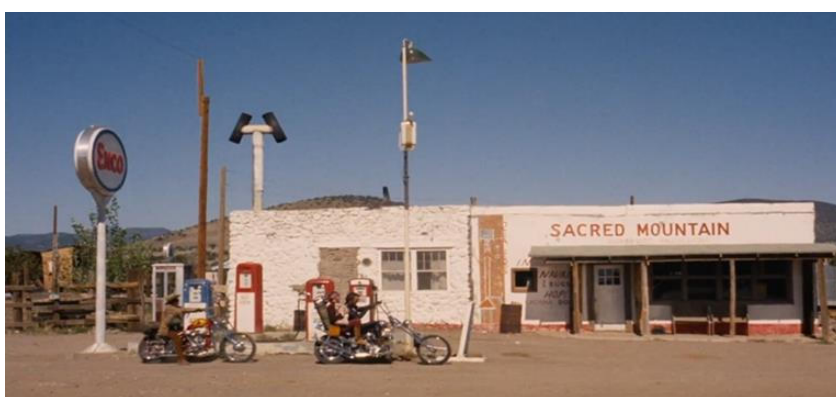
Cena de Easy Rider – A montanha sagrada.

Os deslocamentos da juventude, de casa para as comunidades alternativas formadas em torno dos grandes centros, como ocorreu na Bay Area , em São Francisco, ou para regiões rurais em busca de uma vida livre das amarras do sistema, são representados nos três filmes. Em Easy Rider , podemos dizer que temos dois peregrinos pelo país, e nos deparamos com símbolos que remetem à diferentes tradições religiosas, como o da Montanha Sagrada, nome dado ao posto de gasolina encontrado na estrada em um cenário rodeado por montanhas. Lugares considerados sagrados, são lugares de peregrinação, o que corrobora para a situação dos personagens na película. A partir da vista panorâmica contida nesta cena, encontramos a metáfora da “porta”, um recurso utilizado para nos levar de um ponto da história a outro.