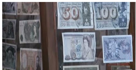
Cenas 3 e 4 – Prostitutas modernas, e a casa de câmbio no templo de Jerusalém.

Em acordo com a narrativa do evangelho de Mateus sobre o comércio no templo, no filme Jesus entra furioso no santuário derrubando cabides de roupas, revirando mesas com produtos que se misturam oriundos de épocas diferentes, como cestos de palha, prateleiras de cartões postais – apreendidos como meio de divulgação do próprio movimento pelo mundo – protestando contra o comércio aprovado pelos chefes da religião. A cena termina com Jesus apontando e acusando os fariseus de corrupção do local sagrado: