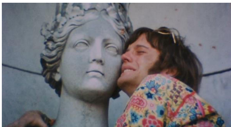
Cena de Easy Rider – Wyatt aos braços de uma imagem feminina.

Segue-se uma sequência forte de cenas; primeiro é posto em destaque o olhar do espectador, quando as lentes da câmera se movem entre os túmulos, em um encadeamento com cortes e edições, que revelará o local visitado, enfatizando alguns símbolos do cristianismo, como imagens de santos, de Jesus crucificado, e capelas. A “viagem” começa, ouve-se a voz de uma garota declamando o credo Católico Apostólico Romano, enfatizando os versos “foi crucificado, morto e sepultado (...)”. Aqui, a instituição religiosa está posta em questionamento ao ser associada à experiência ruim com o LSD. Ouve-se a voz de Wyatt dizendo que está se sentindo muito triste, a pedir para que a voz da moça se cale. As mulheres se despem, a câmera faz movimentos circulares: o sol a pino e os galhos de árvores sem folhas se destacam ao som da voz da garota, que agora aparece com uma bíblia nas mãos, o que intensifica a situação, rezando a Ave Maria, enquanto Wyatt, desesperado, se joga chorando aos braços de uma imagem feminina. Temos aqui uma alusão à escultura Pietà , esculpida pelo renascentista Michelangelo. Produzida em mármore, ela representa a cena bíblica em que Maria, mãe de Jesus, o segura em seus braços, após sua crucificação. É a representação simbólica da piedade religiosa ressignificada na imagem de Wyatt que encara sentimentos de profunda depressão.