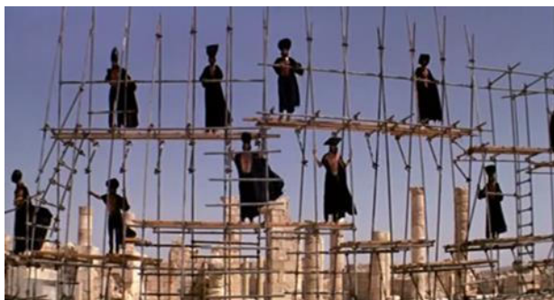
Cena 1 – O templo em Jerusalém.