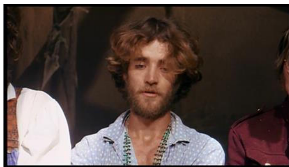
Cena 3- Santa Ceia em Easy Rider.