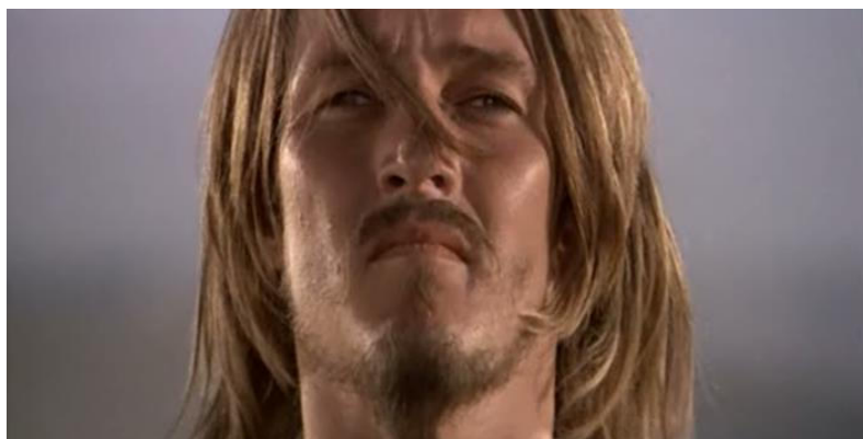
Close up do rosto de Jesus em Jesus Cristo Superstar .

O cinema também pode ser visto como “espelho”, uma imagem que reflete nosso “eu”, e que destaca seu potencial reflexivo. O cinema dos anos de 1960 e 1970 serviram como espelho para uma geração, “transformando em alegoria a própria consciência desconfortável ou estranha que o espectador tem dos personagens como seus representantes ou duplos, egos ideais ou alteregos temidos” (ELSAESSER, HAGNER, 2018 p. 73). O espelho alude ao “eu” espontaneamente no que se vê, e se alinha com o close-up do rosto ao enfatizar o clímax dramático entre dois personagens que se fará presente como um diálogo de expressões faciais. O close-up é um artifício dos cineastas para mostrar o olhar fixo para o mundo fora da tela, ou seja, o ato de assistir já não é exclusividade nossa.