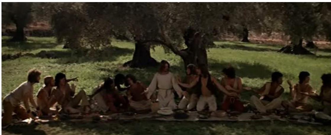
Cena1 - Ressignificação da Santa ceia em Jesus Cristo Superstar .

Em Easy Rider , após uma carona dada a um hippie , os protagonistas do filme chegam a uma comunidade alternativa. A cena que melhor representa a espiritualidade na organização desta comunidade é a da hora do jantar, uma ressignificação, novamente, da última ceia de Jesus, quando o grupo está em torno de uma grande mesa, onde a figura central da cena é um hippie com características físicas das pinturas de um Jesus europeu, com cabelos loiros, barba e olhos azuis. É uma cena de grande profundidade religiosa, onde o “aspecto religioso volta-se para os elementos supremos, infinitos e incondicionados da vida espiritual” (TILLICH, 2009, p. 44). Ele faz a tradicional prece de agradecimento pela refeição, enquanto a câmera gira em torno dos presentes, finalizando a cena com um “Amém” coletivo. A cena caracteriza-se em um rito religioso, e busca um mito fundante para aquela comunidade, uma coesão social em detrimento ao modo de vida fora dela. Aqui ocorre um reordenamento da realidade cujas visões já sedimentadas sobre o mundo e as religiões contidas neles fiquem de fora. Desta forma, temos o rito como função social de trazer ordem e coesão, suspendendo a individualização do ser humano para o ordenamento coletivo em busca de sentido. Assim ocorre a sacralização simbólica daquela comunidade representada, fundada em experiências e práticas sociais: