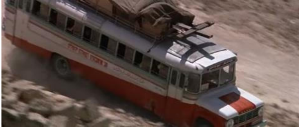
Cena 1- A chegada do ônibus com os atores do filme.

sonoro, com a incorporação de vários instrumentos, se trocam, maquiam e incorporam os personagens a serem vividos. Tudo ocorre diante das câmeras, um registro da proposta ficcional para a narrativa religiosa no filme.