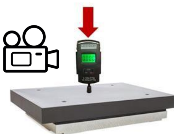
Figura 3 - Teste de pressão