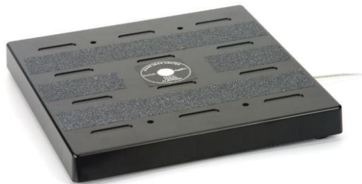
Figura 1 - Plataforma de força

Para a obtenção de dados de força de compressão, a plataforma de força é aceita internacionalmente como padrão-ouro (O'CONNOR; BAWEJA; GOBLE, 2016; CARLOS-VIVAS et al., 2018). O estudo utilizou a plataforma de força de dois eixos (37 cm × 37 cm; PASCO, Passport PS-2142, Roseville, EUA): eixos Y e Z (eixo Z perpendicular ao solo, responsável pelas medidas de força de compressão), a uma taxa de amostragem de 1.000 Hz, usando cinco vigas de força: 04 vigas de canto para medir a força vertical normal (variação de -1.100 N a +4.400 N), e um quinto feixe para medir a força paralela (variando de -1.100 N a +1.100 N) (Figura 1). Os ensaios registrados foram convertidos em kPa, como 01 \text{ kg/cm}^2 = 98.066 \text{ kPa} . Os dados foram coletados e armazenados através do software PASCO Capstone (Versão 1.13.4, PASCO Scientific, 2019).