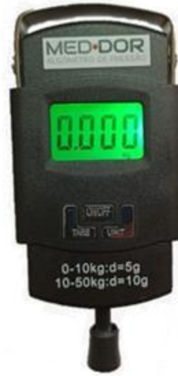
Figura 2 - Algômetro de pressão portátil adaptado de uma balança suspensa

portátil, adaptado de uma balança suspensa (Figura 3). O intervalo entre as pressões executadas foi de 03 s. As leituras coletadas no visor do algômetro de pressão adaptado de baixo custo foram gravadas por uma câmera externa.