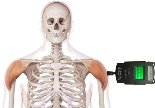
Figura 5 - Coleta do LDP no músculo deltoide