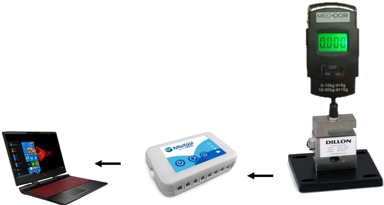
Figura 4 - Equipamentos usados na coleta de dados compressivos de LDP