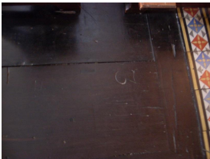
Figura 9) Detalhe de um antigo tumulo da igreja da Ordem Terceira do Carmo de Ouro Preto

Com efeito, o fiel mesmo morto era constantemente lembrado pelos seus familiares e pelos demais irmãos.