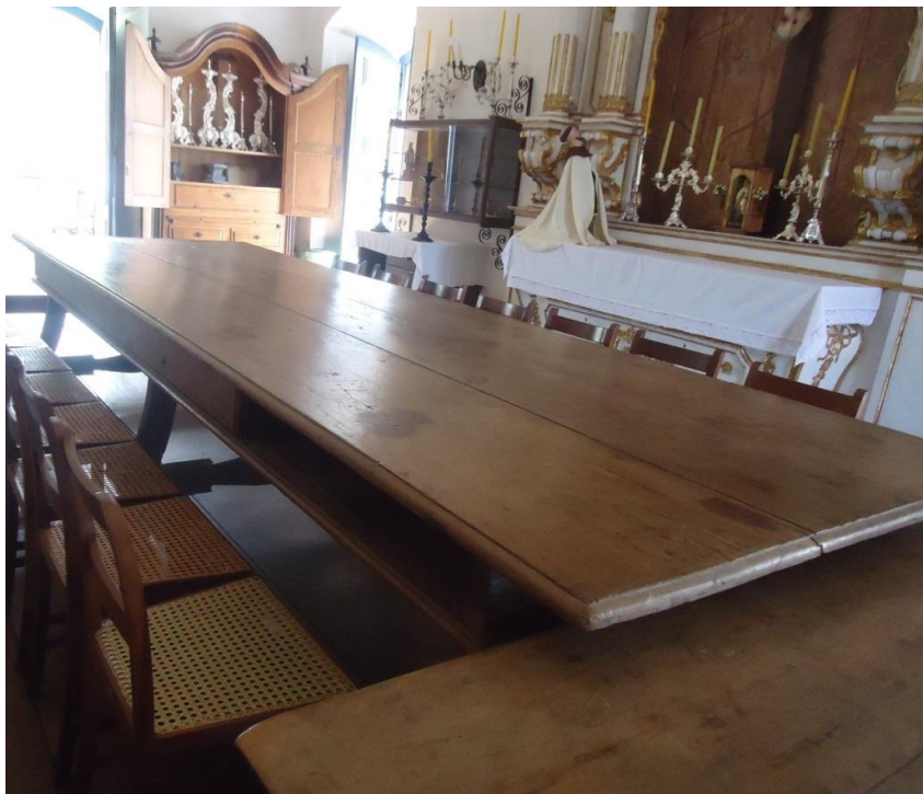
Figura 12) Detalhe da Mesa onde se reúnem, ainda hoje, os irmãos mesários da OTC