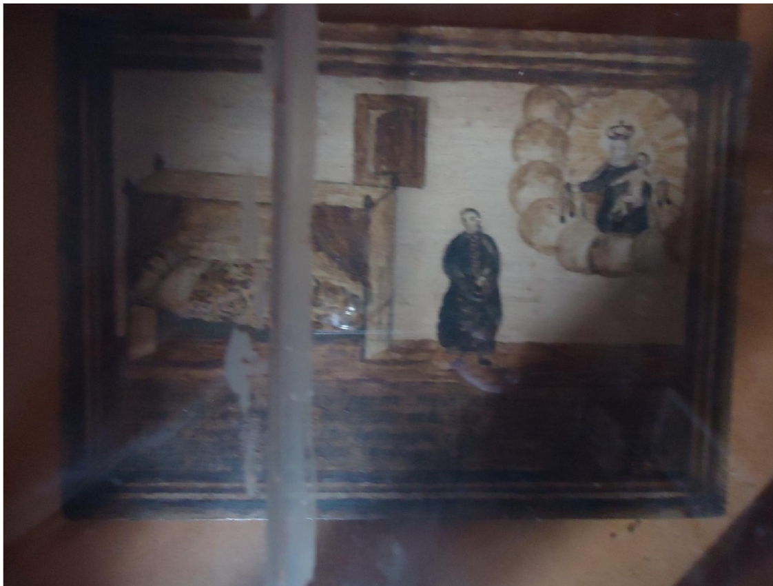
Figura 5) Ex-voto dedicado a Nossa Senhora do Carmo, exposto na sala dos milagres do Santuário do Senhor Bom Jesus Congonhas/MG - Acervo pessoal.

Neste ex-voto, notamos o emprego, que se sobressai, de elementos de caráter devocional, cuja essência é a aparição de Nossa Senhora do Carmo que surge no lado direito da tela “curando” aquele doente. Vemos no lado esquerdo um moribundo em seu leito, porém não sabemos de quem se trata devido à má conservação do quadro, já que o “verbete” onde é contado o ocorrido com o devoto não está legível, dificultando a compreensão do mesmo.