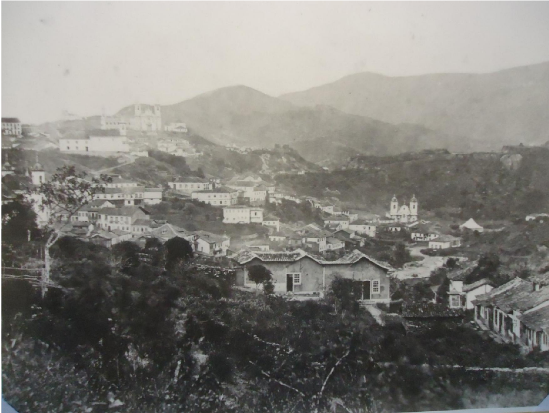
Figura 1) Vista da freguesia de Nossa Senhora do Pilar de Ouro Preto, no alto do morro se encontra a igreja da OTC 597 .