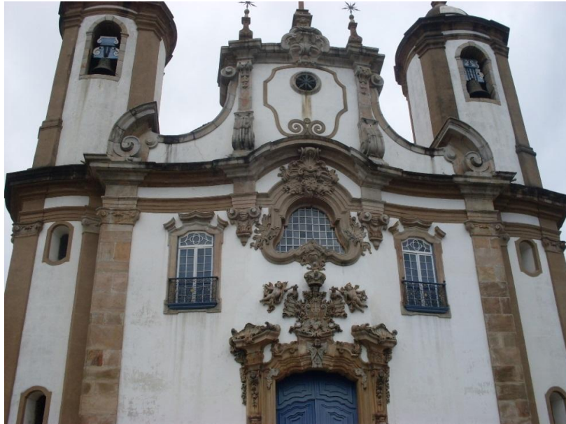
Figura 11) Igreja da Ordem Terceira de Ouro Preto