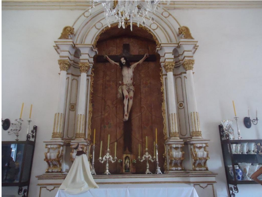
Figura 13) Detalhe do altar da Sala do Consistório, onde são realizadas as reuniões da Mesa Administrativa da OTC