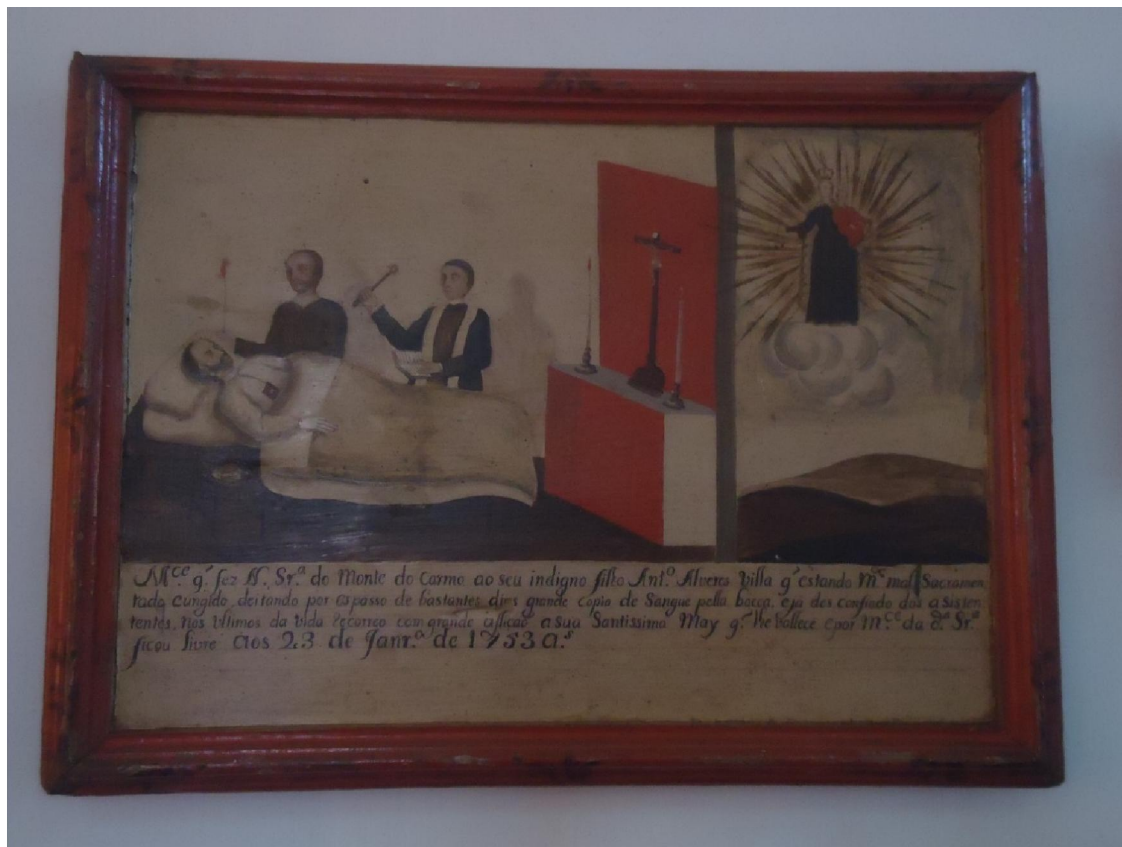
Figura 6) Ex-voto dedicado à Nossa Senhora do Carmo, atualmente exposto no Museu Regional de São João Del Rei- Acervo pessoal.

explicitar uma vocação específica. Nesse sentido, o devoto buscava constantemente sua salvação terrena e momentânea como a cura dos males físicos que se exprimem nos ex-votos.