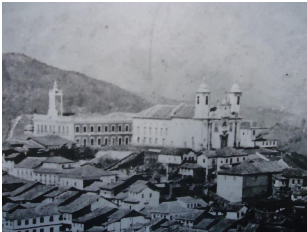
Figura 2) Detalhe da igreja da OTC de Vila Rica. Ao lado, da Câmara e cadeia, século XIX, Museu da Inconfidência 598 .