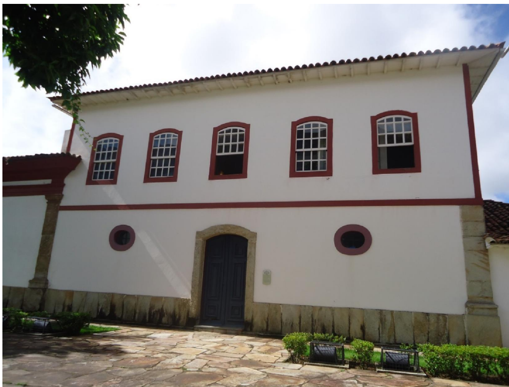
Figura 3) Casa do Noviciado – Ouro Preto. Prédio anexo a igreja da Ordem Terceira do Carmo -Acervo pessoal.

Nos dias previstos para a formação dos noviços, estes deviam se dirigir para a capela da Ordem, ou para a casa do Noviciado, reservada aos exercícios espirituais dos novos irmãos 232 . As exigências eram muitas aos noviços, pois estava estipulada a presença dos neófitos da Ordem todos os sábados, de madrugada, a fim de receberem as instruções sobre a regra e para realizarem os seus exercícios oracionais 233 . A seguir, temos a imagem da antiga Casa do noviciado de Vila Rica (hoje atual Ouro Preto), que fica ao lado da igreja da Ordem Terceira do Carmo.