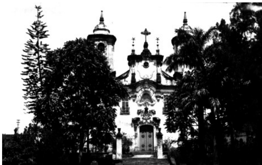
Figura 3) Detalhe da fachada da OTC de Vila Rica 599 .