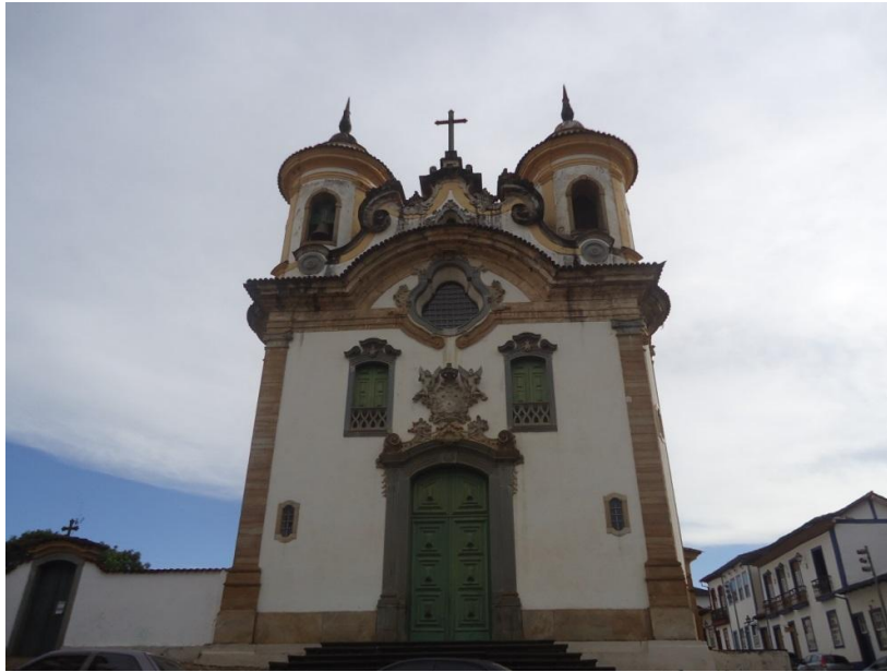
Figura 14) Igreja da Ordem Terceira de Mariana