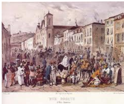
Imagem 2: RUGENDAS Johann Moritz, Rua Direita. Litografia aquarela, 1832 – Museu Castro Maya/IPHAN/MinC. Nesta aquarela de Rugendas, são representadas ao fundo as igrejas e o convento da Ordem Carmelita no Rio de Janeiro. Imagem disponível em: http://museuvirtualpintoresdorio.arteblog.com.br/rua-da-direita-rugendas . (acesso feito em: 14/08/2014)