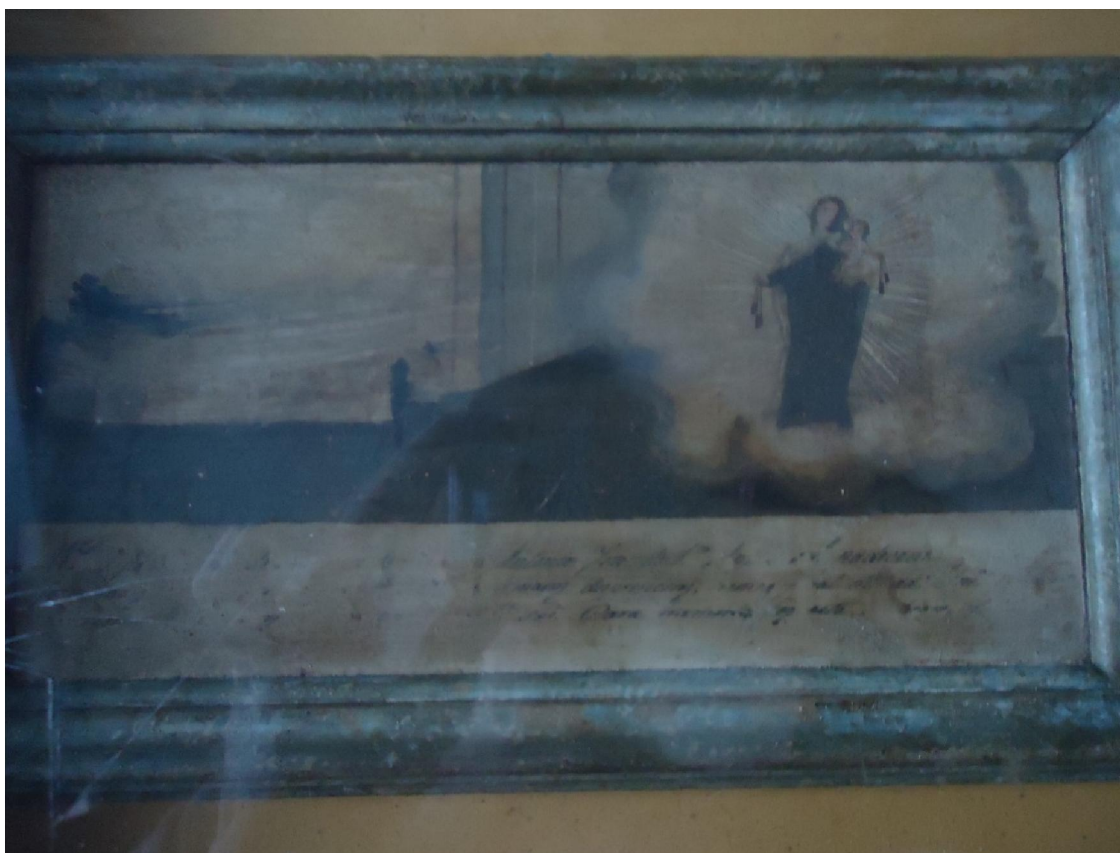
Figura 4) Ex-voto dedicado a Nossa Senhora do Carmo, exposto na sala dos milagres no Santuário do Senhor Bom Jesus em Congonhas/MG – Acervo pessoal.

experiência com o sagrado, que o fiel expõe para que outros vejam 475 e com isso se propague cada vez mais a fé e a devoção àquela entidade religiosa. Essa expressão da fé encontrada nos ex-votos se mostra como um documento dentro do campo da História cultural, sendo que, de acordo com Michel Vovelle 476 , ele revela os aspectos da relação do homem com Deus; a presença do sagrado e do milagre na vida cotidiana, contribuindo para o estudo das atitudes religiosas populares 477 . A religiosidade popular expressa nos ex-votos comprova, de certa forma, uma cultura popular que exprime a relação do homem com o sagrado e do “milagre na vida desses indivíduos, o que contribui aos historiadores, um estudo das práticas populares religiosas” 478 . O ex-voto traduz um testemunho de uma graça recebida e uma demonstração de uma crença religiosa vinculada à presença do sagrado. A seguir veremos alguns exemplos de ex-votos dedicados a Nossa Senhora do Carmo.