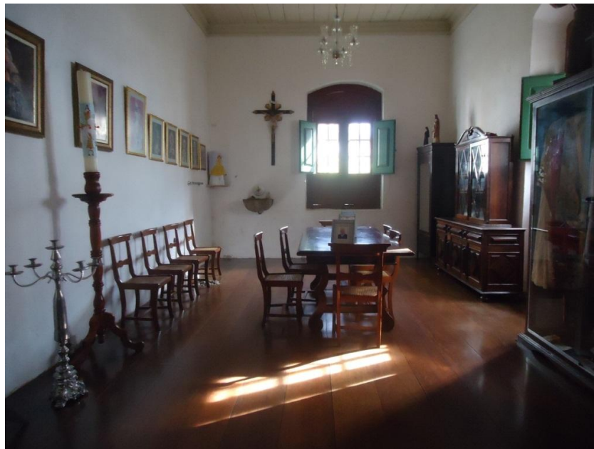
Figura 15) Detalhe da sala de reuniões da Mesa Administrativa OTC