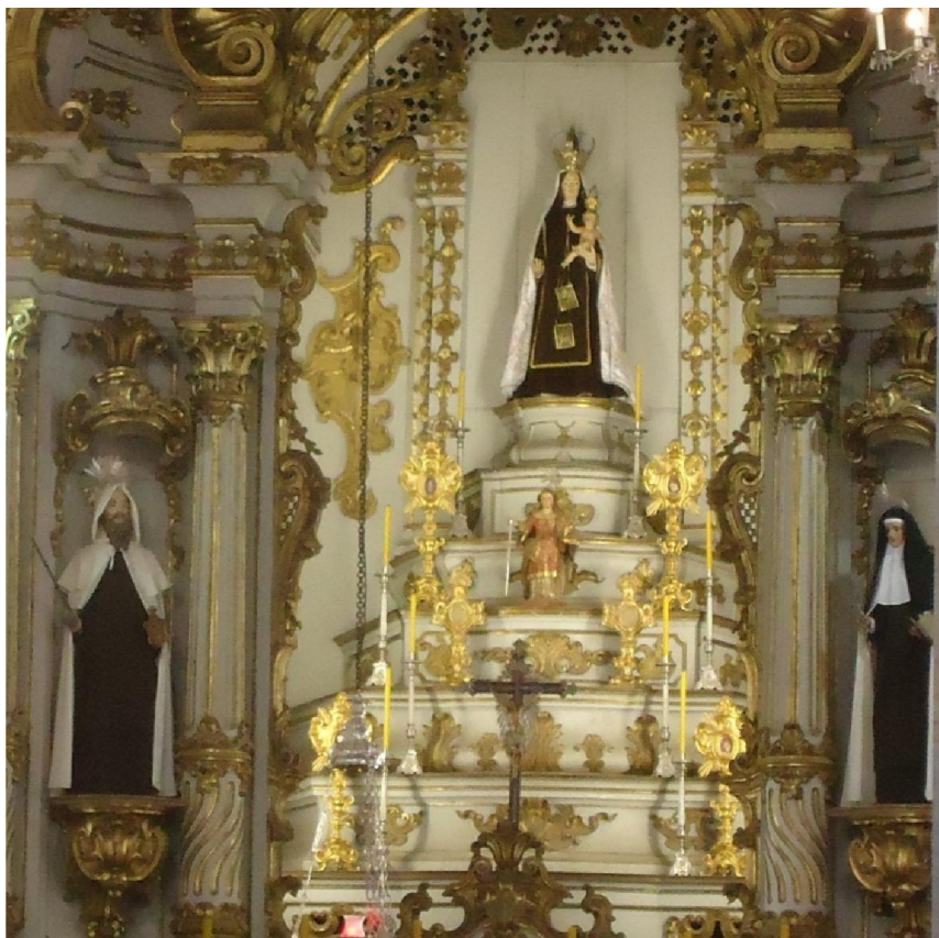
Figura 1) Imagem de Santa Quitéria abaixo da imagem de Nossa Senhora do Carmo – Acervo pessoal.

Os vários documentos nos arquivos sobre a construção dos templos das Ordens Terceiras, seja de Vila Rica, seja de Mariana, demonstram a importância de se ter uma igreja própria pois esta estava vinculada às indulgências que eram concedidas aos irmãos que “santamente visitarem as igrejas do Carmo” 181 .