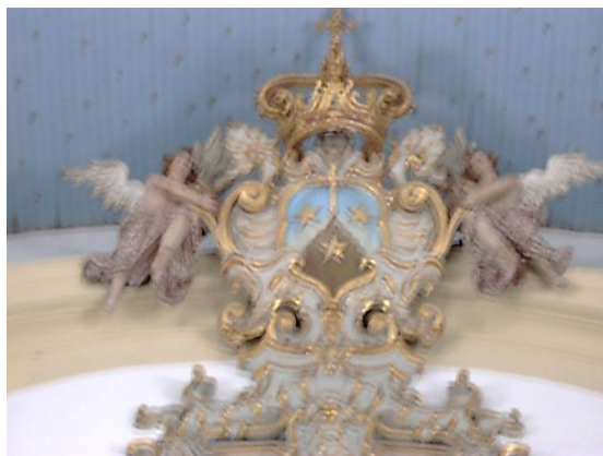
Imagem 1: Brasão da Ordem Terceira do Carmo em Ouro Preto, situado no Arco do Cruzeiro da igreja dos Terceiros desta cidade. No brasão, vemos três estrelas que remetem as figuras dos Profetas: Elias e Eliseu e a Virgem Maria, além da cruz –símbolo cristão em cima de uma montanha (ou Monte Carmelo). Foto tirada em 2013.