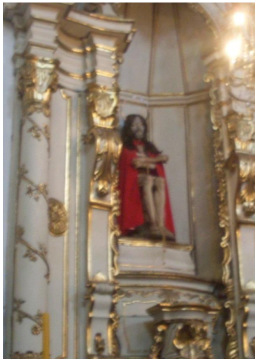
Figura 7) Imagem de um dos altares laterais da igreja da Ordem Terceira do Carmo de Ouro Preto - Ecce Homo – Acervo Pessoal.

As imagens da Paixão foram reconstituídas em muitas vilas da Capitania de Minas Gerais, a exemplo disso são as pequenas capelas da Via Crucis que tinham como propósito a reconstituição do caminho do calvário 552 . Os Estatutos dos Terceiros Carmelitas estabeleciam que seus membros visitassem “todas as sextas feiras da Quaresma, os Passos da Sagrada morte e Paixão de Nosso Senhor Jesus Cristo por ser este Santo exercício muito do agrado de Deus e de sua Mãe Santíssima” 553 .