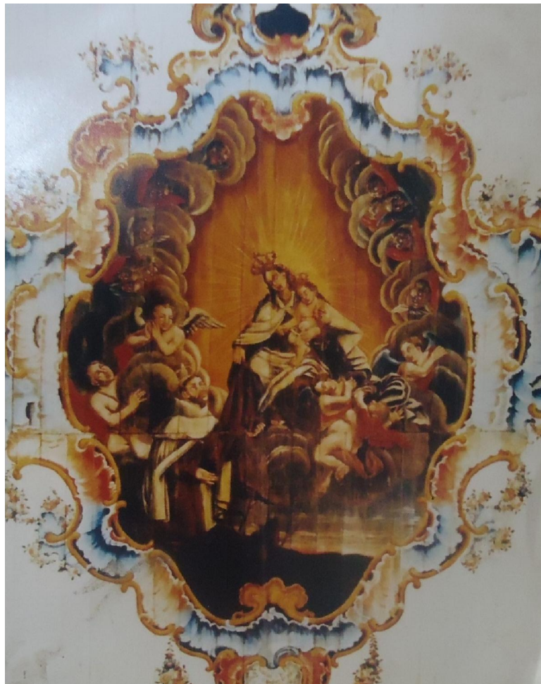
Figura 8) Antiga imagem do teto da nave da igreja da Ordem Terceira do Carmo de Mariana, antes do incêndio ocorrido em 1999 que danificou totalmente a nave desta igreja inclusive a pintura do teto. O que restou foi apenas a capela mor.

A postura que a Igreja adotou foi incentivar o medo da morte, que era visto pela instituição como meio disciplinador, e ao mesmo tempo que proporcionava a confiança de proteção, após a morte, nos ritos tranquilizadores (como enterros dignos e missas de sufrágio), conforme analisou Jean Delumeau 571 . Nessa perspectiva, a Igreja dispunha da imagem de um Deus piedoso e misericordioso para aqueles que se arrependessem de suas culpas e se preparassem com antecedência para a morte, buscando os sacramentos, instituindo legados