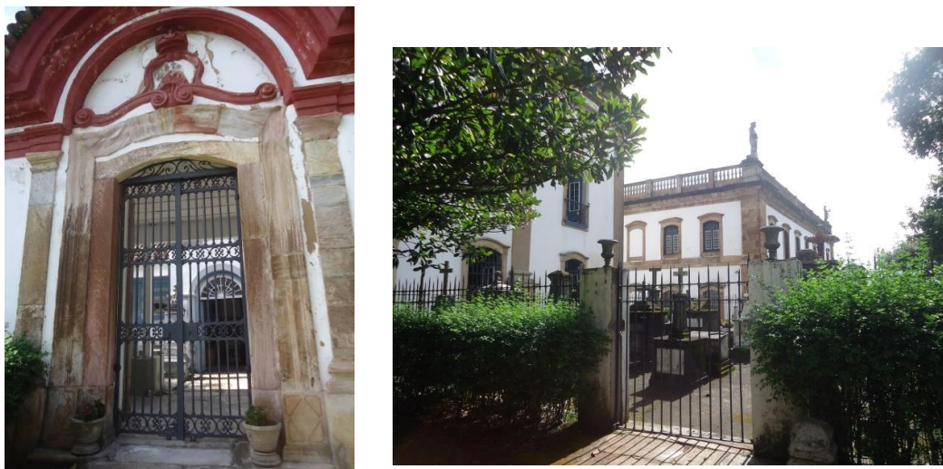
Figura 10) Imagens dos cemitérios da Ordem Terceira do Carmo Ouro Preto