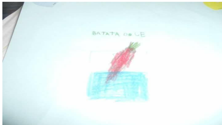
Figura 2: Relatório produzido por um dos alunos