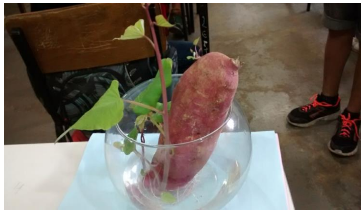
Figura 1: Experiência da batata doce

A partir das atividades desenvolvidas, os alunos apresentaram, como produto final, relatórios sobre a percepção dos mesmos quanto ao processo de formação de plantas, em especial o desenvolvimento da batata doce no meio aquático. Eles puderam observar e construir uma nova concepção acerca do processo de crescimento do elemento analisado, criando uma fundamentação teórica com o auxílio das aulas de Língua Portuguesa. Os recursos tecnológicos permitiram aos alunos aprimorar e aflorar sua criatividade e suas habilidades cognitivas.