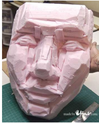
Fig.03 – Após refinar a peça podemos ver que as proporções do rosto já são visíveis.