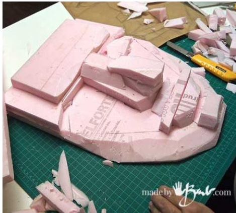
Fig.02 – Aqui a artista cria uma subestrutura de isopor colando e cortando o material.