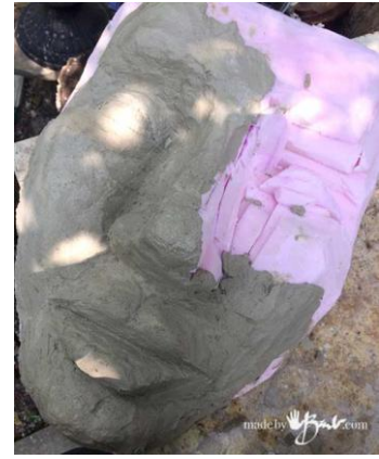
Fig.04 – Processo de cobertura da peça com uma mistura de concreto.