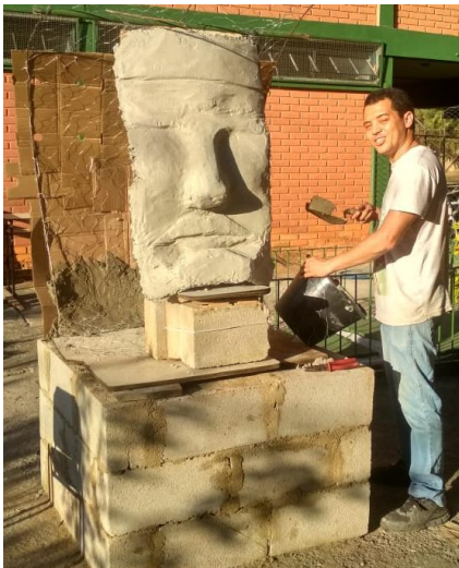
Fig.16 Etapa de cobertura de concreto sobre a subestrutura de suporte, 2019.