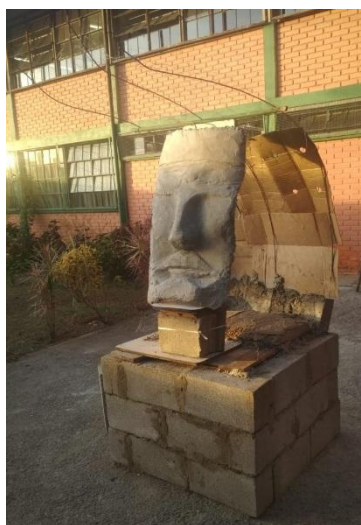
Fig.14 colocação do aramado para a feitura das partes da escultura, 2019