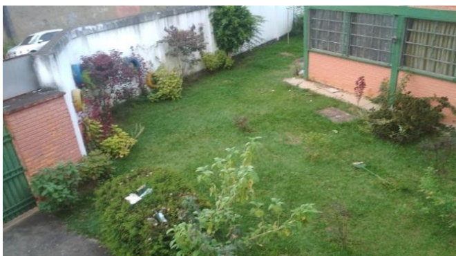
Fig.08 visão do local de implantação da obra.