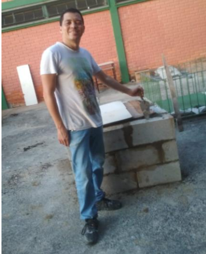
Fig. 13 Preparação da base para a escultura, 2019.