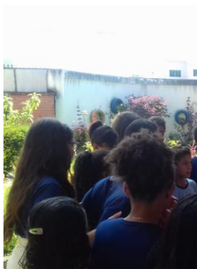
Fig.11 Aula dia 20/05/2019 turmas variadas do fundamental 2.