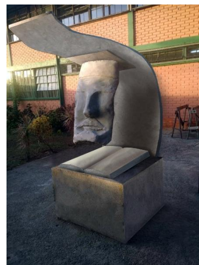
Fig.12 Expectativa da conclusão da forma. Manipulação de imagem, arquivo do professor, 2019.