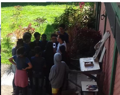
Fig.12 Aula dia 20/05/2019 turmas variadas do fundamental 2.

rosto e apresentação para os alunos, foi dado início a etapa de confecção da base para colocação da escultura, na escola não se encontrou profissional capacitado para a confecção desta em tijolos, diante disso tivemos que confecciona-la fig.13.