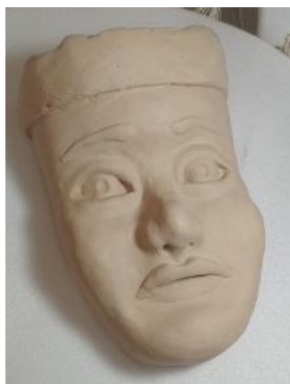
Figs.05 e 06 – à esquerda temos nossa versão de subestrutura escultórica, à direita a mesma coberta "pele" de argila escolar. Fotos de acervo próprio, 2019.

Aqui vemos parte do processo de estudo para se alcançar a forma final, resultados promissores foram obtidos como vemos nas figs. 05 e 06.