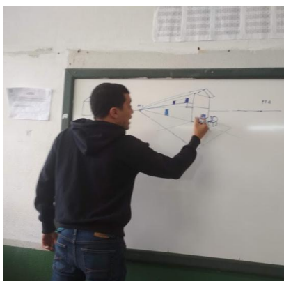
Fig.10 Aula dia 22/05 turma 3º Ano Médio. Foto de arquivo do professor, 2019.

Aproveitamento do tema para tratar de conceitos de perspectiva e desenho associados a implantação da escultura e escolha do local, também foi exposto as turmas todo o texto aqui tratado e os motivos de escolha da forma como também o processo para a criação da forma final. Fig.10.