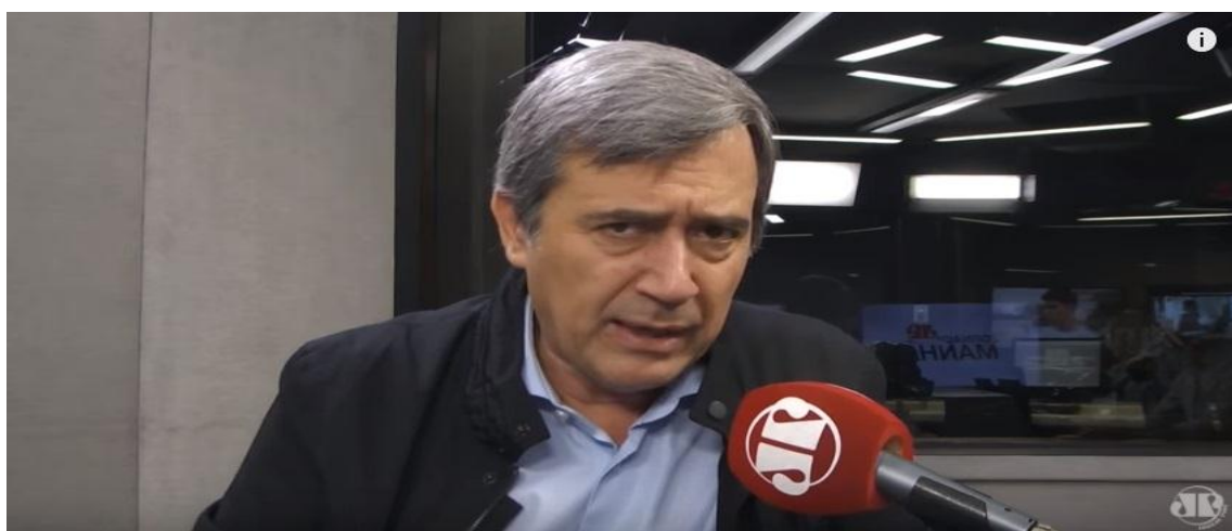
Fig. 5 – O comentarista faz a sua inserção.

Notamos ainda mais importações da linguagem televisiva para o rádio, mas na Internet em outros momentos do “Jornal da Manhã”. É curioso, e importante destacar, que a prática da Jovem Pan de transmitir o jornal pela internet não se resume apenas à implantação de uma câmera em um ponto do estúdio. Na emissora, existe o que em televisão é chamado de corte de câmera. As imagens oscilam de acordo com o assunto que está sendo tratado ou quem está falando em um determinado momento. Da vinheta de abertura, corta para o apresentador, em seguida, pode-se passar para a arte com o WhatsApp oficial da emissora, ou os leitores de notícias, que apresentam as informações no programa de forma manchettata, como prega o célebre “Manual de Radiojornalismo da Jovem Pan”, escrito por Maria Elisa Porchat, em blocos de informação a cada meia hora.