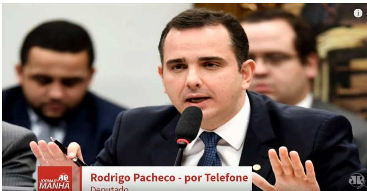
Fig. 13 – Entrevistado ao vivo pelo telefone e representado com a foto para o ouvinte-internauta.

Como todo jornal de rádio, o “Jornal da Manhã” também conta com entrevistas ao vivo feitas via telefone. Nessas situações, em que não há a presença de um entrevistado no estúdio, a emissora usa fotos desses entrevistados, para mostrar a quem assiste, com quem se está falando. Como, percebemos até aqui, a emissora dispensa cuidados ao realizar uma transmissão pela internet que se assemelha ao formato de televisão, num esforço de convergência de meios e tecnologias, é parece claro que se lance mão de mais esse recurso para informar o ouvinte.