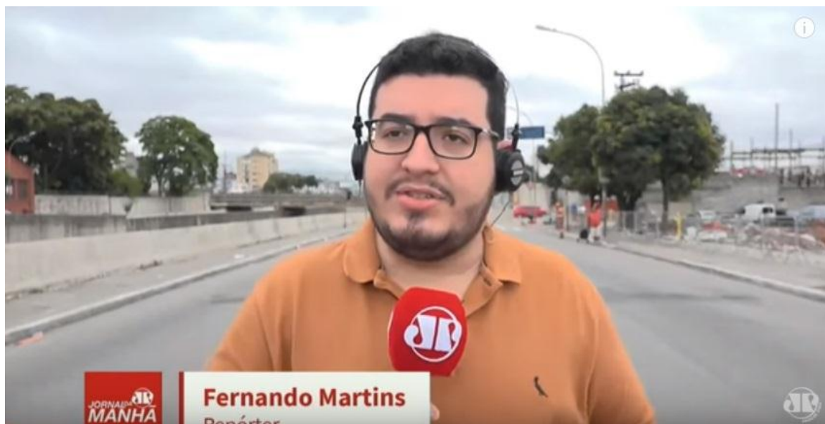
Fig. 9 – Exemplo de entrada ao vivo no “Jornal da Manhã”, com o repórter no local do fato

Nessas entradas, é possível notar também que todos os repórteres são creditados com o nome e a sua função em um gerador de caracteres (GC), em mais um processo de assimilação de outro componente da televisão.