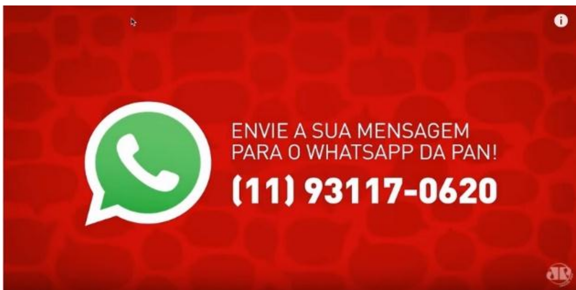
Fig. 2 – Em seguida, a arte com o WhatsApp da emissora

O uso do WhatsApp reforça a participação do ouvinte, uma velha marca da emissora e do rádio, principalmente o rádio AM, como espaço público de reivindicação por melhorias no dia a dia da vida do ouvinte. Com isso, recordamos as ideias de Jenkins sobre Lisa Gitelman, de que os meios de comunicação podem ser vistos sob duas óticas diferentes: sob a ótica da tecnologia e a ótica das relações sociais e culturas que ele gera na sociedade. As tecnologias podem mudar, avançar e tornar diversos dispositivos obsoletos. Mas as necessidades que um veículo gera no indivíduo, uma vez que passam a existir, fazem ele seguir vivo e com procura pelo público, independentemente da plataforma na qual ele esteja inserido. É isso que podemos avaliar aqui. A necessidade de procurar a Jovem Pan, para ajudar a resolver problemas típicos do cotidiano das cidades, continua instalada no ouvinte, mesmo que agora a rádio esteja com uma presença constante na internet. O meio para participar da programação e deixar o seu recado, agora é o WhatsApp.