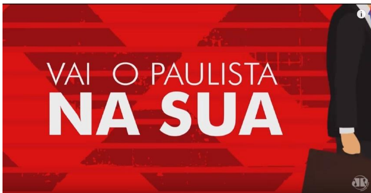
Fig. 4 – Outro trecho da vinheta de abertura do “Jornal da Manhã”.