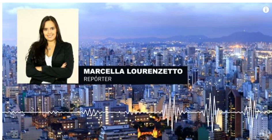
Fig. 12 – Arte com foto da repórter em caso de matéria com apenas áudio.