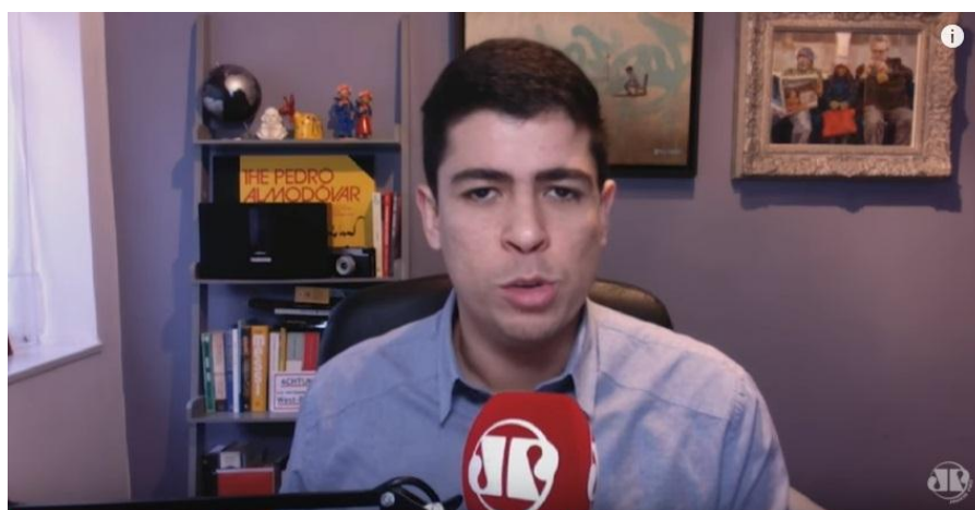
Fig. 8 – Um exemplo de entrada ao vivo de repórter.

Dessa mesma forma, de uma informação poder ser transmitida tanto pelo rádio tradicional, mesmo com o acréscimo de imagem no online, mas sem perda de apreensão de algum conteúdo transmitido, estão as entradas ao vivo dos repórteres, também muito semelhantes a esse tipo de participação feita em telejornais e outros tipos de programa de televisão transmitidos ao vivo.