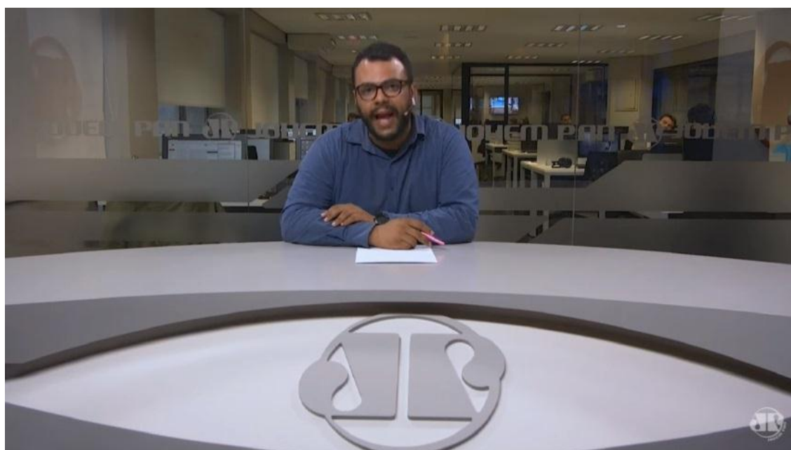
Fig. 10 – Frame do repórter no estúdio de televisão instalado na redação da emissora.

É curioso perceber que a emissora montou um estúdio de televisão para ser usado em suas transmissões pela internet. Mais uma prova de que a emissora está investindo pesado na convergência. Além dos radiojornais e programas exibidos de forma simultânea, a Jovem Pan também exhibe programas e comentários feitos por funcionários do seu quadro, nesse estúdio, destinados ao canal Jovem Pan Notícias no YouTube.