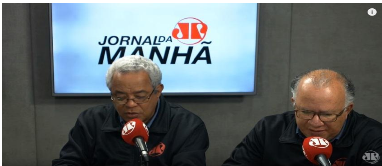
Fig. 6 – Em seguida, a câmera “corta” para os locutores que leem as manchetes do jornal.

Isso aumenta a sensação de se estar assistindo a um programa de televisão, confirmando a ideia de que a internet proporciona a possibilidade de todos os meios se amalgamarem nesse meio e demonstra que a Jovem Pan aposta na convergência para se manter relevante e conquistar público na internet, que necessariamente não é o mesmo que já acompanhava a emissora no rádio tradicional.