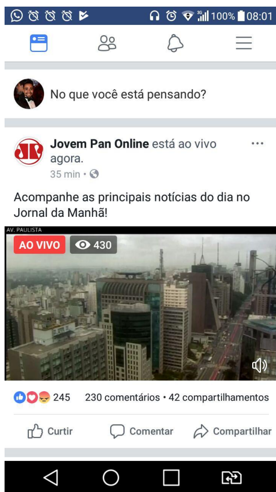
Fig. 14 – A transmissão ao vivo do Jornal da Manhã, como aparece no feed de notícias do Facebook.

Na página da Jovem Pan Notícias no Facebook, também são disponibilizados conteúdos gravados. São trechos de diferentes programas, normalmente comentários, de poucos minutos, que ficam à disposição do visitante. O usuário pode escolher o que quiser assistir, quando bem quiser. Algo que acontece também no YouTube, já que os programas podem ser vistos gravados após a exibição original ao vivo.