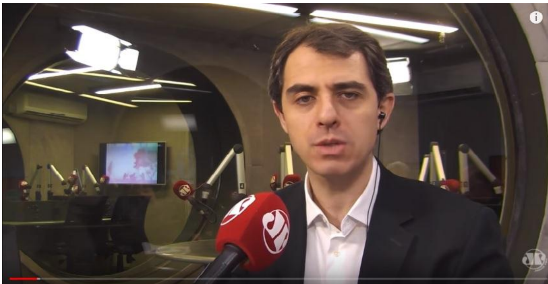
Fig. 1 – O apresentador convoca o ouvinte a interagir através do WhatsApp da rádio.

Ainda na parte visual, todo o jornal é entremeado por essas artes visuais e vinhetas. Um cuidado inédito quando o assunto é rádio na Internet. O recurso de usar as propriedades gráficas para mostrar informações a serem passadas ao ouvinte é amplamente utilizado. O número oficial da emissora no sistema de mensagens WhatsApp serve de exemplo. Os jornalistas que ocupam a posição de apresentador do “Jornal da Manhã”, reiteram que o serviço serve para o ouvinte enviar a sua sugestão, reclamação, pedido... Enfim, o rádio seguindo a cumprir esse antigo papel, mas agora de outras formas. Logo que o locutor cita o WhatsApp, é feito o corte de imagem para a arte, em uma forma muito semelhante à que esse tipo de recurso é usado na TV.