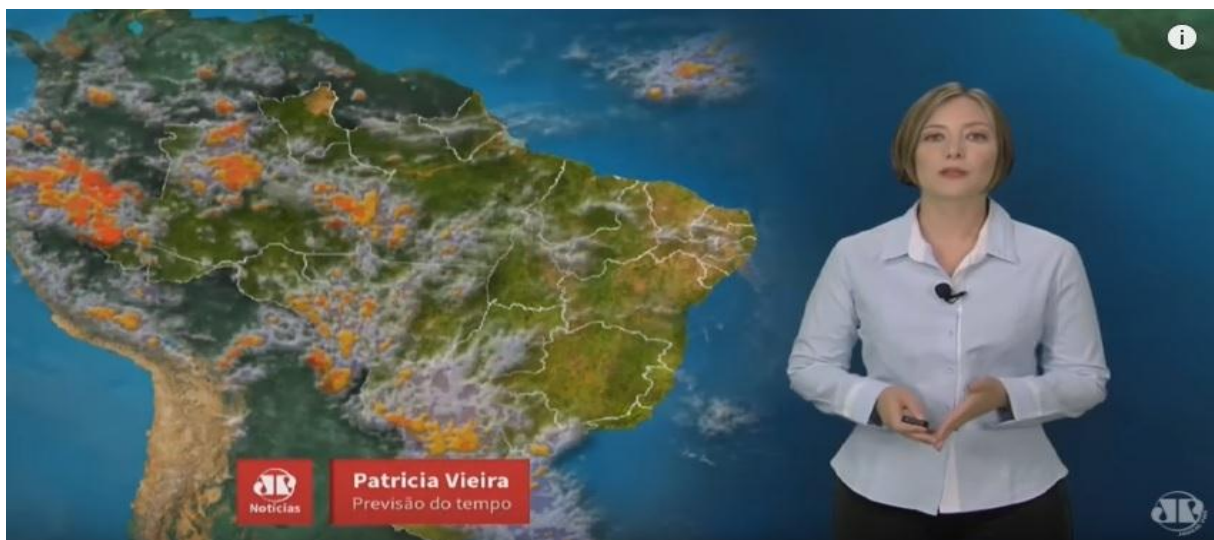
Fig. 7 – A previsão do tempo no “Jornal da Manhã”.

Isso é possível, afinal, a televisão proporcionou a adição da imagem ao som, que antes, já era transmitido pelo rádio. É a teoria de que um meio não “destrói” o outro, mas sim, o complemento, afinal, também absorve formas de informação que já eram transmitidas pelos meios já existentes.