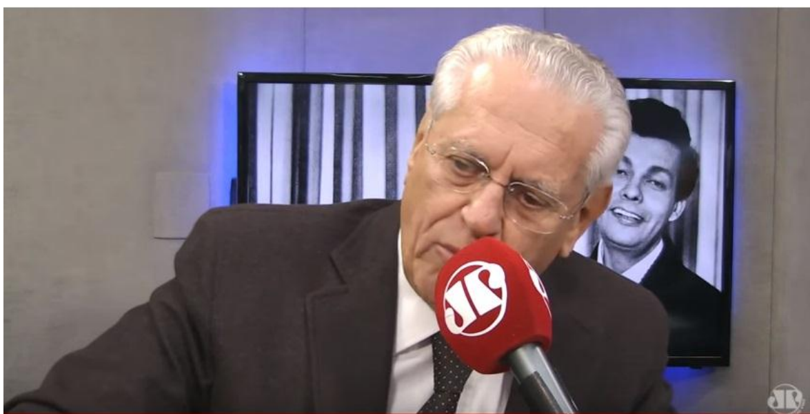
Fig. 11 –Na tela por trás do comentarista, imagem do cantor Cauby Peixoto, quando o assunto é a morte do cantor.

Ainda no campo da computação gráfica, vemos que a Jovem Pan utiliza o recurso de usar uma foto da pessoa que está falando, seja um comentarista ou repórter, inserido em uma arte padronizada, quando a imagem ao vivo ou gravada em vídeo dessa pessoa não está presente. Isso vale para gravações feitas por telefone, por exemplo, ou quando a matéria realizada pelo repórter não é audiovisual, e fica restringida somente ao áudio, o que também é feito em televisão quando o jornalista fala por telefone de um local fora do estúdio.