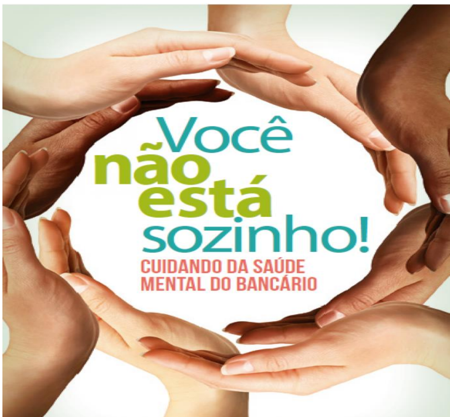
Figura 1: Capa da Campanha “Você não está sozinho”

Outro exemplo que ilustra essa situação, foi uma ação desenvolvida pelo Sindicato dos Bancários de Brasília – DF, que criou e começou a distribuir uma cartilha no início de 2017 entre os bancários, com o seguinte tema: “Você não está sozinho”, propondo uma discussão sobre o adoecimento psíquico da categoria sob suas novas formas de trabalho e gestão. Este projeto marca o dia Mundial em Memória às Vítimas de Acidentes e Doenças do Trabalho, mundialmente lembrado em 28 de abril. Com essa cartilha, os bancários têm acesso às informações sobre o perfil dos adoecimentos e sofrimentos causados como consequência das jornadas de trabalho extenuantes, metas de produção inalcançáveis, riscos de assaltos e sequestros. Além da mensagem de que outras pessoas também podem estar enfrentando os mesmos problemas. Abaixo a ilustração da campanha: