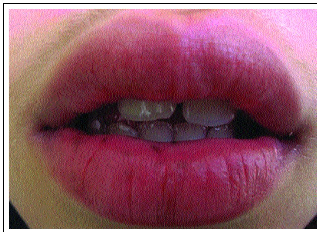
Figura 3: Paciente seis meses após a segunda sessão de laser de Alexandrita 755nm, pulso longo (3ms) / Figure 3: Patient six months after the second application with a long-pulse Alexandrite laser 755nm