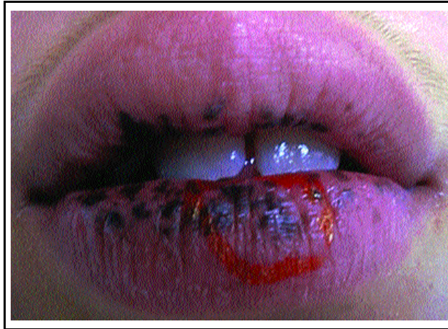
Figure 1: Patient with lentiginosis in oral mucosa

O tratamento com laser mudou as perspectivas estéticas no tratamento dos lentigos labiais.