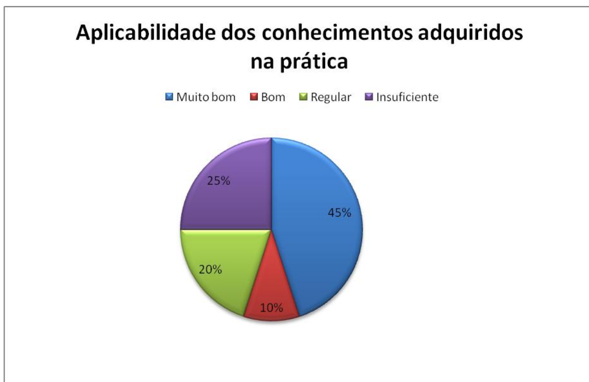
Gráfico 2.2 – Aplicabilidade dos conhecimentos obtidos na formação