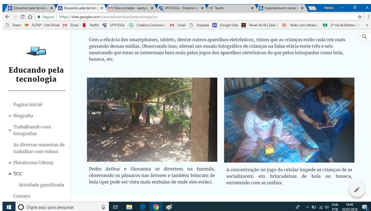
Figura 3: Ensaio Fotográfico no site “Educando pela tecnologia”