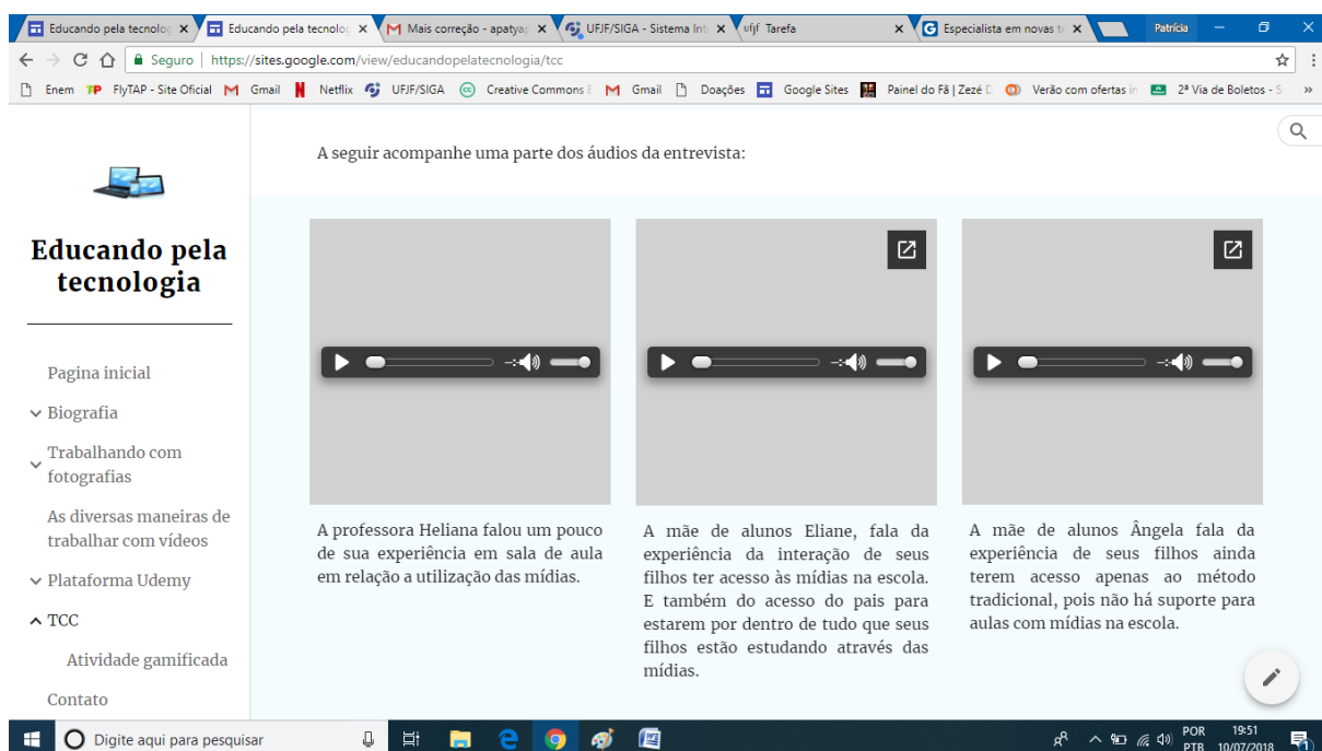
Figura 2: Áudios da reportagem no site “Educando pela tecnologia”.

https://sites.google.com/view/educandopelatecnologia/tcc.