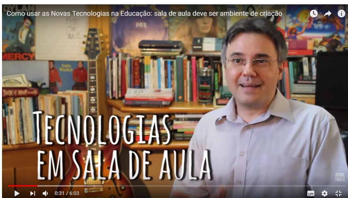
Figura 1: < https://www.youtube.com/watch?v=Zge9v2jhhRA > Acesso em 03 jul 2018

Primeiramente assisti a vídeos no site do Youtube sobre a Escola Quest to Learn , de modo, a saber, como é o ensino nessa escola. A Figura 1 mostra a tela de um dos vídeos que foi assistido que mostra a opinião de um professor em relação ao uso das mídias na sala de aula.