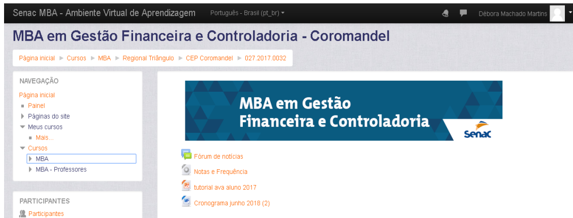
Figura 5: AVA Senac Minas.