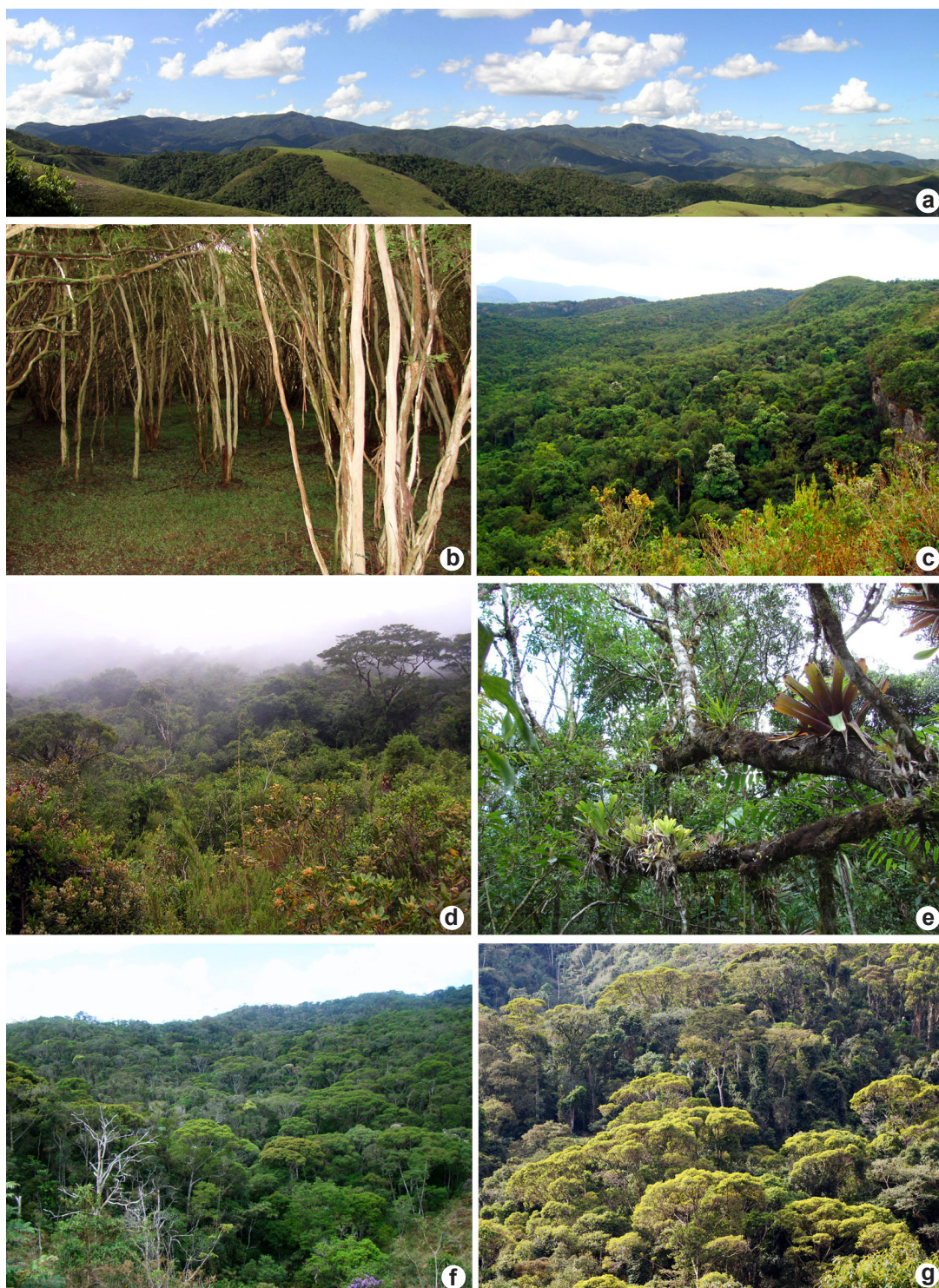
Figura 2 – a-g. tipo de vegetação encontrada na Serra Negra – a. vista panorâmica da face sul da Serra Negra; b. Floresta Ombrófila Densa Aluvial (“Cambuí”); c. Floresta Ombrófila Densa Montana; d-e. Floresta Ombrófila Densa Altomontana (Floresta Nebular), d. vista geral, e. vista do interior, com detalhe de ocorrência de epífitas. f-g. Floresta Estacional Semidecidual. Figure 2 – a-g. vegetation types occurring in Serra Negra – a. panoramic view of southern side of Serra Negra; b. Alluvial Dense Rainforest (“Cambuí”); c. Montane Dense Rainforest; d-e. High Montane Dense Rainforest (Cloud Forest), d. general view, e. interior view, with detail on epiphytic plants. f-g. Seasonal Semideciduous Forest.