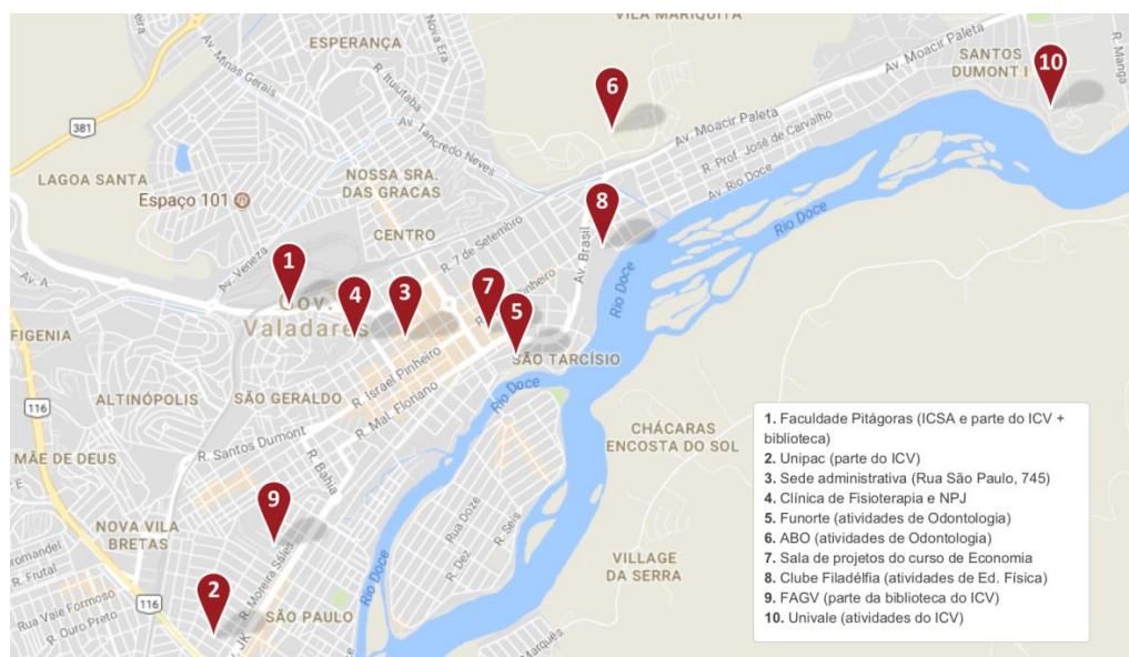
Figura 1 – Mapa dos principais espaços ocupados pela UFJF-GV - março/ 2018