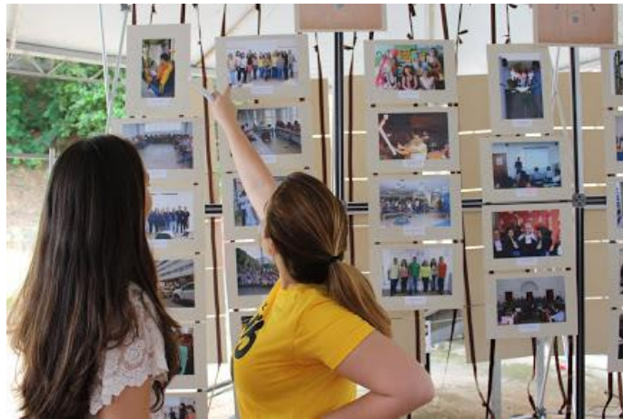
Figura 6 – Foto de Exposição do Projeto História em Movimento em 2017