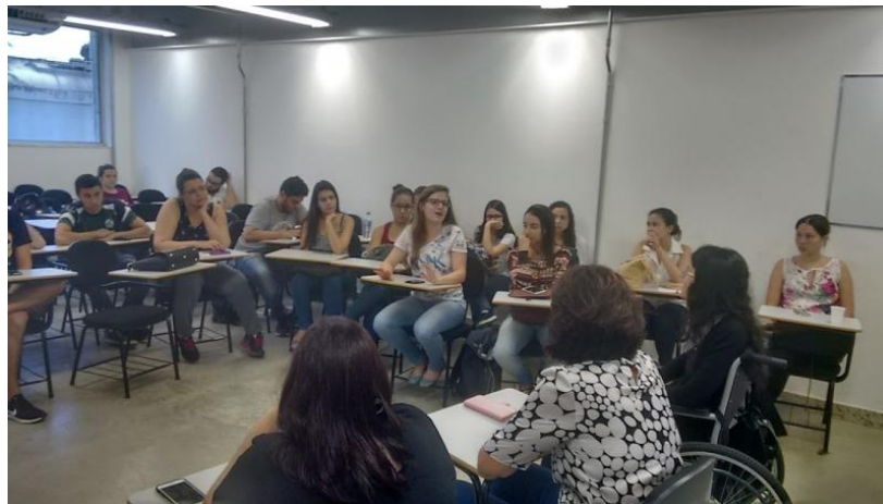
Figura 4 – Foto do Cine Acadêmico com o Departamento de Medicina / Roda de Conversa com Conselho Municipal da Pessoa com Deficiência em 2017

Fonte: Setor Comunicação da UFJF-GV, 2018: