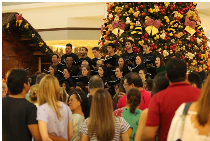
Figura 3– Foto de uma das apresentações do Coral Universitário em 2017