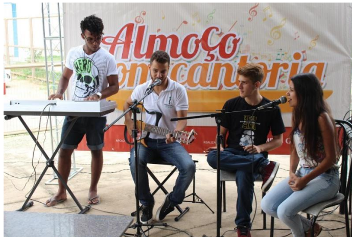
Figura 2 – Foto de um Almoço com Cantoria em 2017