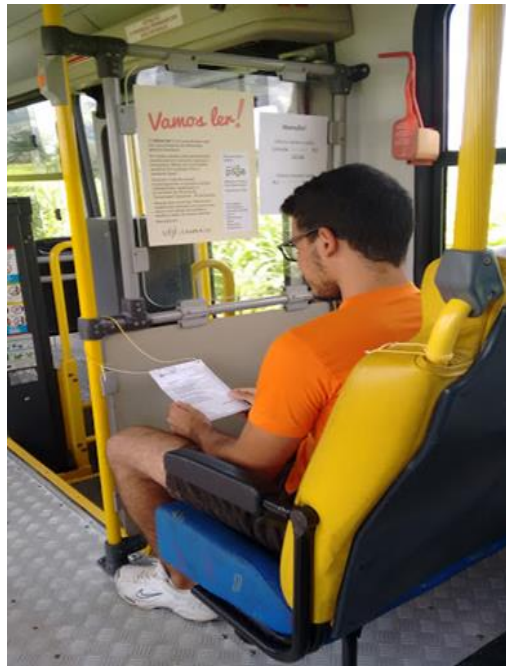
Figura 5 – Foto de lançamento do Projeto Vamos Ler! em 2016