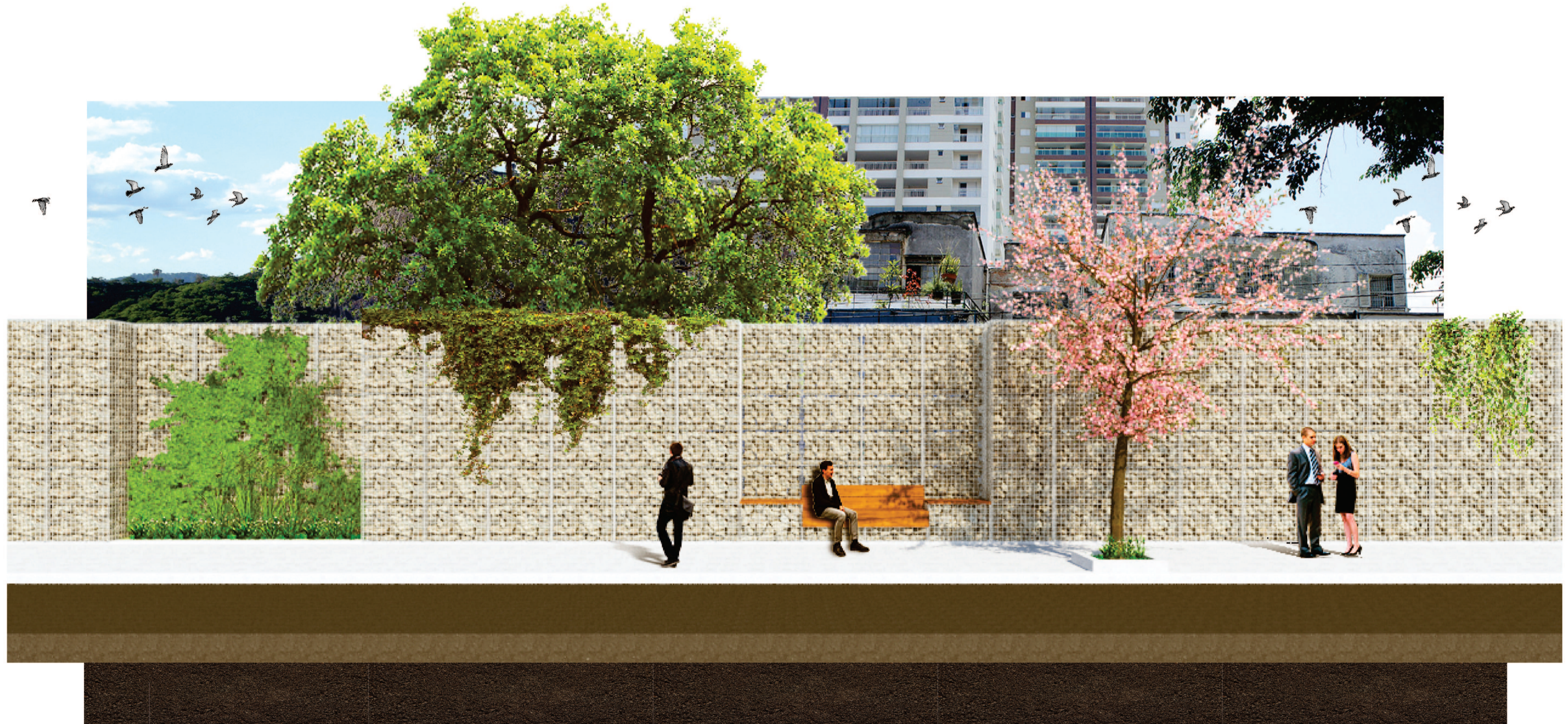
Estudo espacial e volumétrico de impacto na paisagem

"A tradição vernácula da arquitetura integrava o som [...] de forma muito mais harmoniosa, do que a tradição atual: o projeto arquitetônico completava-se pela ação do som no usuário/homem." (ROMERO, 2015 - p. 57)