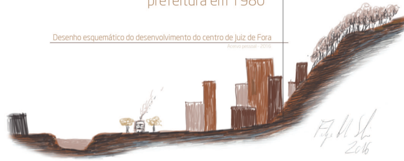
Desenho esquemático do desenvolvimento do centro de Juiz de Fora

Extinção da R.F.F.S.A. Rede Ferroviária Federal S.A.