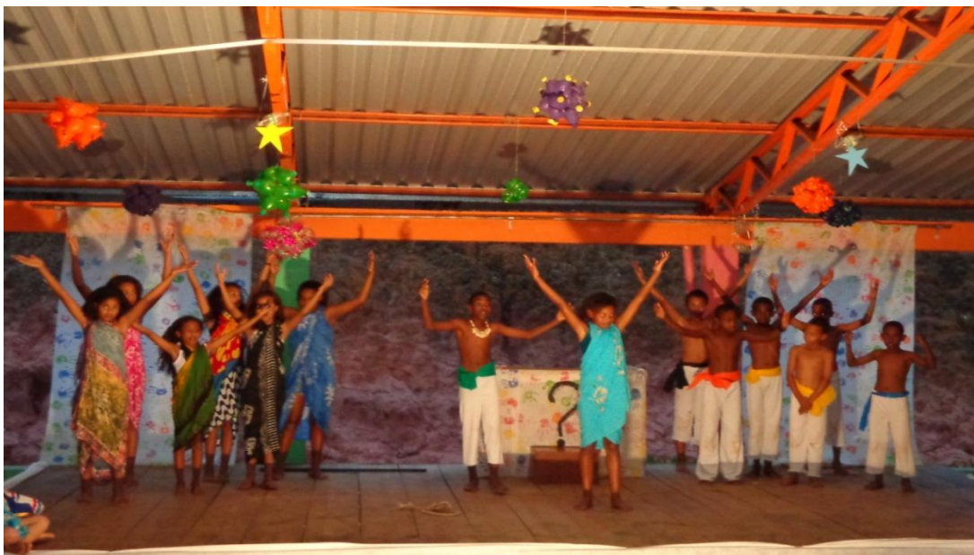
Figura 2 Cena teatro "COR" - 2013