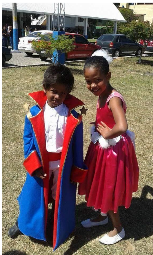
Figura 4 o Pequeno Príncipe e a Rosa (Representatividade)