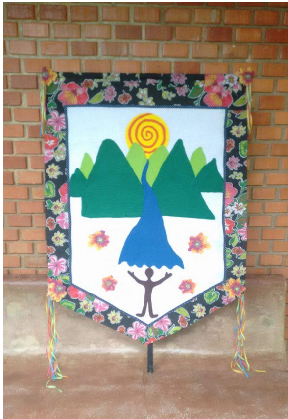
Figura 17 Estandarte Utilizado na Homenagem