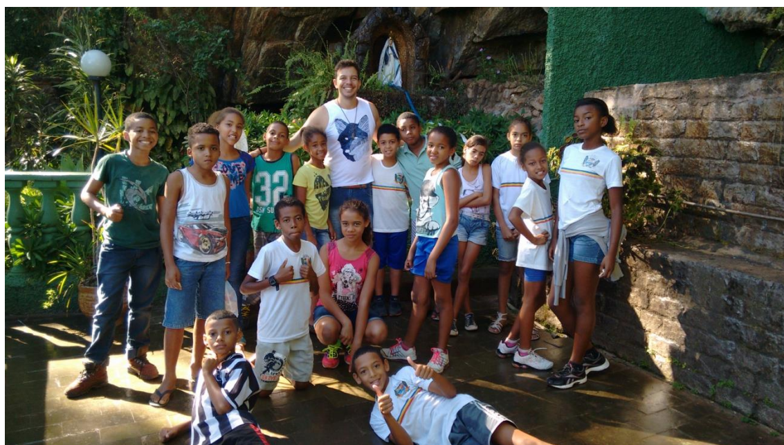
Figura 12 Passeio no Santuário Ecológico da Água Santa