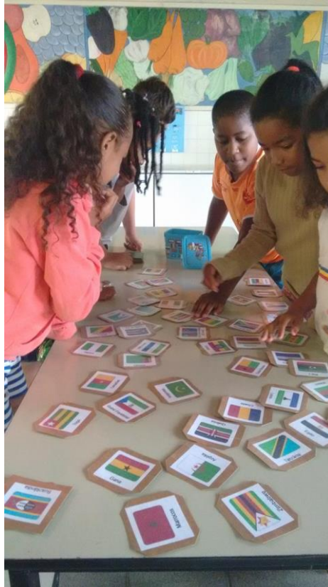
Figura 21 Crianças brincando com o jogo de memória "Bandeiras do Continente Africano"