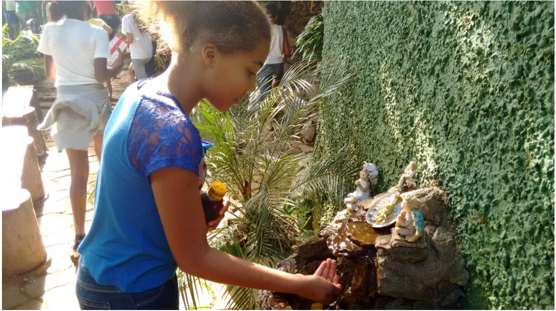
Figura 13 Passeio no Santuário Ecológico da Água Santa