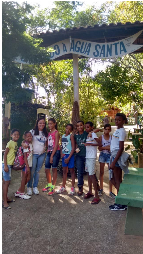
Figura 14 Passeio no Santuário Ecológico da Água Santa