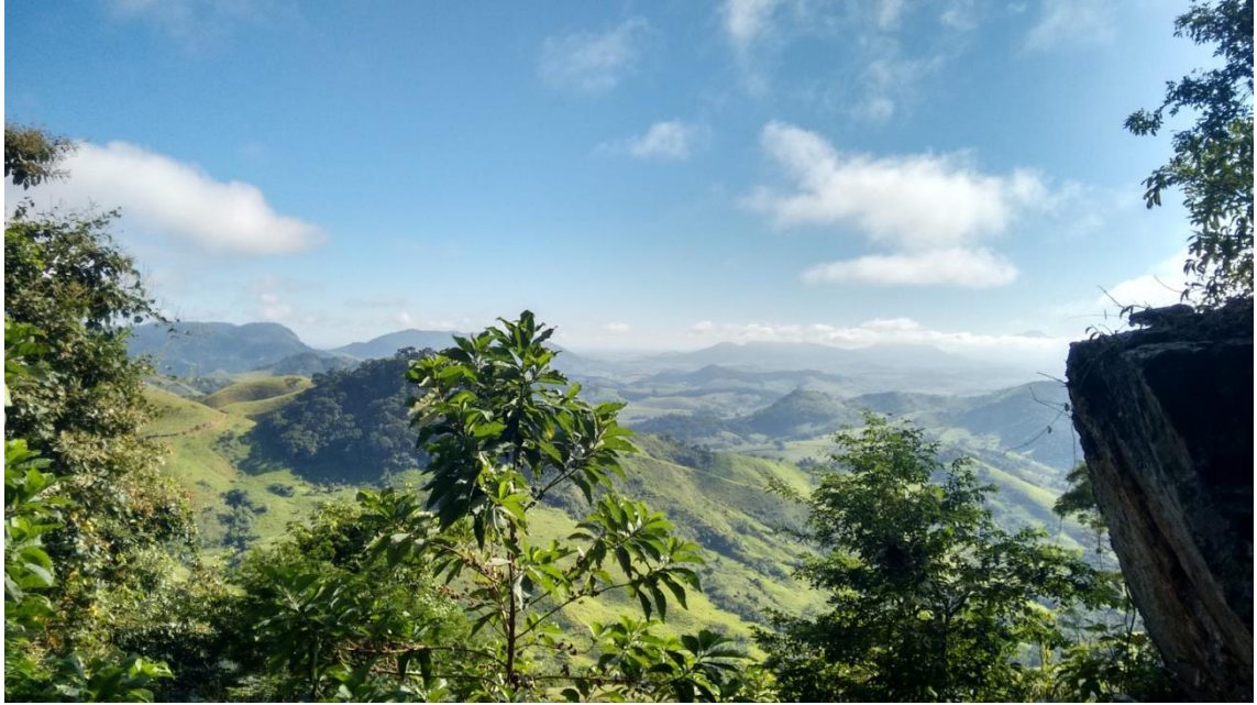
Figura 15 Vista do Santuário Ecológico da Água Santa