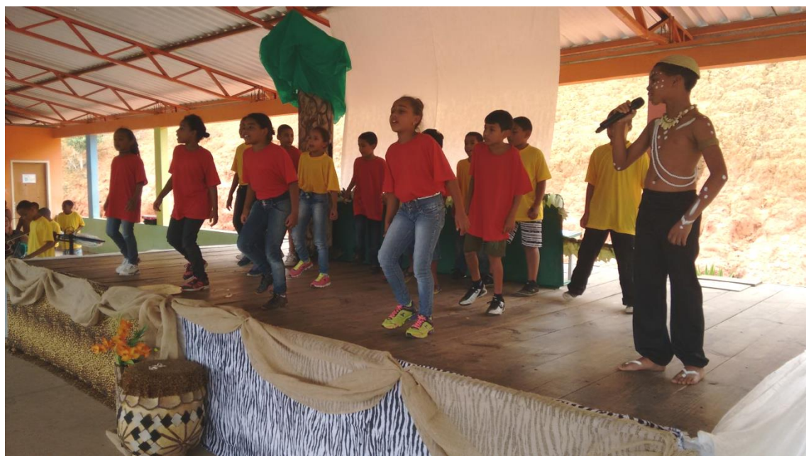
Figura 5 Teatro "O GRIOT" – 1º Afro Dr. Matheus - 2015