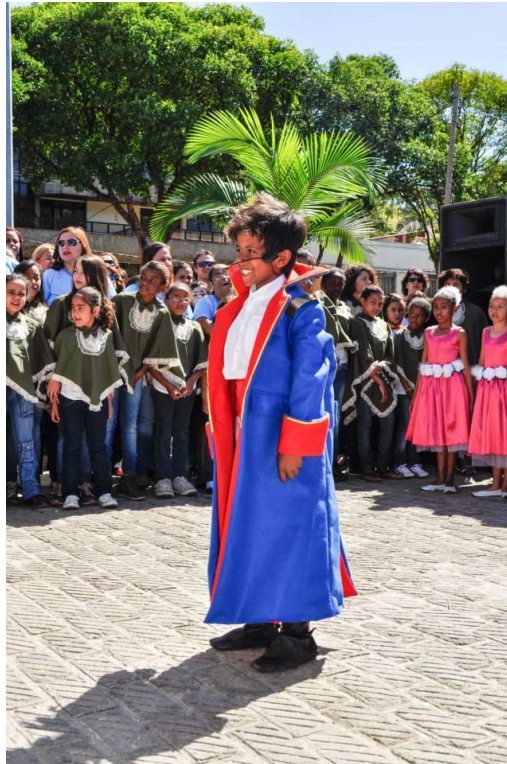
Figura 3 "Homens Honrados" - 2014 - Cena curta "O Pequeno Príncipe"