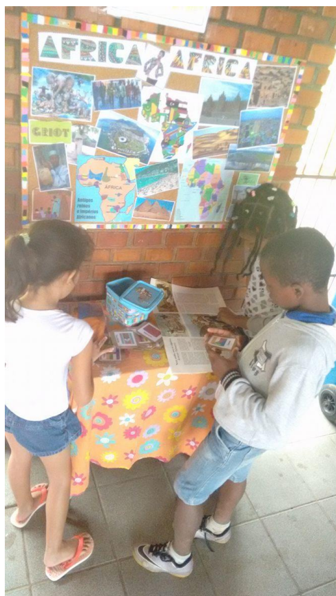
Figura 20 Cantinho África