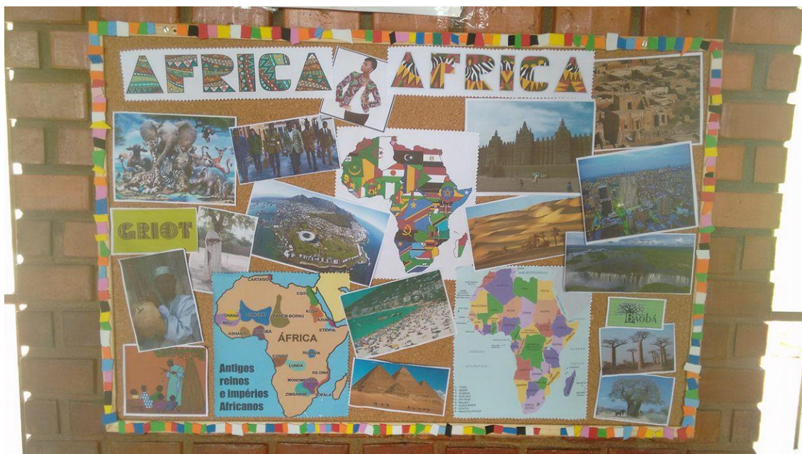
Figura 18 Mural do Cantinho África