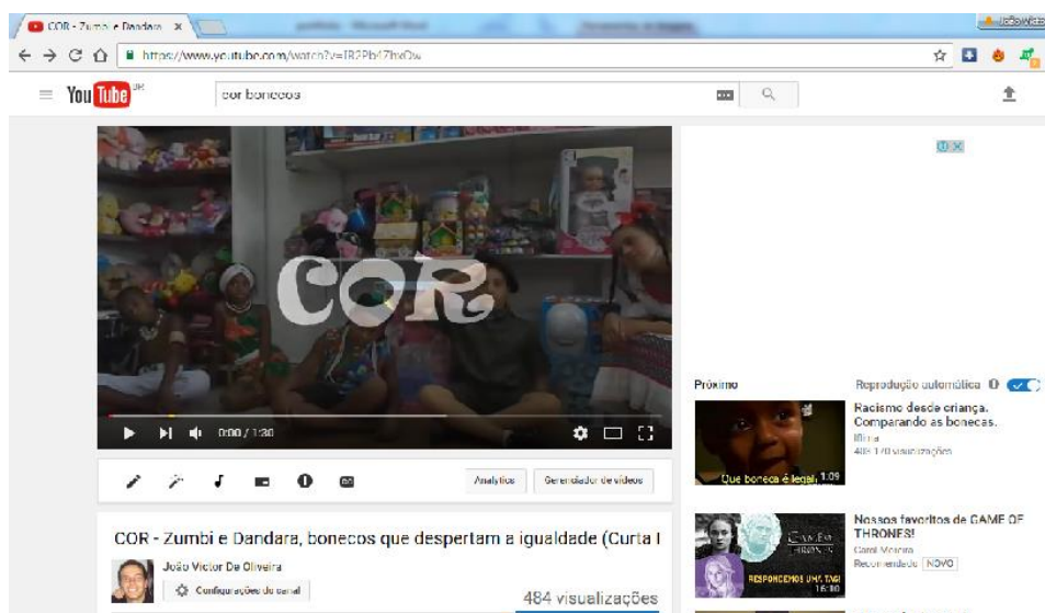
Figura 24 Vídeo "COR" no Youtube