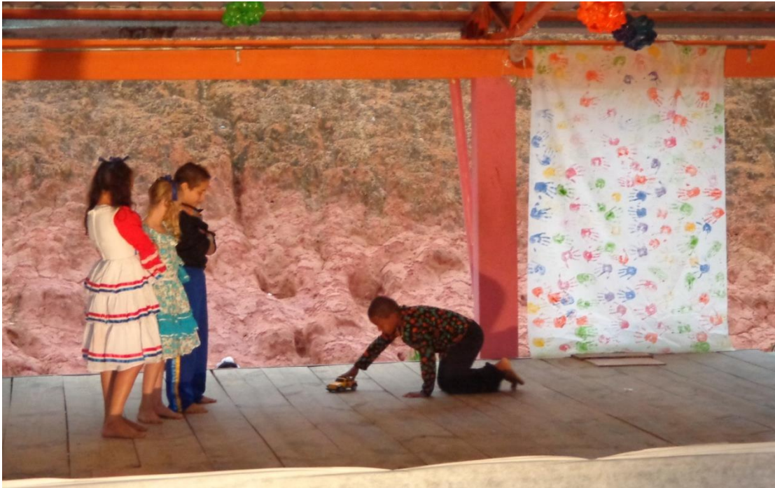
Figura 1 Cena Teatro "COR" 2013