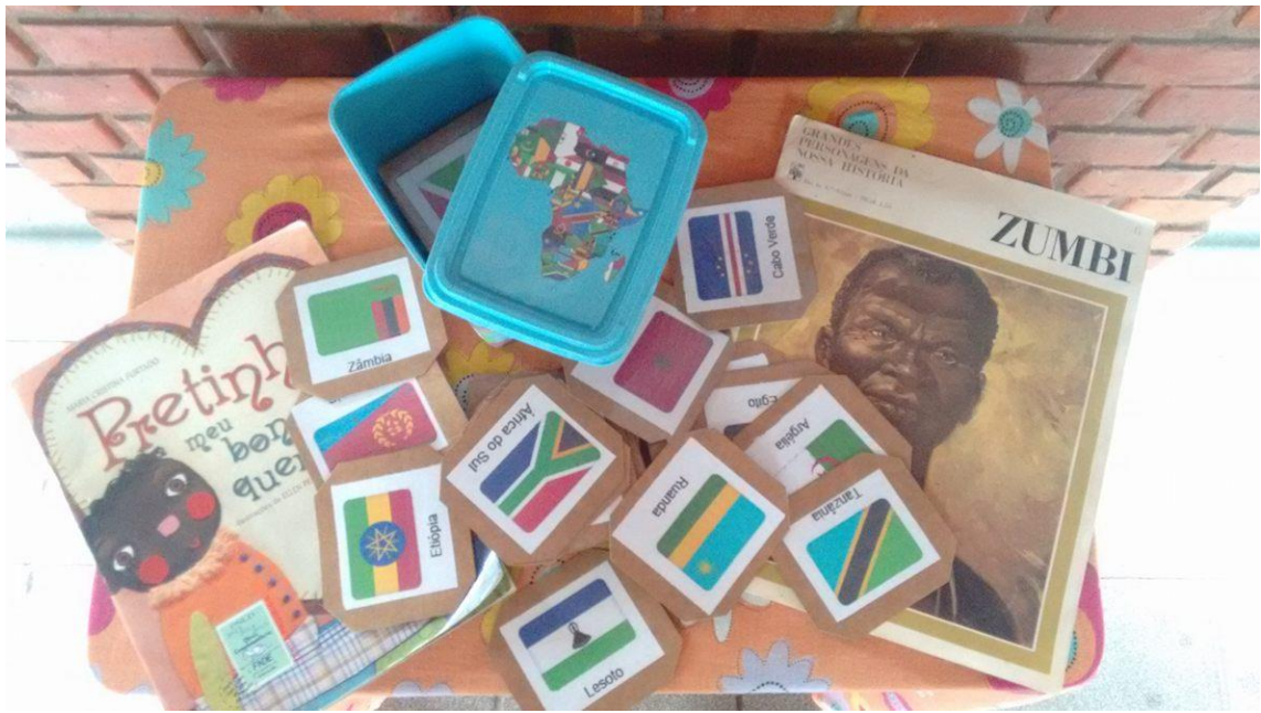
Figura 19 Mesa do Cantinho África com livros que inspiraram o musical “COR” e o jogo da memória com as bandeiras dos países do continente Africano.