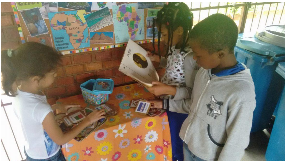
Figura 22 O acesso dos alunos ao material é livre e novidades vão sendo adicionadas com o passar dos dias.

A escola possui uma página no Facebook onde se encontram mais fotos e também alguns vídeos desses trabalhos citados, basta procurar na rede social por “Escola Doutor Matheus Monteiro da Silva” ou digitar www.facebook.com/EscolaDoutorMatheusMonteirodaSilva . No youtube também está disponível o vídeo de 1 minuto “COR”, o qual participou do concurso “Curta Histórias” do MEC, para assistir pesquise por COR - Zumbi e Dandara, bonecos que despertam a igualdade (Curta Histórias 2014) ou digite o link: www.youtube.com/watch?v=IR2Pb4ZhxOw