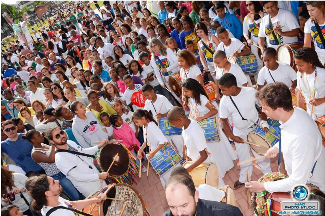
Figura 10 Tambores de Congada na apresentação da "Chama Olímpica" em Bicas (Crianças da escola junto com o grupo INGOMA de Juiz de Fora)