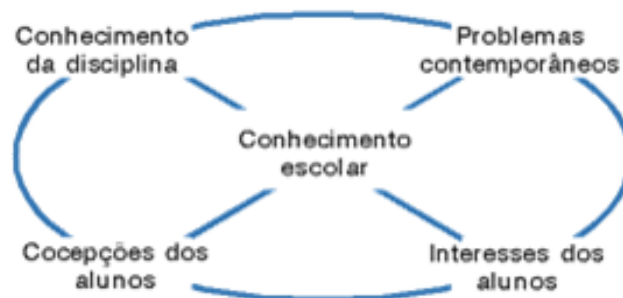
Figura 3 - Concepção integradora do conhecimento construído a partir de projetos

A pedagogia de projetos deve integrar conhecimentos disciplinares, experiências socioculturais dos alunos, conhecimentos contemporâneos e situações do contexto, conforme apresentado na figura 3.