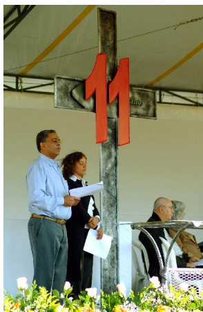
Figura 2: Crucifixo do altar.

Essa cerimônia recebeu muito sugestivamente o nome de “Celebrando a vida”. A estrutura física para o Culto foi montada ao ar livre, numa área de muito verde, e consistia num altar montado como um palanque e abaixo dele, no centro, um tablado quase do mesmo tamanho, logo depois as filas de cadeiras para funcionários, colaboradores externos e familiares. A disposição física, apesar de homogênea e sem marcação explícita por alguma reserva, representou exatamente a hierarquia da empresa. Na primeira fila posicionaram-se os diretores e gerentes junto com seus convidados, havia também um espaço para a mídia. Em seguida convidados de associações de classes, pequenos fornecedores e depois os demais funcionários com seus familiares (mulher e filhos). As pessoas se cumprimentavam e se posicionavam, deslocando-se para seus lugares. Havia aproximadamente umas 400 pessoas neste local.