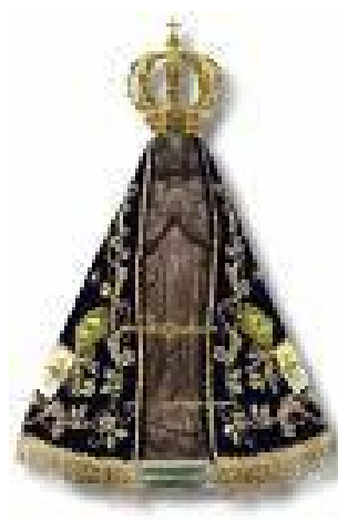
Figura 5: Imagem da Nossa Senhora do refeitório. Figura 6: Imagem de Nossa Senhora Aparecida.

Descobri numa visita ao refeitório que a imagem da Nossa Senhora do Refeitório não tem nenhuma semelhança com a Nossa Senhora Aparecida (como se pode ver pelas figuras). Diante das diferenças das imagens e do local onde a “Nossa Senhora do refeitório” está colocada, como eles mesmo dizem “desde sempre” e “à vista de todos”, percebo que a imagem é resignificada pela “religiosidade mínima” que os une. Por isso, ela é tão importante