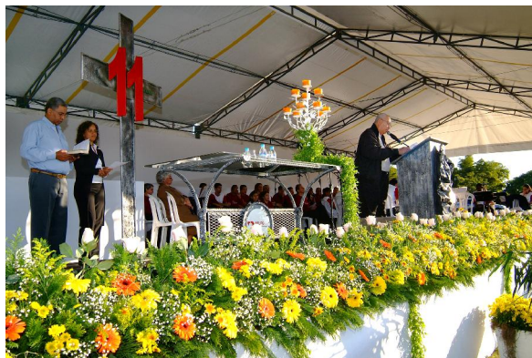
Figura 4: Foto que ilustra o momento da homilia.

A comunidade canta o hino do voluntário junto com o coral