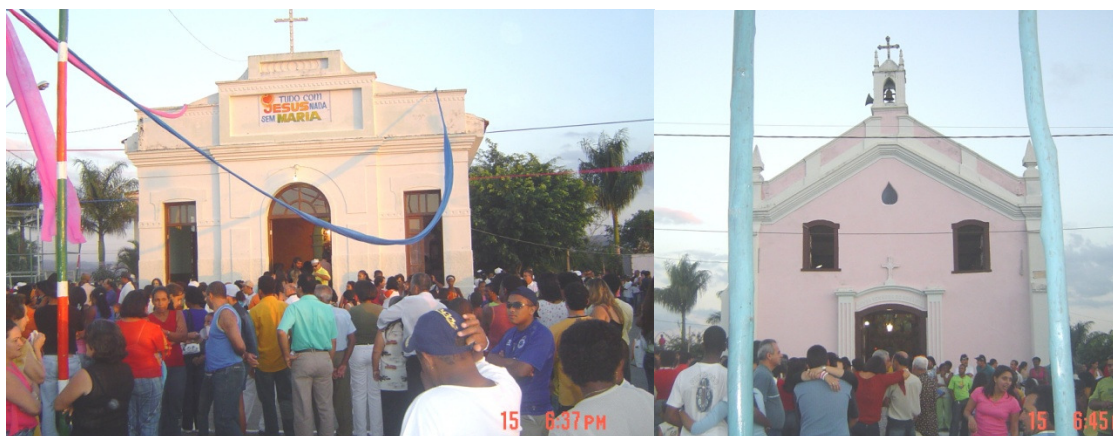
A sede-capela da Irmandade Sete Guardas Nossa Senhora do Rosário (à esquerda) e a igreja de Nossa Senhora do Rosário (à direita) em dias de Reinado. Fotografias: Sueli Oliveira – 2007

Esse episódio é recorrente nas narrativas dos congadeiros, mesmo daqueles que não o vivenciaram diretamente. São lembranças transmitidas de uma geração a outra oralmente que permanecem vivas entre os congadeiros, o que em parte justifica a persistência dos conflitos entre as hoje chamadas “guardas de baixo” e “guardas de cima. A experiência dos antigos congadeiros que vivenciaram a proibição e daqueles que participaram do estabelecimento dessa nova conformação do Reinado, bem como a nova postura do clero, parece fazer parte da própria experiência das novas gerações. As experiências dos antigos quando narradas são incorporadas na experiência do grupo como um todo. Como diz Benjamin, “o narrador retira da experiência o que ele conta: sua própria experiência ou a relatada por outros. E incorpora as coisas narradas à experiência de seus ouvintes” 277 .