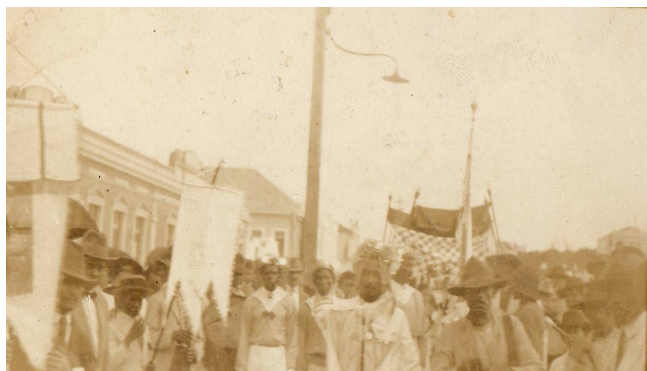
Reinado em Itaúna – década de 1950

que encontramos sobre o assunto foi um grande silêncio no livro de Atas da Sociedade Nossa Senhora do Rosário. A reunião seguinte a da apresentação da proposta de reaproximação registrada em ata aconteceu somente em 1948, ou seja, quatro anos depois, e não tratou do assunto.