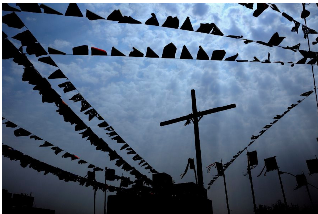
Mastros e bandeiras compõem o cenário da festa do Reinado. Fotografia: Juliana Salles de Siqueira – Reinado 2010.