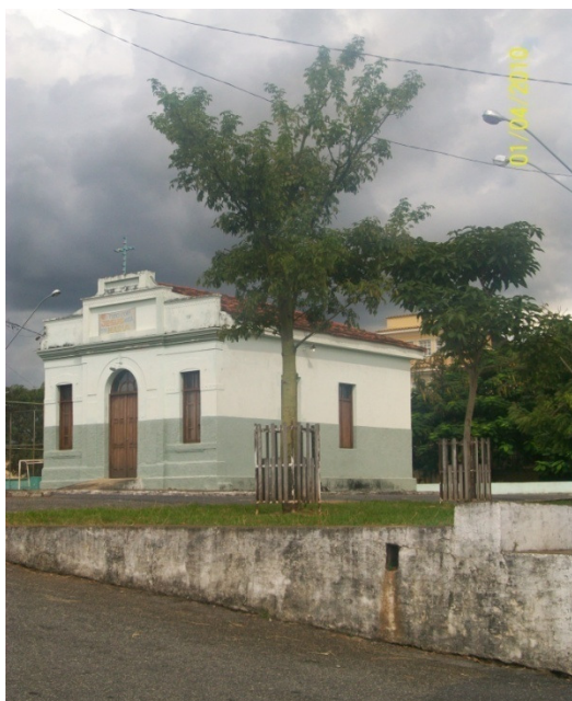
Sede-capela da Irmandade Sete Guardas Nossa Senhora do Rosário, construída pelos congadeiros em 1935.

Assim, a fim de dar continuidade aos seus compromissos rituais, contando com a participação de integrantes não congadeiros influentes na sociedade local no exercício de cargos na diretoria, o que lhes garantiriam certa legitimidade, os membros do Reinado de Itaúna fundaram uma Associação em 1935, cujo principal objetivo era realizar as festas de Nossa Senhora do Rosário. 188