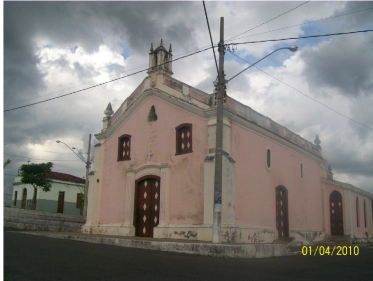
Igreja do Rosário (à direita) e Sede-capela da Irmandade Sete Guardas Nossa Senhora do Rosário (à esquerda), construída pelos congadeiros em 1935. Fotografia: Sueli Oliveira – 2010.

fins lucrativos. Buscava-se, pois, ao se associarem, uma forma de se precaverem das possíveis medidas de controle sobre os conteúdos da fé, efetuadas pela hierarquia católica, e também da possibilidade de serem alvos de perseguições policiais. 189