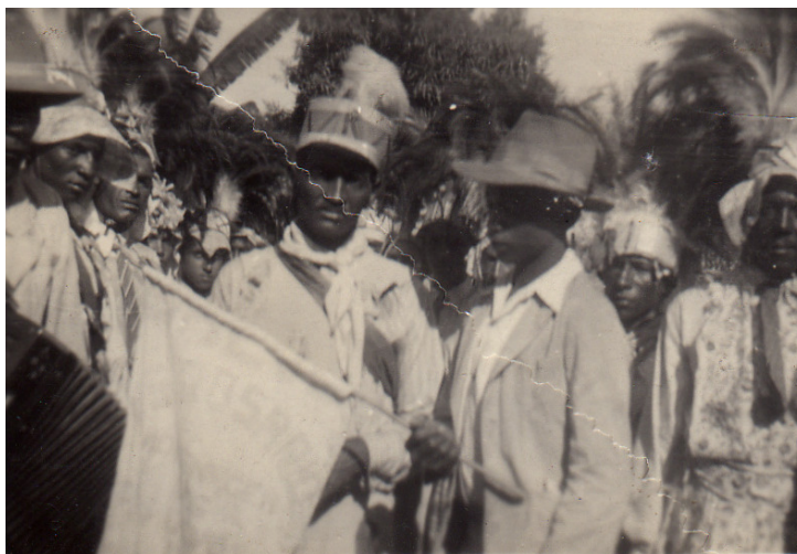
Reinado de Itaúna – década de 1950