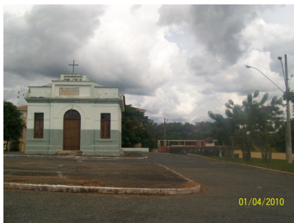
Sede-capela da Irmandade Sete Guardas Nossa Senhora do Rosário. Notem à direita e ao fundo construção que é utilizada para realização da missa conga entre a “igreja de cima” e a “igreja de baixo”.

Note que a questão da distribuição da renda é resolvida com a divisão equânime entre as irmandades, que diante da resistência de se romper a configuração dos espaços rituais, o tríduo passa a ser celebrado na “capela N.Sra. do Rosário e na Sede” e com a missa conga buscará romper com essa a divisão espacial vigente.