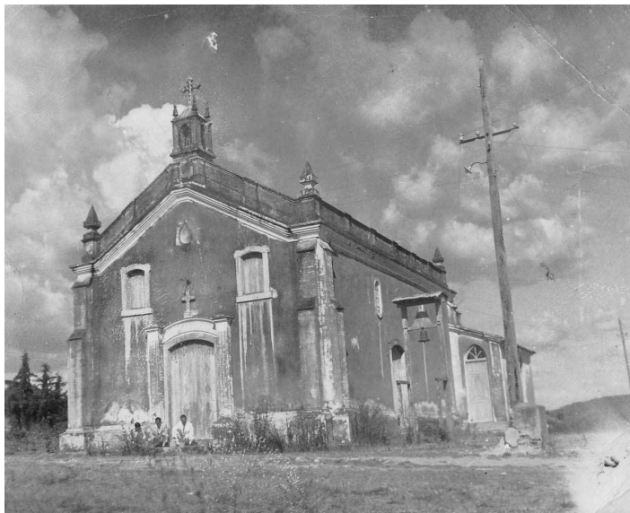
Antiga igreja matriz, que passou a ser igreja de Nossa Senhora do Rosário, após a troca dos oragos. Fotografia: datada de 1948. Acervo Museu Municipal Francisco Manoel Franco, Itaúna/MG.

A troca dos oragos é apreendida pelo autor como uma estratégia da hierarquia católica, que teria manipulado as crenças dos negros em prol do interesse próprio, uma vez que o local em que se encontrava a capela tornara, com o crescimento da cidade, mais propício porque de fácil acesso para os fiéis e também de construção mais recente, portanto, mais adequada para ser a igreja matriz. No entanto, o autor ao fazer uso da expressão “foi reconduzida” deixa implícito que a imagem de Nossa Senhora do Rosário teria sido abrigada anteriormente na igreja do alto, até então matriz. Esse fato nos faz pensar que os negros também pudessem ter interesse na permuta, ou seja, na recondução da imagem. Esse interesse poderia estar ligado ao valor simbólico que o antigo templo teria tanto para os devotos de Nossa Senhora do Rosário quanto para os demais católicos, uma vez que além de possuir um significado originário para integrantes do Reinado, historicamente teria sido igreja matriz, local de grande efervescência religiosa e prestígio social. A partir de então, os festejos em honra a Nossa Senhora do Rosário passaram a ser realizados na igreja do alto, antiga matriz da cidade. O morro sobre o qual se fixava a antiga matriz passou a ser denominado “Alto do Rosário”. Os congadeiros preencheram-no com os significados de sua devoção.