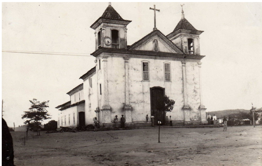
Igreja construída pelos negros na década de 1840, que após a troca de oragos, passou a ser a igreja matriz. Esse edifício foi demolido em 1934 para a construção de uma nova igreja matriz. Fotografia: datada de 1920.

Santana [hoje, município de Itaúna] e concitaram o povo a ampliar a capela já ereta em matriz. 127