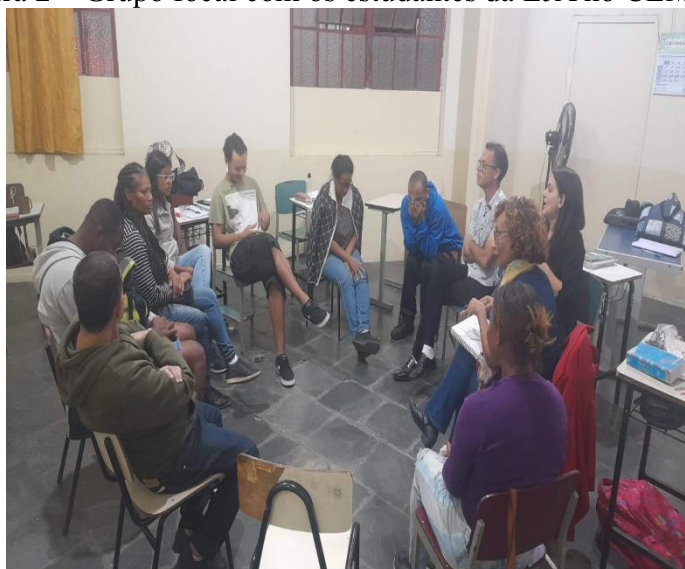
Figura 2 – Grupo focal com os estudantes da EJA no CEM – Noturno

Com o apoio dos demais professores, que autorizaram a participação de seus alunos na atividade do grupo focal, estabelecemos o primeiro contato com cada grupo de estudantes nos distintos turnos da manhã e da noite. Em cada turno participaram, respectivamente, 13 alunos e 14 alunos. Os critérios de escolha dos estudantes para participação no grupo focal foram: faixa etária (entre 15 e 29 anos), condições socioeconômicas, residência, escolaridade (sendo estudantes da Educação de Jovens e Adultos) e pertencimento racial.