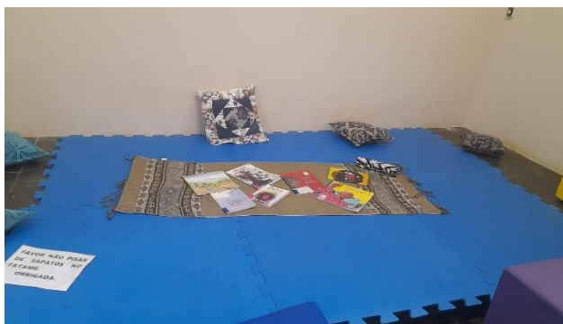
Figura 3 – Espaço preparado para receber os estudantes