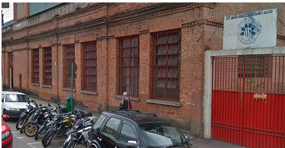
Figura 1 – Porta de entrada do Centro de Educação de Jovens e Adultos Dr. Geraldo Moutinho (CEM)