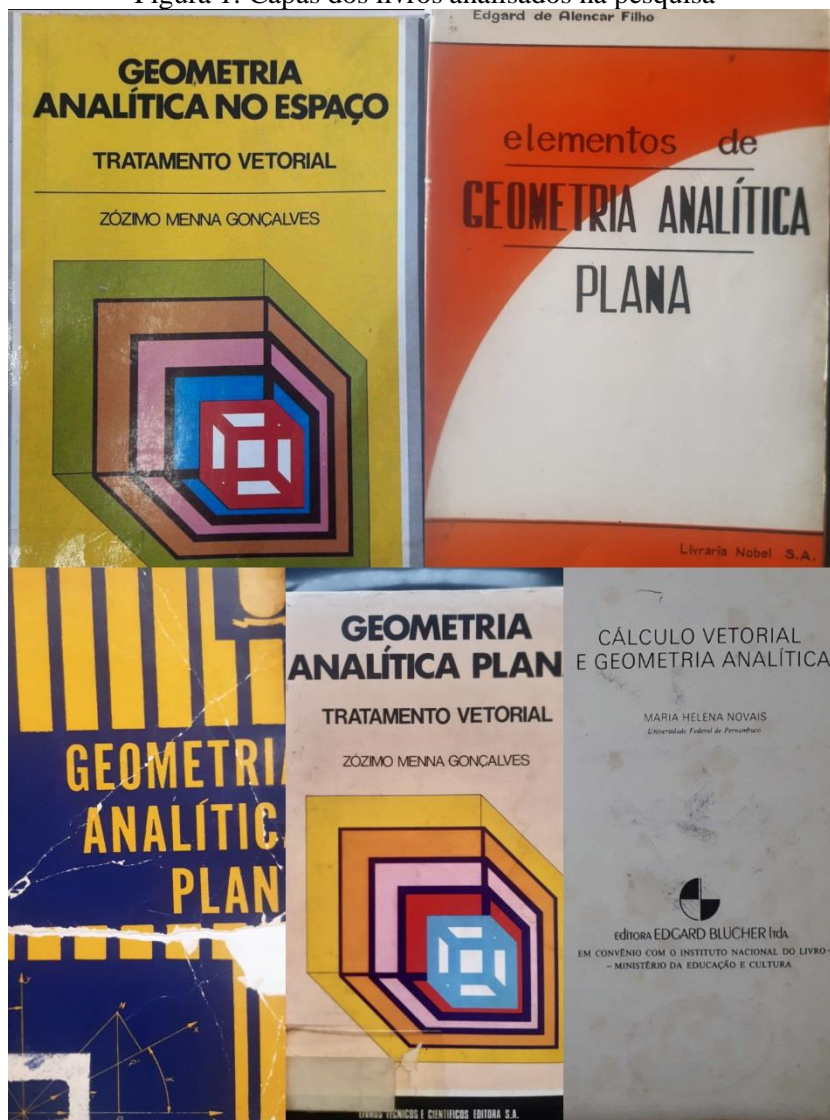
Figura 1: Capas dos livros analisados na pesquisa

Parte II – Contextualização da pesquisa e do PE – A pesquisa de mestrado que está por trás dessa discussão investiga o ensino de GA no ensino superior com perspectiva histórica nas décadas de 1960 e 1970. A justificativa do projeto compreende um fato histórico a respeito de livros didáticos de GA que circularam no Brasil com autores estrangeiros ou obras traduzidas, mas que a partir da década de 1960 começam a surgir livros de autores brasileiros. Apresentaremos aqui algumas obras encontradas nas Bibliotecas da UFJF que foram utilizadas como fontes históricas no projeto: