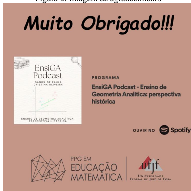
Figura 2: Imagem de agradecimento

Parte Final com imagem de agradecimento.