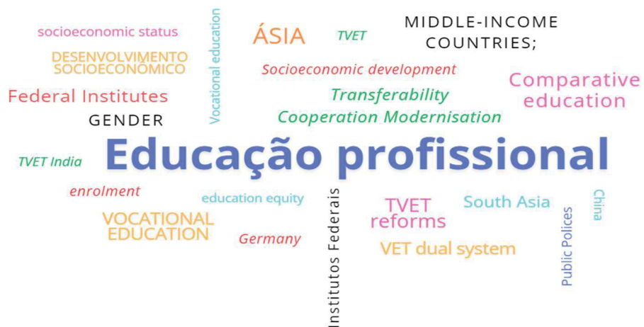
Figura 4 – Nuvem de palavras mais comuns ao relacionar a EPT brasileira com outros modelos internacionais similares.

Na imagem a seguir (Figura 4), a nuvem de palavras além da Alemanha, cita diversas regiões do globo, como o continente asiático, a China, Índia e países de renda média no geral, o que é corroborado pela leitura dos textos que indica que os países em desenvolvimento buscam no ensino dual alemão, inspirações para seus próprios modelos de educação técnica profissionalizante.