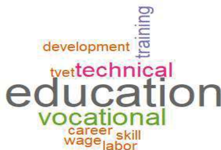
Figura 6 – Nuvem de palavras-chave relacionadas a inserção produtiva e retornos salariais

estabelecem uma clara conexão entre a formação educacional e os resultados no mercado de trabalho, sugerindo que os estudos frequentemente abordam o impacto da educação nas trajetórias profissionais e nos ganhos financeiros. A inclusão de "training" ressalta a importância de abordagens práticas e aplicadas na educação. Juntas, essas palavras-chave indicam que os trabalhos analisados exploram extensivamente como a educação técnica e profissional se relaciona com o desenvolvimento de habilidades, oportunidades de carreira e potencial de ganhos, refletindo tendências atuais em políticas educacionais e as demandas do mercado por profissionais qualificados em áreas técnicas e vocacionais.