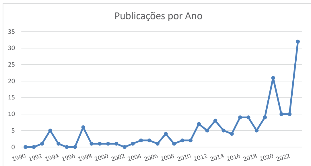
Figura 2 – Evolução de publicações por ano

A partir dos 172 textos restantes, foi elaborado na figura 2 um gráfico mostrando a evolução da quantidade de publicações por ano.