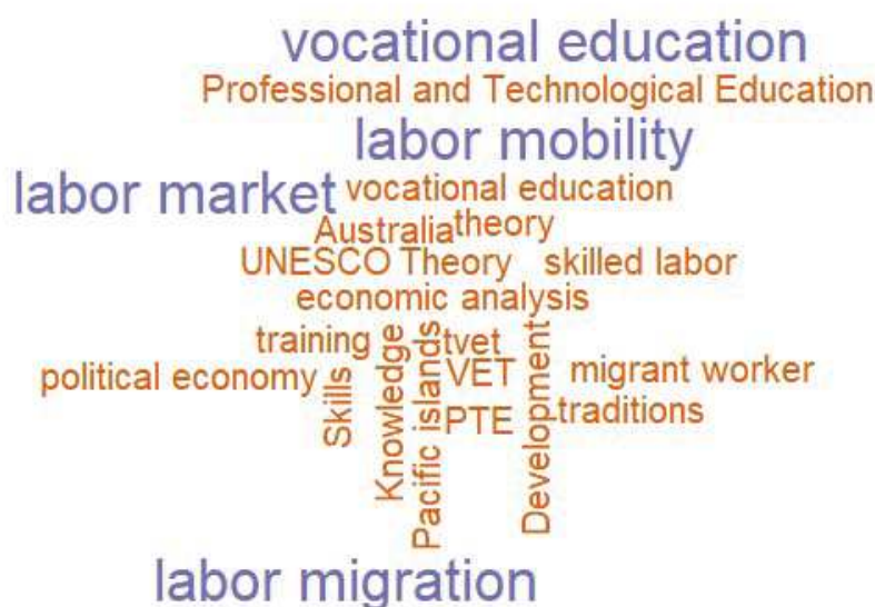
Figura 5 – Nuvem de palavras-chave relacionadas aos textos que tratam sobre a aplicação da EPT no desenvolvimento econômico

desenvolvimento econômico. A predominância de " vocational education " sugere que a formação profissional é o eixo principal da discussão, enquanto " Professional and Technological Education " destaca a importância de programas que combinam conhecimentos profissionais e tecnológicos. Termos como " labor market ", " labor mobility " e " labor migration " estabelecem uma clara conexão entre a educação vocacional e as dinâmicas do mercado de trabalho, incluindo movimentações nacionais e internacionais de trabalhadores. Siglas como " TVET " e " VET " reforçam o foco específico em educação e treinamento técnico e vocacional. Juntas, essas palavras-chave indicam que os trabalhos analisados exploram extensivamente como a educação profissional e tecnológica se relaciona com as dinâmicas do mercado de trabalho, desenvolvimento de habilidades e seu impacto no crescimento econômico, refletindo uma abordagem multifacetada que considera aspectos teóricos, práticos, econômicos e políticos no contexto do desenvolvimento global e local.