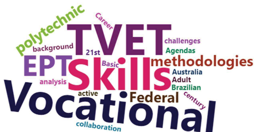
Figura 3 -Nuvem de palavras-chave mais presentes nos trabalhos analisados