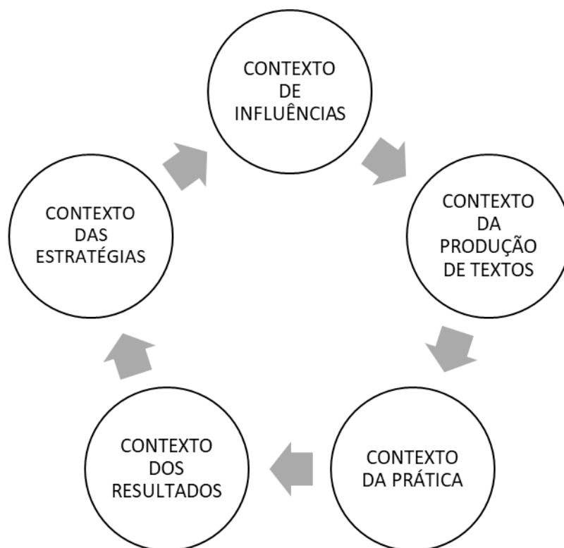
Figura 7 – Contextos do processo de formação de uma política

Fonte: Adaptado de Mainardes (2006, p. 51, apud Bowe et al. , 1992, p. 20).