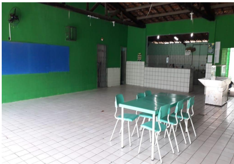
Figura 3 - Cozinha e refeitório/pátio da Escola A (2019)

Das nove salas, nenhuma é climatizada e nem todas as salas de aula disponibilizavam, até o final de 2022, armário para os alunos, sendo que, atualmente, todas as turmas estão no regime de tempo integral na instituição. Há, também, uma sala de vídeo, uma biblioteca (Centro de Multimeios), um laboratório de informática. Durante um tempo, o antigo pátio da escola foi transformado em refeitório improvisado para o qual chegaram mesas, cadeiras, bebedouro e mesa de servir comida quente, como se vê na figura 3.