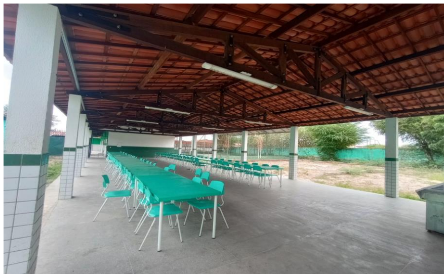
Figura 5- Atual refeitório construído em 2021

Em 2021, o refeitório da escola foi construído (figura 5), o que tornou o momento das três refeições oferecidas na escola mais organizado.