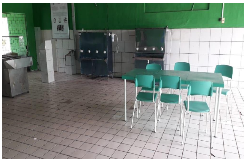
Figura 4 - Refeitório/pátio da Escola A (2019)