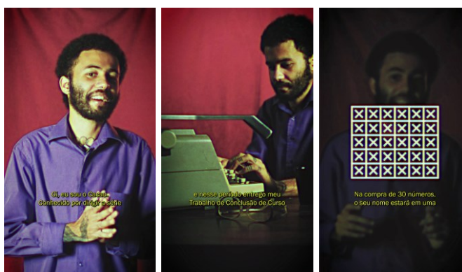
Figura 10 – Resultado final do visual do vídeo de divulgação da rifa

Uma semana após a divulgação do vídeo a meta estipulada para a arrecadação foi atingida, garantindo assim os gastos com armazenamento de mídia e com o transporte dos equipamentos do Estúdio Almeida Fleming, em Juiz de Fora, para o local de gravação em Ritópolis.