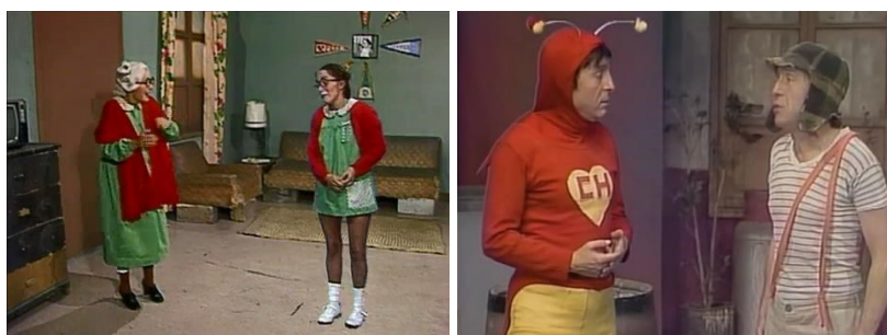
Figura 11 – Comparação de capturas de “Chaves” e “Chapolin” com capturas não finalizadas do episódio 4, “NECROSHOP LOVE”.

O processo de finalização seguirá os passos de efeitos visuais, motion design e a correção de cor. Na primeira etapa, serão ajustados os efeitos que não conseguem ser obtidos no momento da gravação. Entre elas estão as seguintes sequências: no episódio 2, quando a personagem Maura está levitando da cama devido ao efeito de seu remédio; toda a sequência do depoimento do cliente E em que ele interage com uma cópia dele mesmo; e o terceiro jogo do episódio 4, a Dama de Ferro da Alegria, que foi toda gravada usando uma tela verde. Os efeitos visuais não terão nenhum compromisso com verossimilhança, tendo como referência os efeitos de duplicação utilizadas nas séries “Chaves” ( El Chavo del Ocho , 1973 – 1980) e Chapolin ( El Chapulín Colorado , 1973-1979).