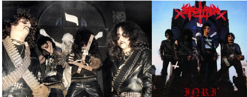
Figura 1 - Integrantes da banda mineira de death metal Sarcófago, uma das pioneiras no uso da corpse paint em sua identidade visual.