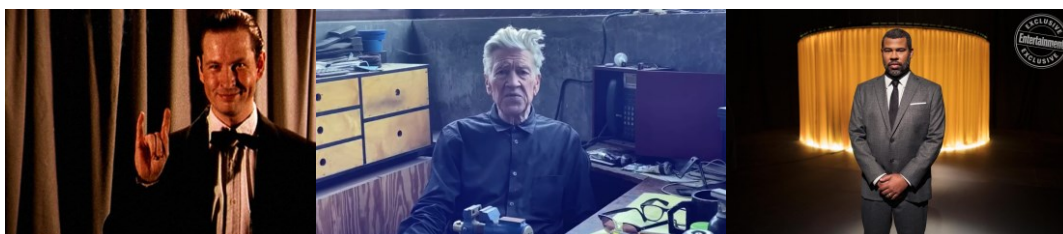
Figura 9 - Da esquerda para a direita: Lars Von Trier em Riget , David Lynch em um dos vídeos de previsão do tempo de seu canal e Jordan Peele em The Twilight Zone .