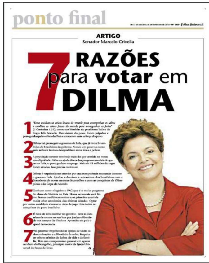
Figura 01 – As sete razões para votar em Dilma segundo Marcelo Crivella