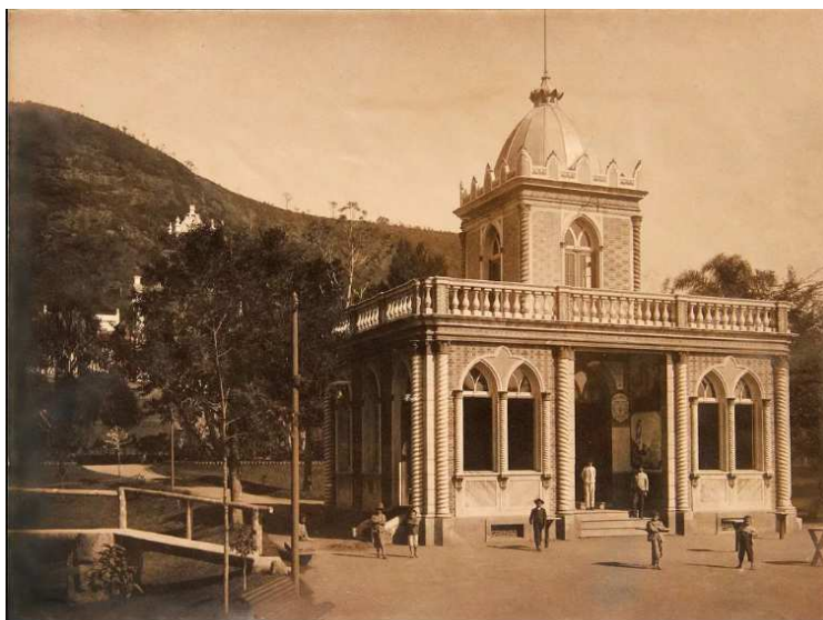
Figura 2: Prédio demolido da antiga Biblioteca Municipal, que se encontrava no Parque Halfeld.

De acordo com essa legislação, as marcações identitárias dos povos ali pertencentes devem ser preservadas e conservadas ao longo do tempo. O pedido de tombamento foi feito, sobretudo, por conta das reformas urbanas que estavam ocorrendo na cidade e seus desdobramentos, como o crescente fluxo de demolição de construções antigas, como já havia ocorrido dentro do próprio Parque Halfeld, onde antes havia uma construção ao meio, que funcionava a biblioteca municipal e que foi demolida antes do tombamento do Parque.