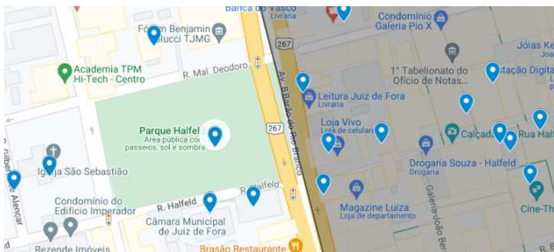
Figura 1: Mapa atual do centro de Juiz de Fora com a marcação dos patrimônios em azul.

Halfeld alterou o traçado do antigo centro urbano da cidade, fazendo com que, a partir de então, o núcleo se desenvolvesse na margem direita do rio Paraibuna, que continua até hoje nos tempos atuais sendo a área central da cidade (SINGULANE, 2021, p.85). No mapa abaixo é possível identificar o Parque Halfeld e os patrimônios culturais ao redor: