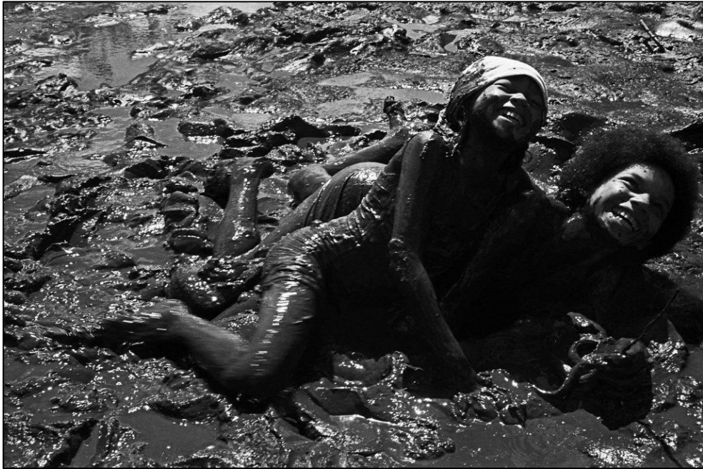
Figura 3 - Jovens e velhas pescando na lama.