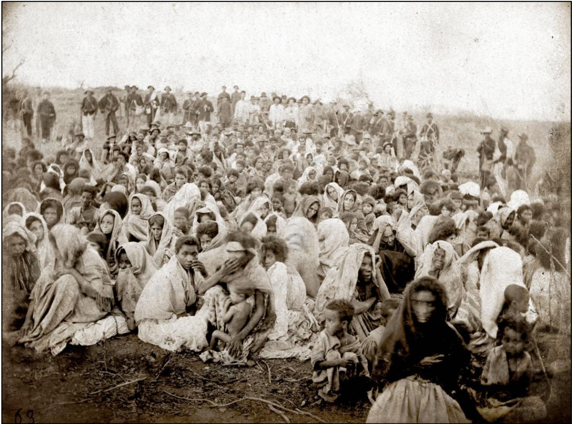
Figura 177 - 400 jagunços prisioneiros

Fonte: BARROS, Flávio de (1897). Acervo do Arquivo Histórico do Museu da República.