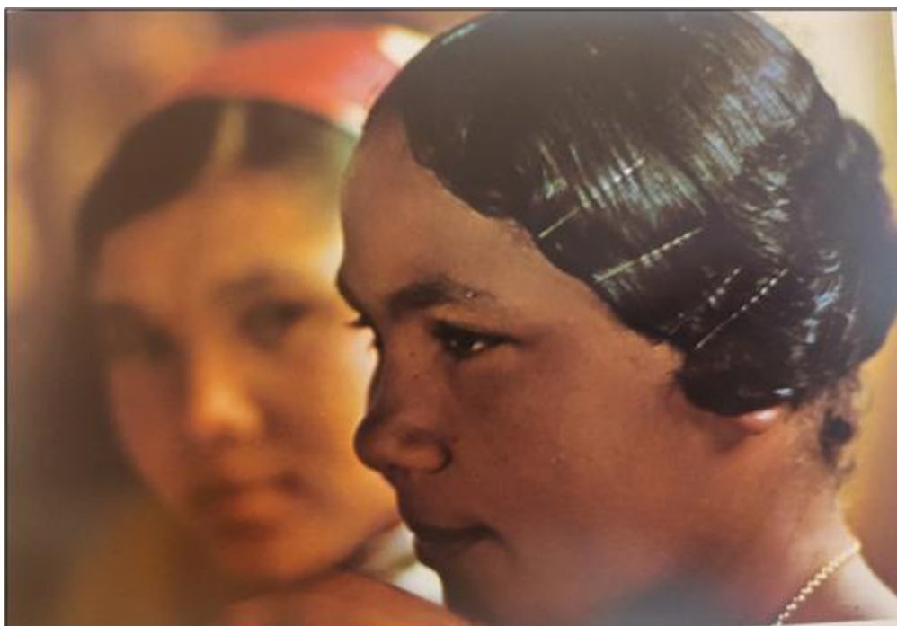
BISILLIAT, Maureen (1982, p. 129).