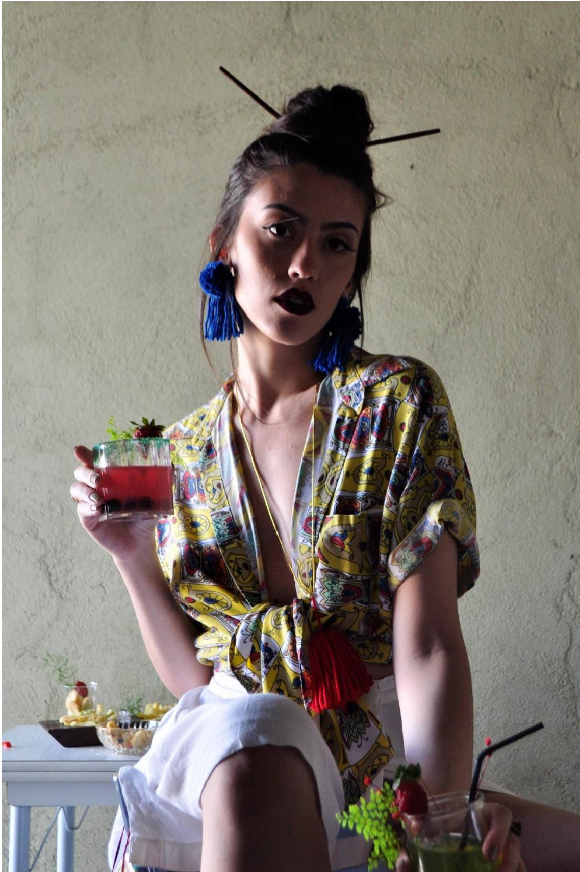
Figura 7 - Dentro bar