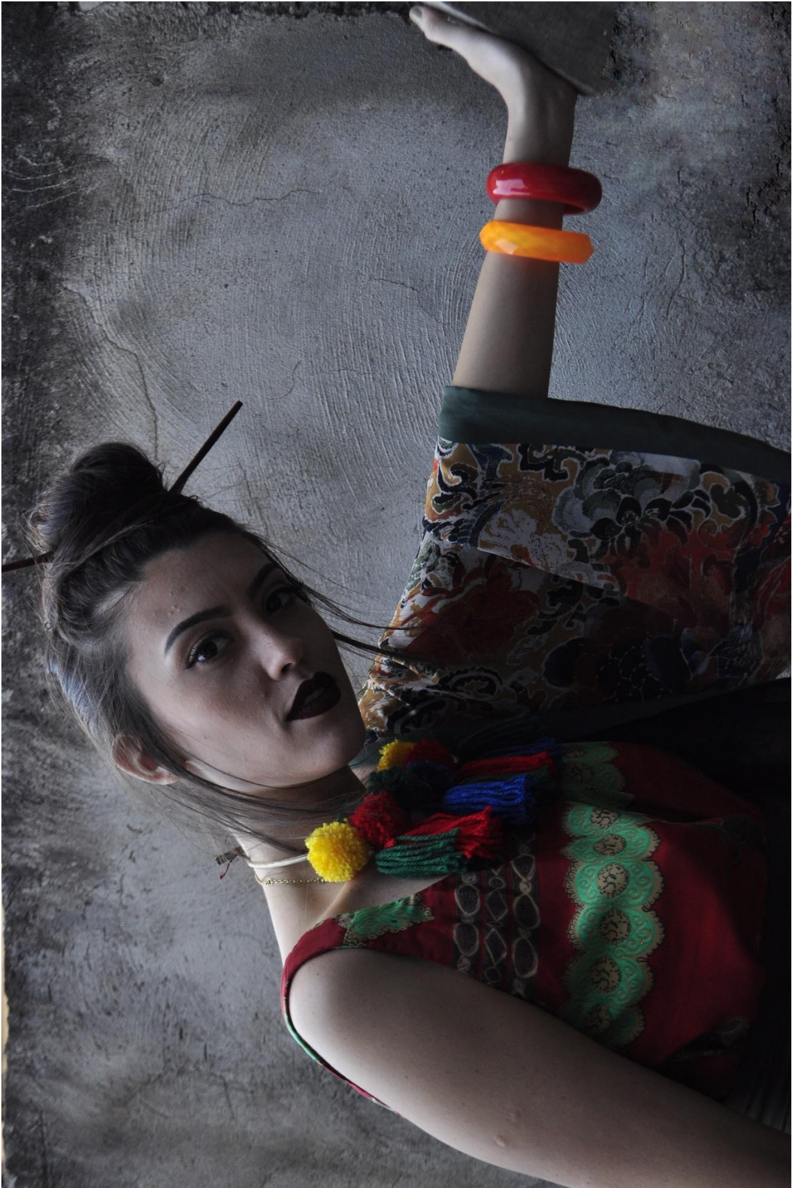
Figura 9 - Mão no muro