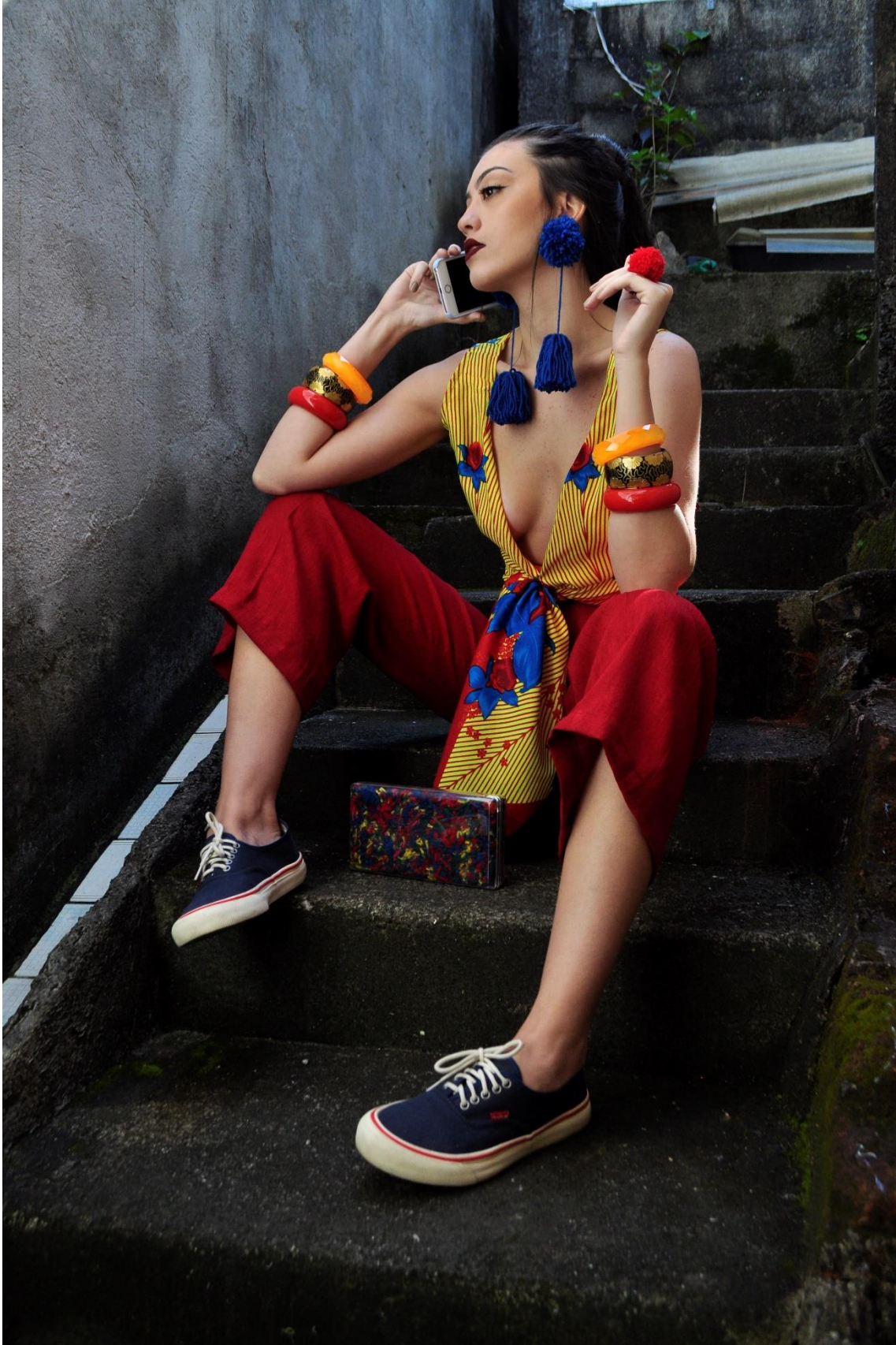
Figura 3 - Falando no celular