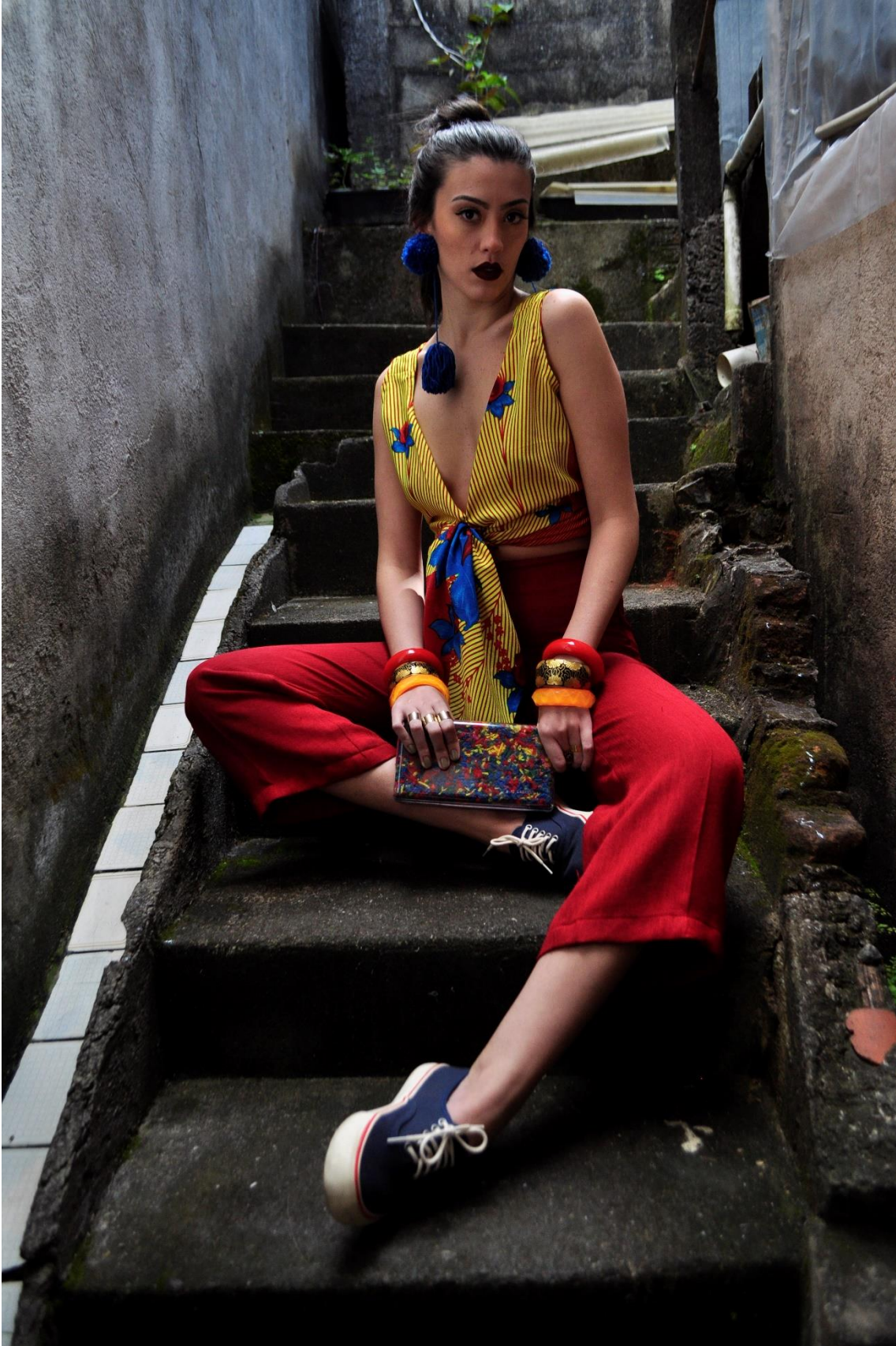
Figura 1- Sentada na escada 1