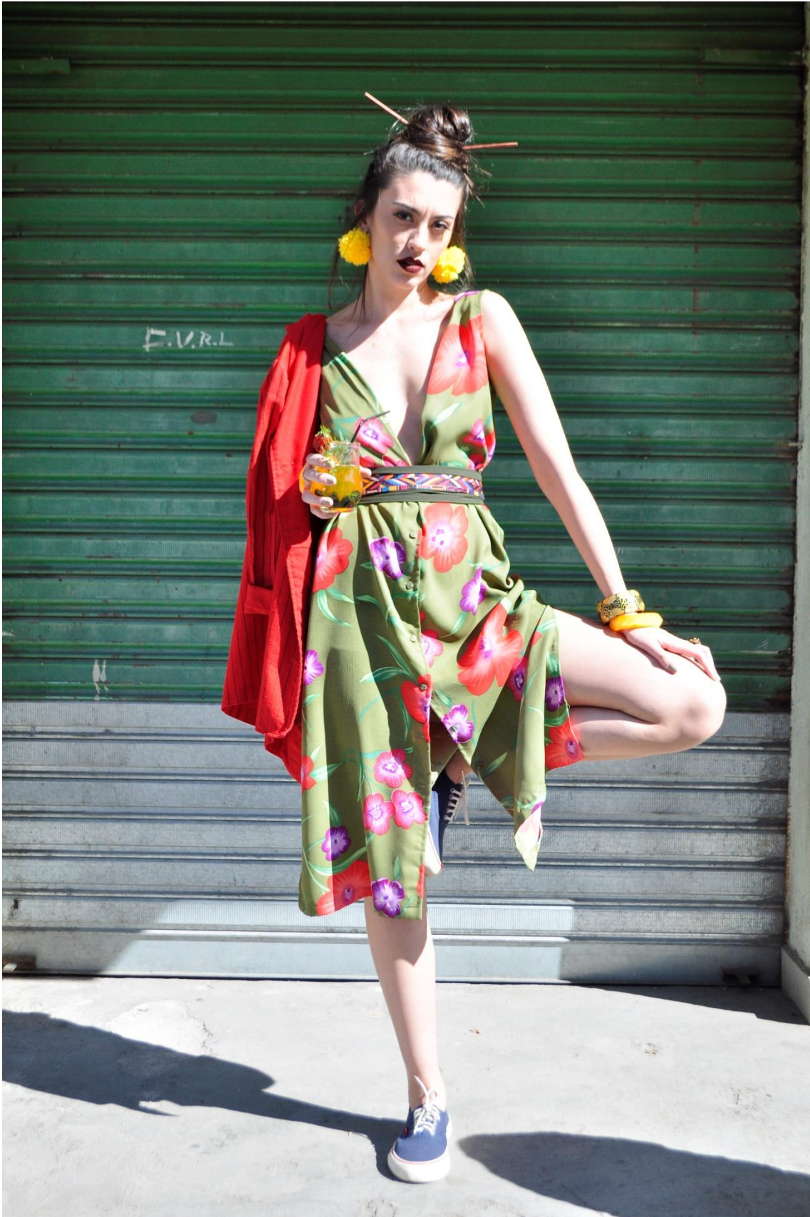
Figura 8 - Fechando o Bar