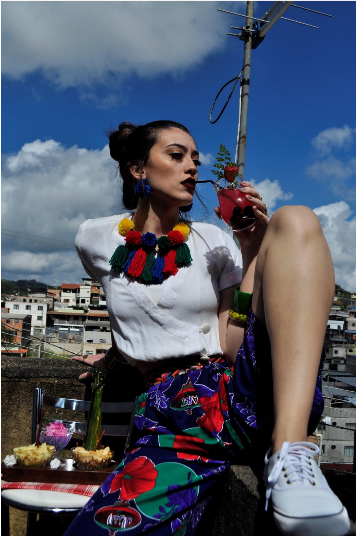
Figura 4 - Sentada no muro Acervo particular da autora, 2018.