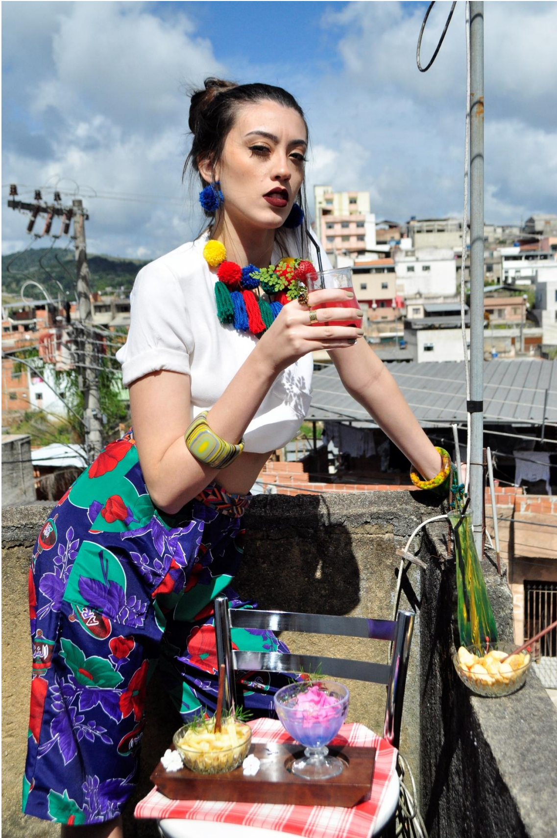
Figura 5 - Encostada no muro Acervo particular da autora, 2018.