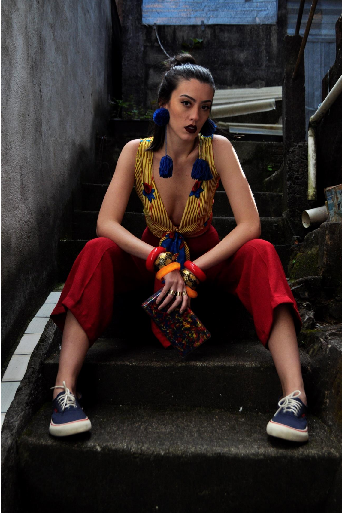
Figura 2 - Sentada na escada 2 Acervo particular da autora, 2018.