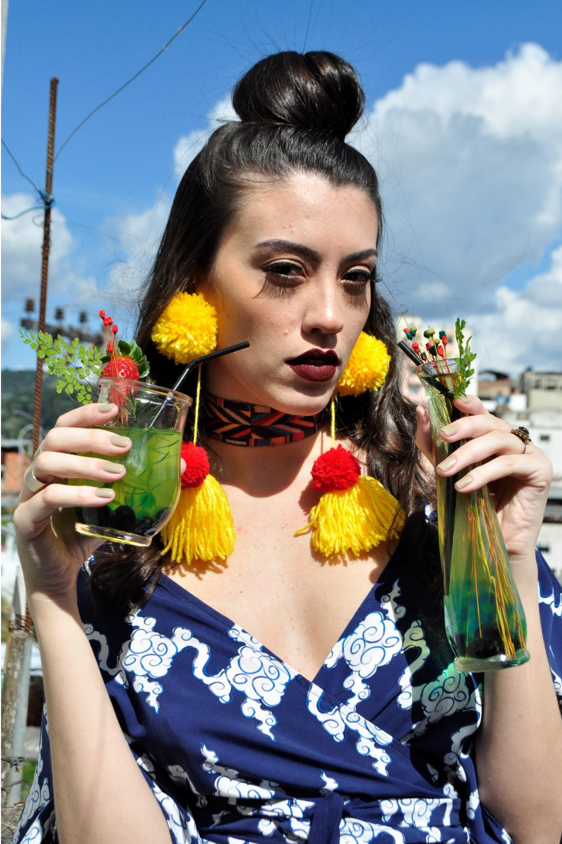
Figura 6 - Foto capa