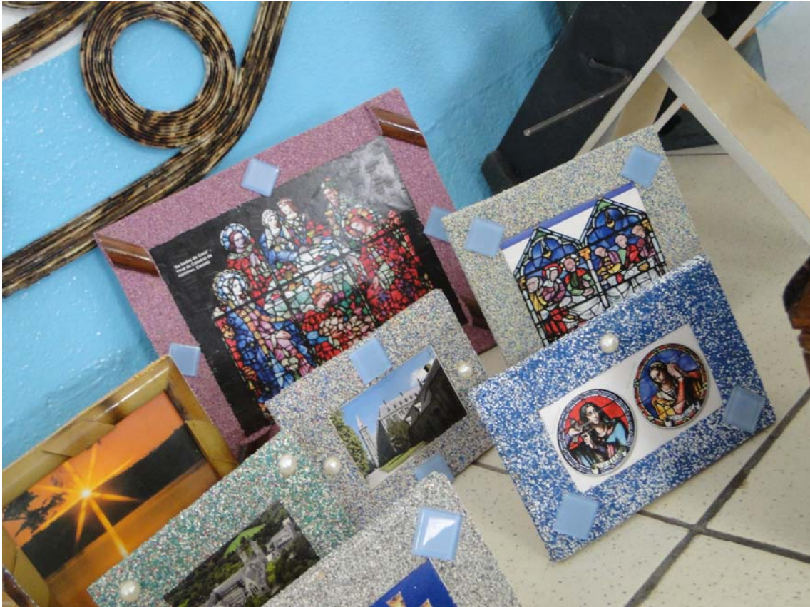
Foto 13: trabalhos produzidos pelos recuperandos do regime fechado

Insta salientar que alguns desses porta-retratos são expostos com figuras de vitrais de igrejas católicas, outros com os dizeres “Jesus te ama” ou “Deus é amor”, tendo o porta-chaveiros a inscrição “Jeová Jiré – o Deus Provedor”.