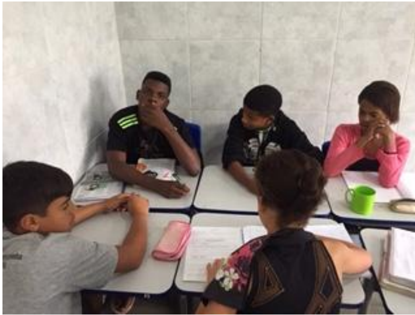
Reescrita coletiva referente ao Módulo III.