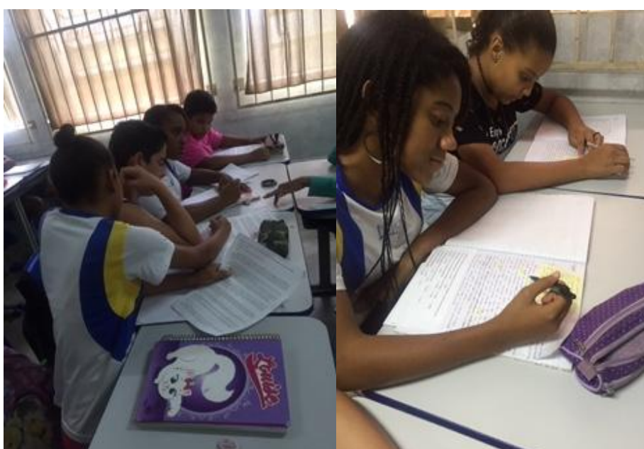
Reescrita pós-produção final.