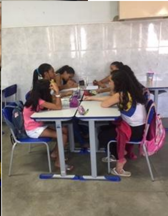
Reescrita coletiva referente ao Módulo II.