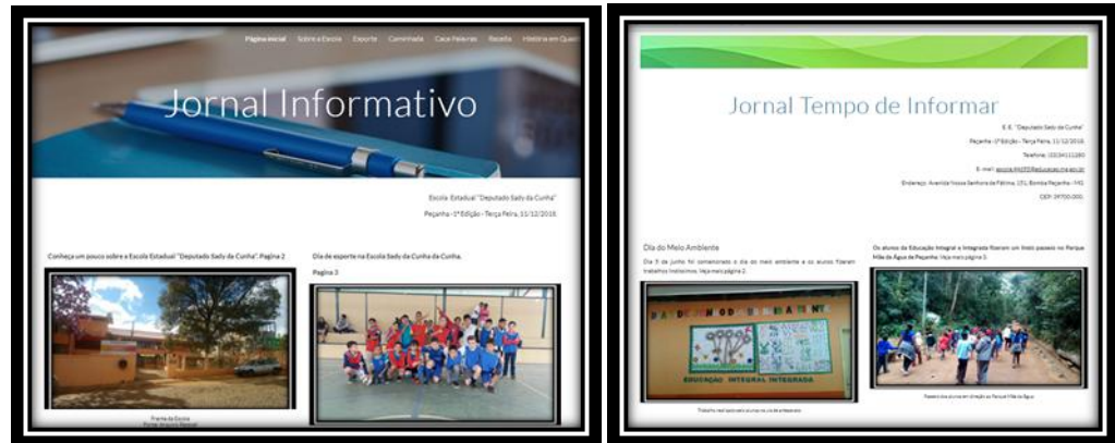
Figura 01: Imagem da primeira página dos jornais online desenvolvidos pelos alunos