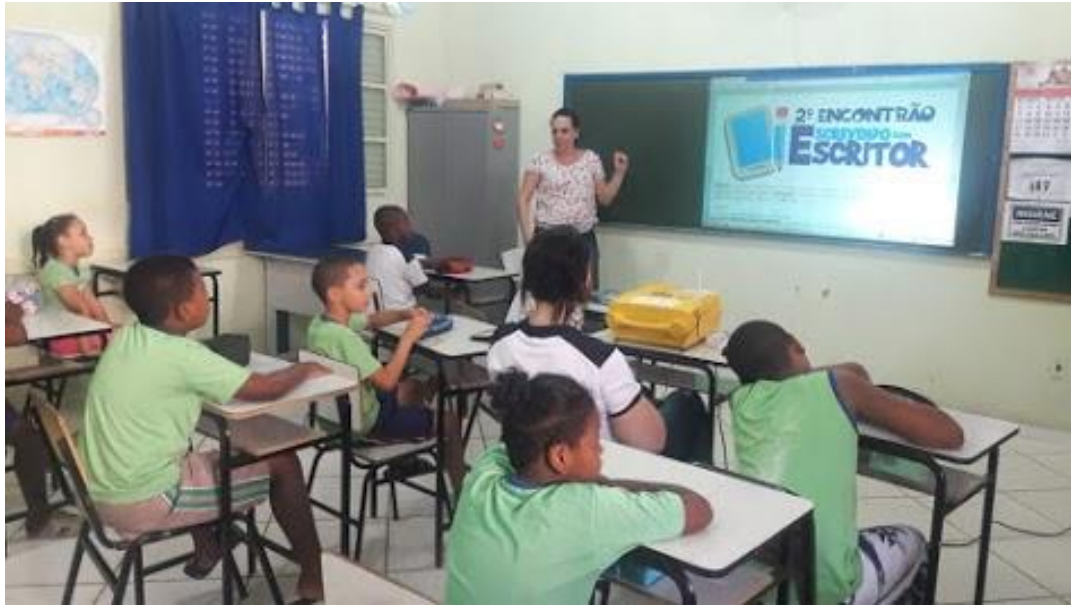
Figura 1- Entendendo o projeto

A segunda mostra o momento em que os alunos assistiam ao vídeo do escritor, onde ele mandava um recado para os alunos e estes estavam atentos ao recado. Recado esse, onde o escritor os convidava para participar do projeto.