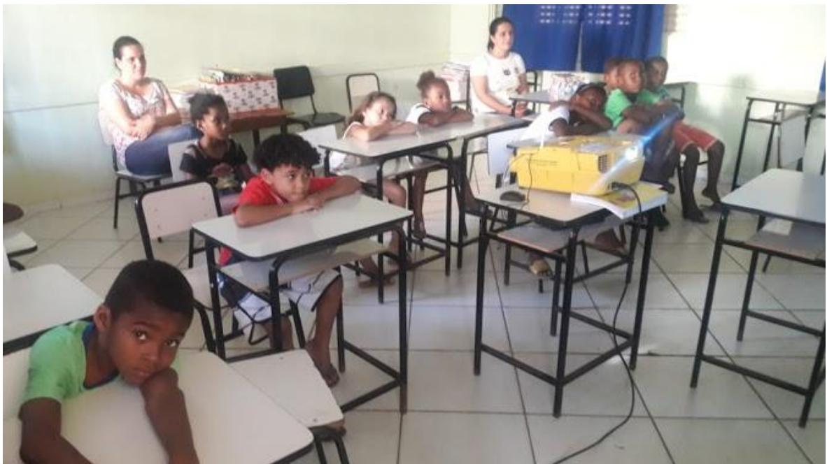
.Figura 2- É hora de assistir ao vídeo

A segunda mostra o momento em que os alunos assistiam ao vídeo do escritor, onde ele mandava um recado para os alunos e estes estavam atentos ao recado. Recado esse, onde o escritor os convidava para participar do projeto.