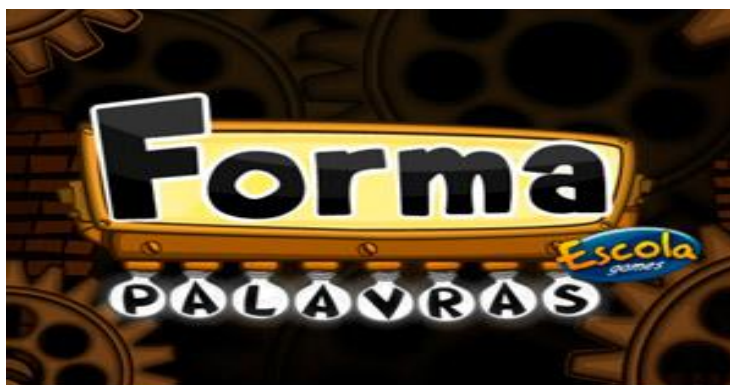
Figura 1: Forma Palavras