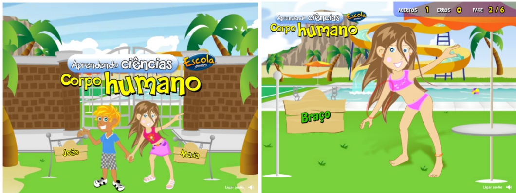
Figura 1 – Site Escola Games – Jogo Corpo Humano